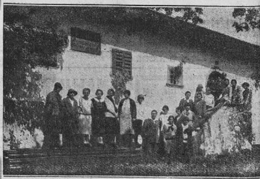
Prešernova rojstna hiša na Vrbi