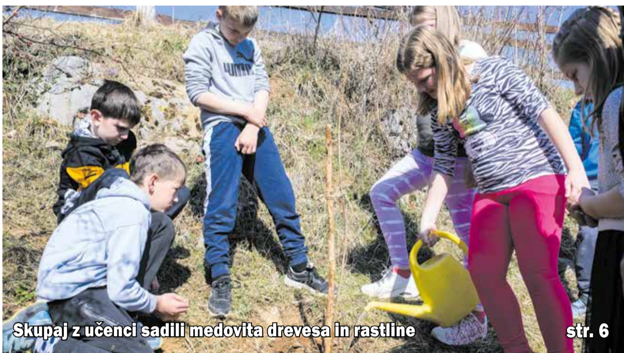
Skupaj z učenci sadili medovita drevesa in rastline