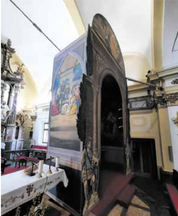
Tri dimenzionalna kulisa božjega groba

razširjali na Slovenskem od 17. stoletja dalje. Tako je v 18. in 19. stoletju po župnijskih cerkvah nastalo več poslikanih kulis božjega groba, med katerimi je še posebej imenitna kulisa božjega groba iz 1836 v katedrali sv. Mohorja in Fortunata v Gornjem Gradu.