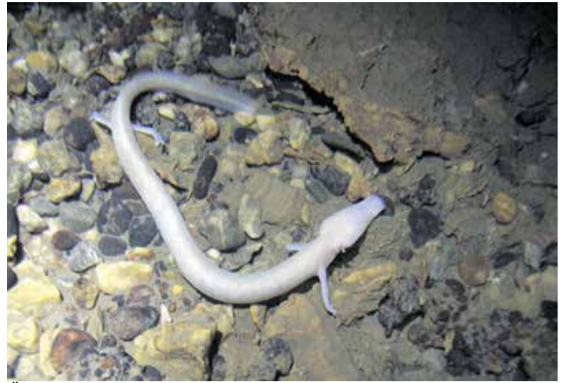
Človeška ribica.