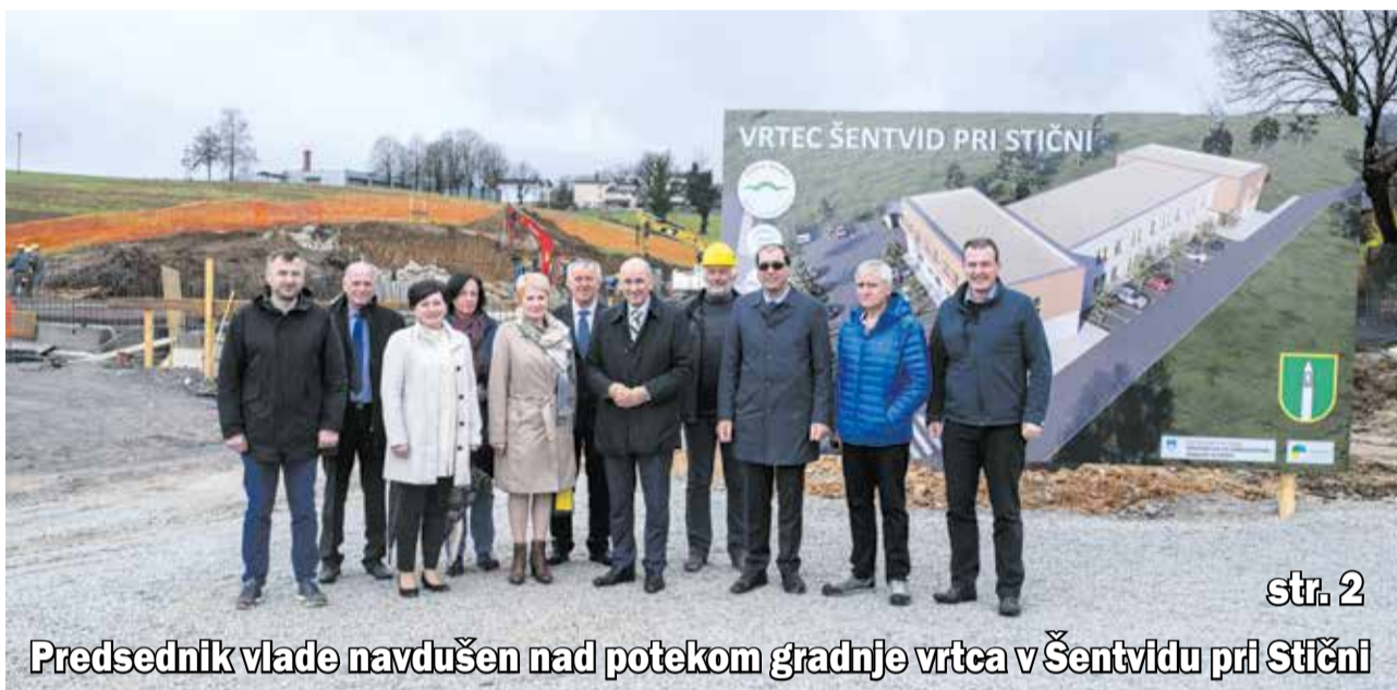
Predsednik vlade navdušen nad potekom gradnje vrtca v Šentvidu pri Stični