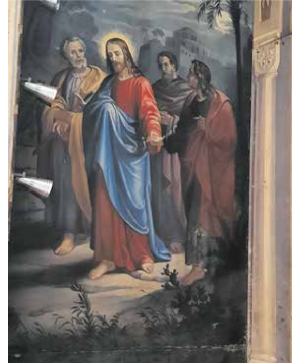
Jezus z apostoli v vrtu Getsemani

razširjali na Slovenskem od 17. stoletja dalje. Tako je v 18. in 19. stoletju po župnijskih cerkvah nastalo več poslikanih kulis božjega groba, med katerimi je še posebej imenitna kulisa božjega groba iz 1836 v katedrali sv. Mohorja in Fortunata v Gornjem Gradu.