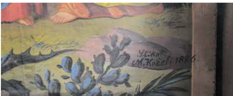
Podpis slikarja Matije Koželja z letnico izdelave božjega groba

Izvor za postavljanje božjih grobov v cerkvah na Slovenskem predst-