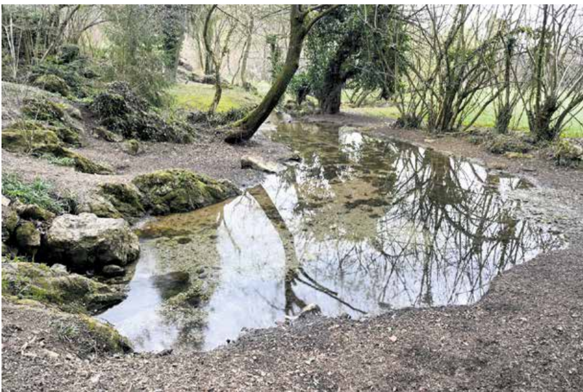
Virski studence, prvo najdišče človeške ribice.

Delovna skupina istega dne predhodno izvede srečanje tudi v Ivančni Gorici.