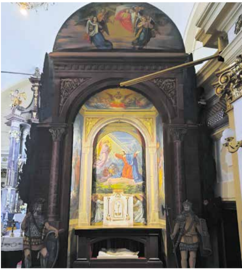
Božji grob v šentviški župnijski cerkvi