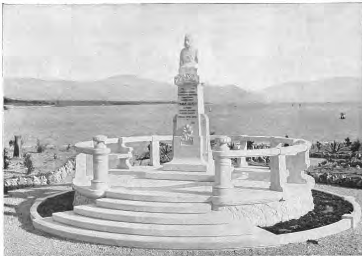
SPOMENIK CESARJA FRANCA JOŽEFA I. V TROGIRU

Vprašal bi vas, pa sem prepričan, da mi ne odgovorite po svoji vesti! Vsi ste enaki, prav vsi: vi, ki prevračate popirčke po cestah, ali pa ste se oprli ob kandelaber in preudarjate, kdo izmed šetalcev je zadovoljen in bogat, kdo je nesrečen in siromašen. Pa ste mladi in stari!