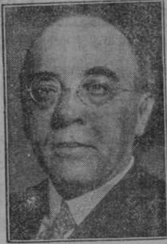
Novi francoski ministrski predsednik Sarraut.

kratkem ugasijo svojo žejo, ako se jim le temu potrebna cev nudi!