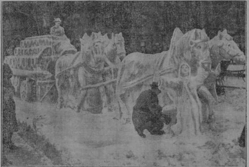
V Monakovem na Bavarskem so imeli za dnji teden toliko snega, da je ustvaril slikar Sailer prevoz piva iz snega.

Črna gora dobi še eno železnico. Doslej je posedala Črna gora samo eno železnico iz Virpazarja ob Skaderskem jezeru v Bar ob Adriji. Ta železniška zveza je v zasebnih rokah. Sedaj bodo priklopili Črnogoro s še eno železnico na drugo železniško omrežje. Pred kratkim so začeli graditi linijo, ki pelje iz Trebinja oziroma od proge Brod-Sarajevo v Nikšić in bo dolga 71 km. Tudi ta železnica bo ozkotirna, vendar bo podlaga tako zgrajena, da jo bo mogoče razširiti v normalno tirno. Pri delu je zaposlenih 3000 delavcev. Proračun v znesku 68 milijonov Din je vzet iz milijardnega kredita za javna dela.