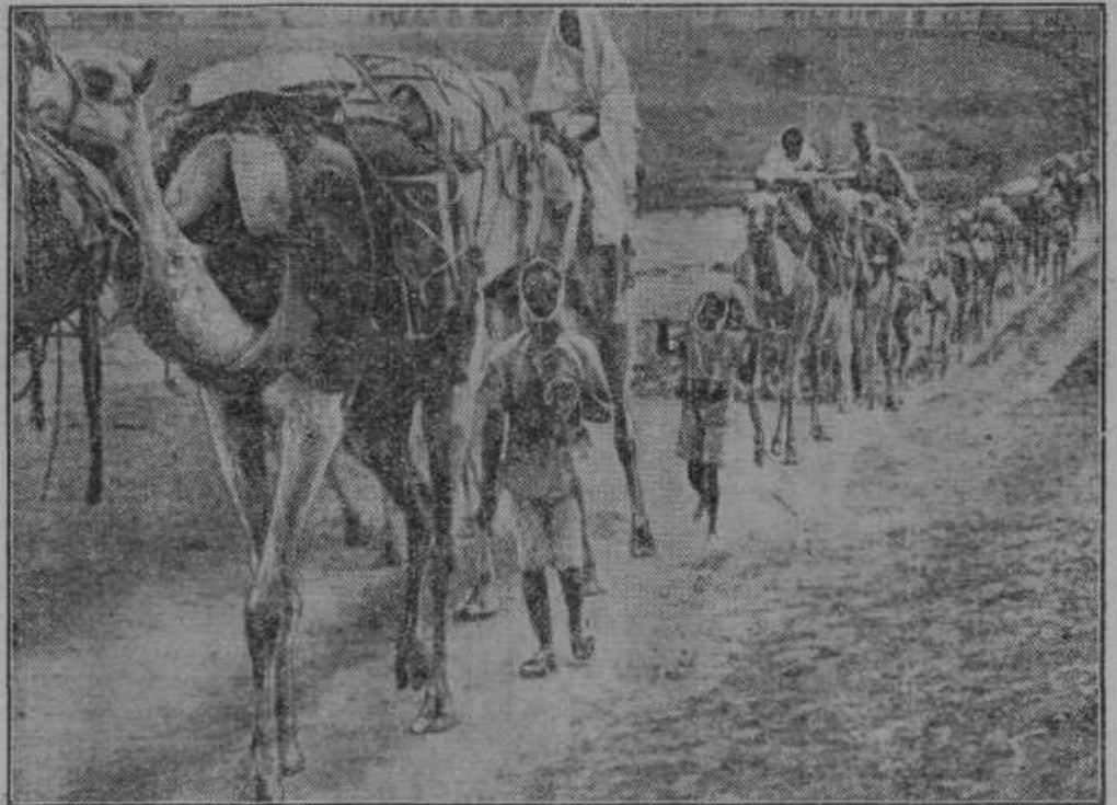
S pomočjo kamel preskrbujejo Italijani svoje čete na južnem abesinskem bojišču.