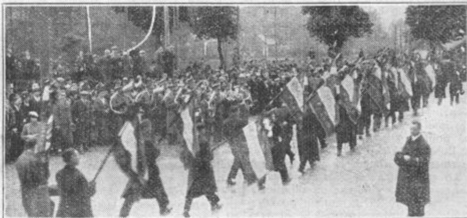
Trideset praporov izseljeniških delavskih organizacij v sprevodu po jeseniških ulicah po odkritju spomenika.