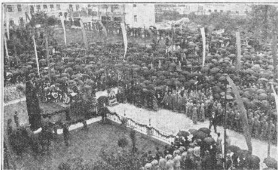
Pogled na del množice na prostoru pred narodno šolo med slovesnostjo odkritja.