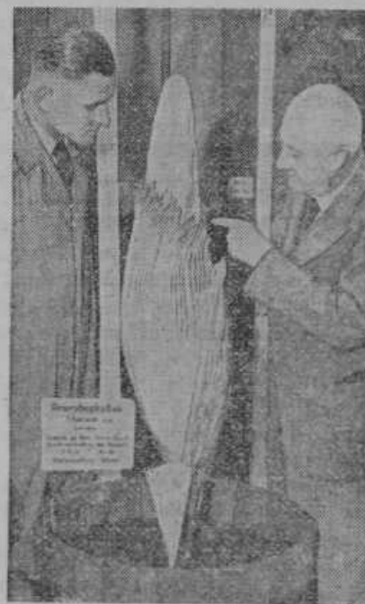
Nemški naravoslovec je prinesel iz pragozdov otoka Sumatra pod Indijo orjaško rastlino v Berlin. Rastlina je v Berlinu koj razcvetela. Listi te rastline zrastejo v dvakratni velikosti človeka