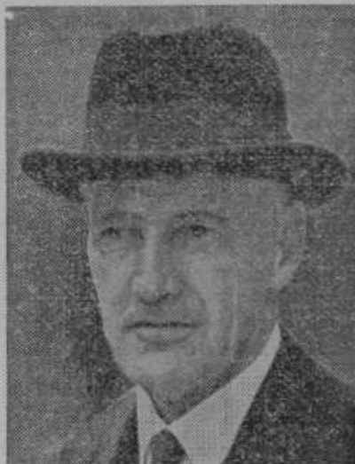
Admiral Reginald Drax, vodja angleškega vojaškega odposlanstva v Moskvi

Ormož. (Velika manifestacija prleških kmetov.) Ob za Ormož velikanski udeležbi okrog 7000 ljudi je potekla 13. avgusta prireditvev tabora Okrajne kmečke zveze v Ormožu ter s tem združene kmečke tombole. Prireditvev se je začela s petimi litanijami in blagoslovom v farni cerkvi, nakar je sledil pohod z zastavo KZ in voditelji na čelu na zborovalni prostor, ki je bil na velikanskem dvorišču graščinskega marofa. Tabor