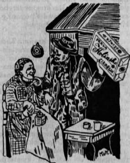
Naš pravi domači izdelek