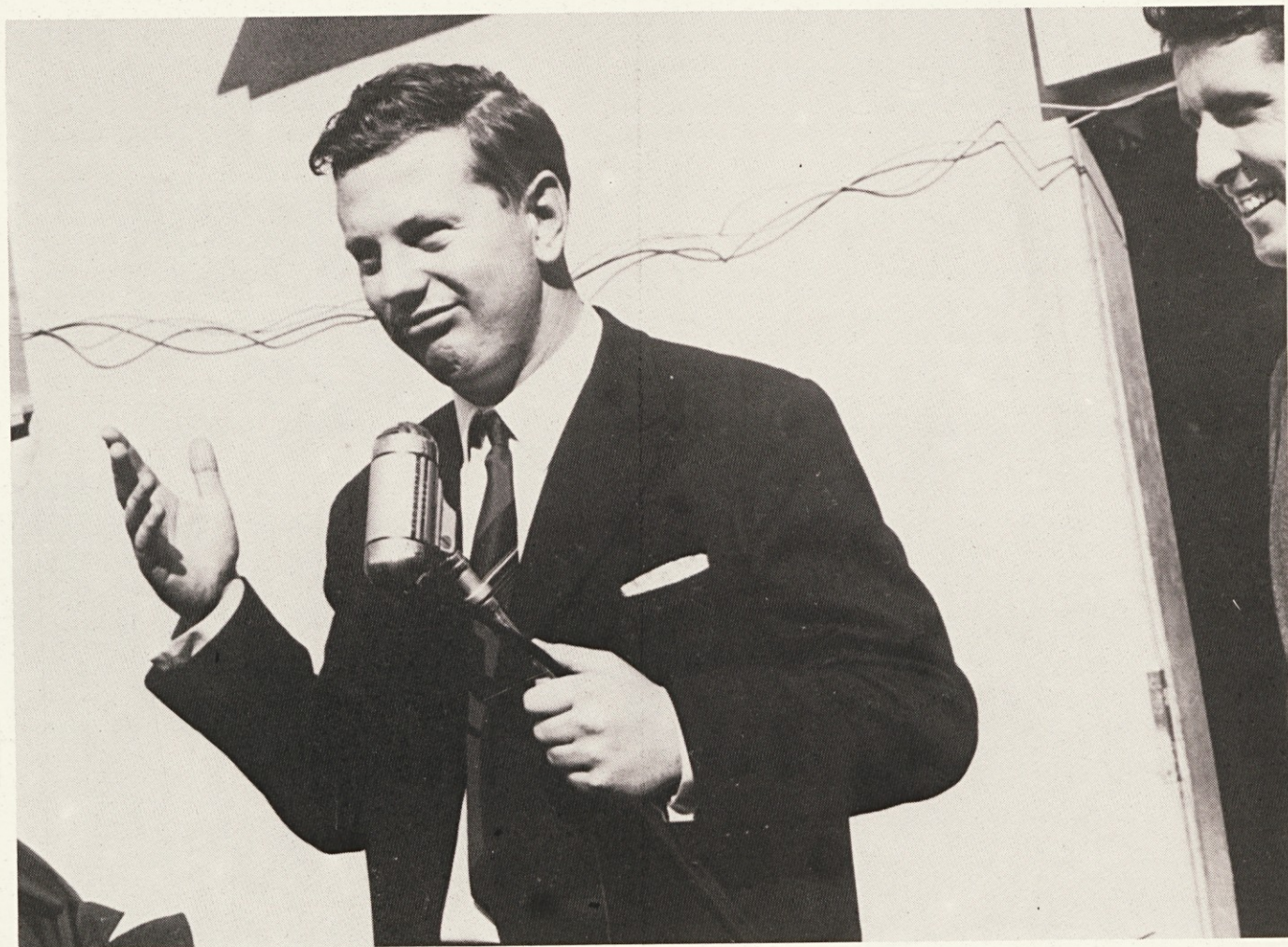
Tovarišice in tovariši . . .

„KAMNIŠKI TEKSTILEC“ LETNIK XVIII. ŠT. 3-4 GLASILO DELOVNE ORGANIZACIJE „SVILANIT“ KAMNIK GLASILO UREJUJE UREDNIŠKI ODBOR: Balantič Silvo, Huban Anka, Alenka Doplihar, Stankovič Brane, Okorn Tomaž Tehnični urednik: SKAMEN IVANA Odgovorni urednik: BORIS ZAKRAJŠEK NAKLADA: 800 IZVODOV Tisk: Mestni muzej Idrija