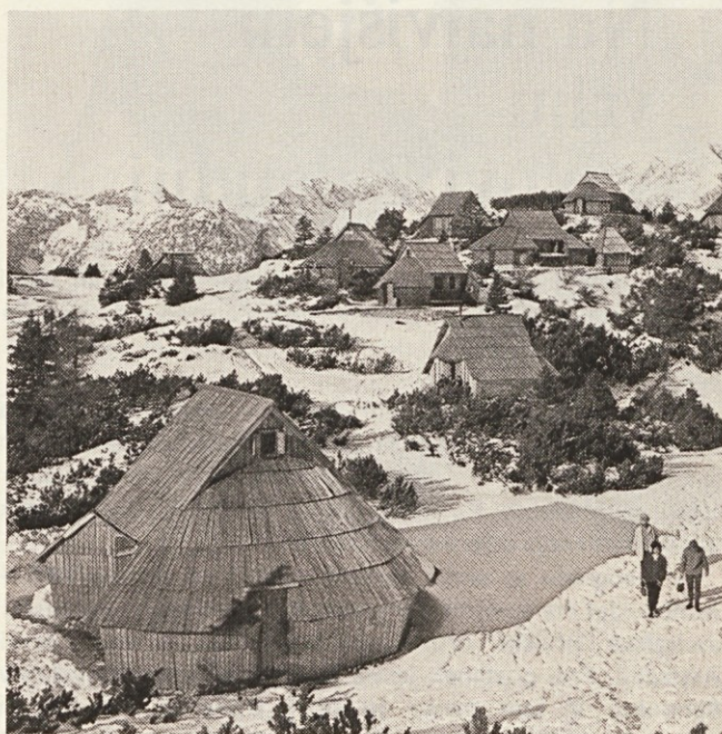
Bo Velika planina zaživela

Član interesne skupnosti je lahko vsaka organizacija združenega dela, druga organizacija ali samoupravna skup-