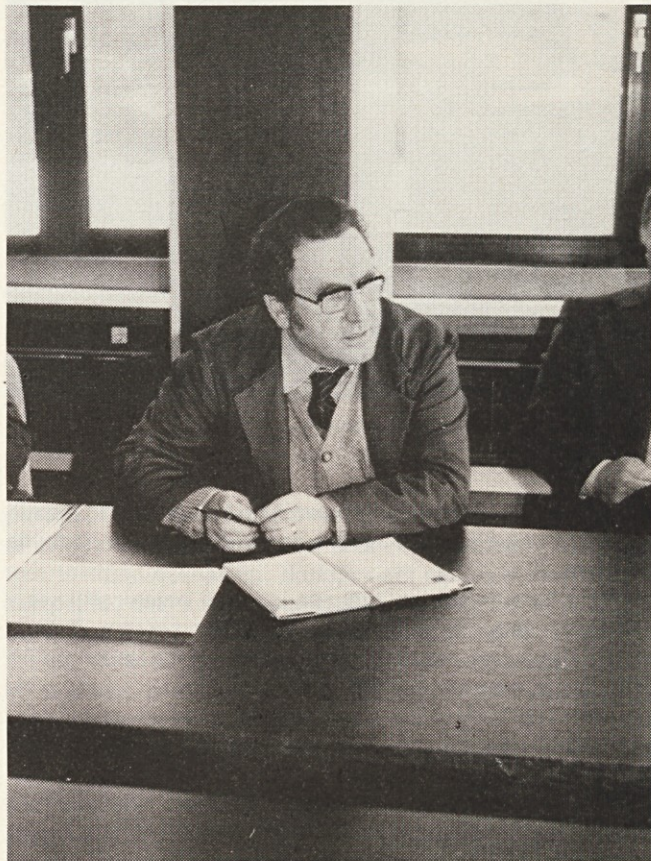
Prihranki pri energiji so še vedno možni

Analiza vzrokov zastojev zaradi slabega vzdrževanja je pokazala, da je pretežna večina podaljšanja zastojev pri posameznih strojih in napravah pomanjkanje rezervnih delov. Vzporedno ugotavljamo, da potrebni rezervni del na drugem koncu tovarne imajo. Imamo namreč grdo navado, da takoj ko prispejo rezervni deli v skladišče, le-te oddamo