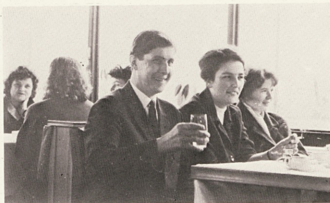
Stari dobri časi