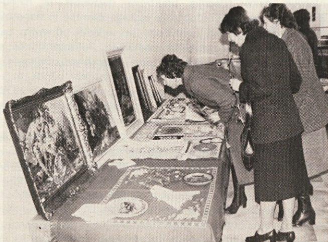
Obiskovalcev je bilo veliko