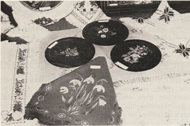
Takšne razstave naj bi bile še kdaj