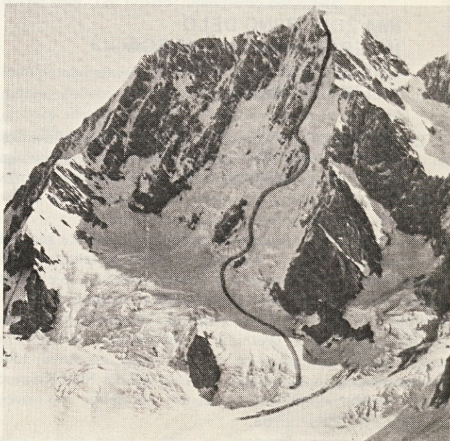
Vzpon na najvišji vrh

Naslednji dan so začeli zbirati informacije o novozeleandskih gorah, vendar so bile le-te zelo skope. Ugotovili so, da imajo domačini dobro kartografijo in specialne zemljevide, nimajo pa plezalnega vodnika – brošure, ki plezalce opozarja na opis težav in pasti, ki se lahko pojavijo med plezanjem.