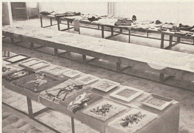
Ročni izdelki so bili zanimivi