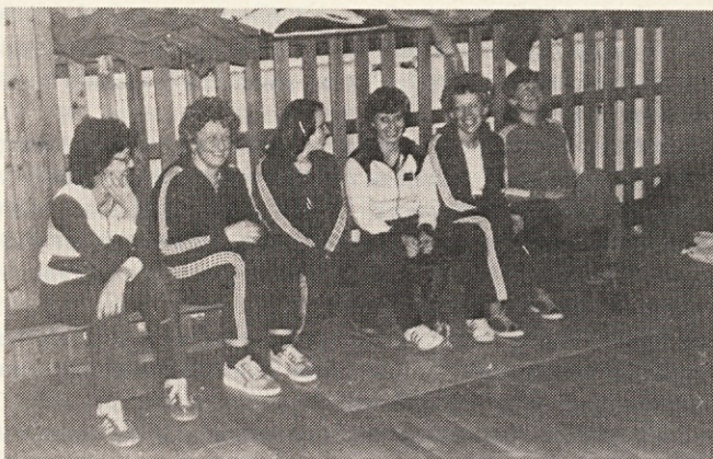
Želijo, da se jim priključite

smo si takoj pripeli smuči in smuk po strmini. Po dveh urah smučanja in ogleda terena smo se odpeljali nazaj v Maribor v hotel „Turist“, kjer nas je že čakalo kosilo. Med kosilom in večerjo smo imeli ravno toliko časa, da smo si na hitro ogledali del Maribora in nekaj trgovin z železnino, kjer smo kupili pilo za naostritev robnikov. Ko smo se vrnili iz potepanja, se je že začel televizijski prenos drugega teka slaloma iz Olimpiade. Po končani oddaji smo se kljub rahlemu razočaranju posedli za mize, kjer nas je čakala okusna večerja. Siti in dobro razpoloženi smo se okrog 22. ure razšli po sobah.