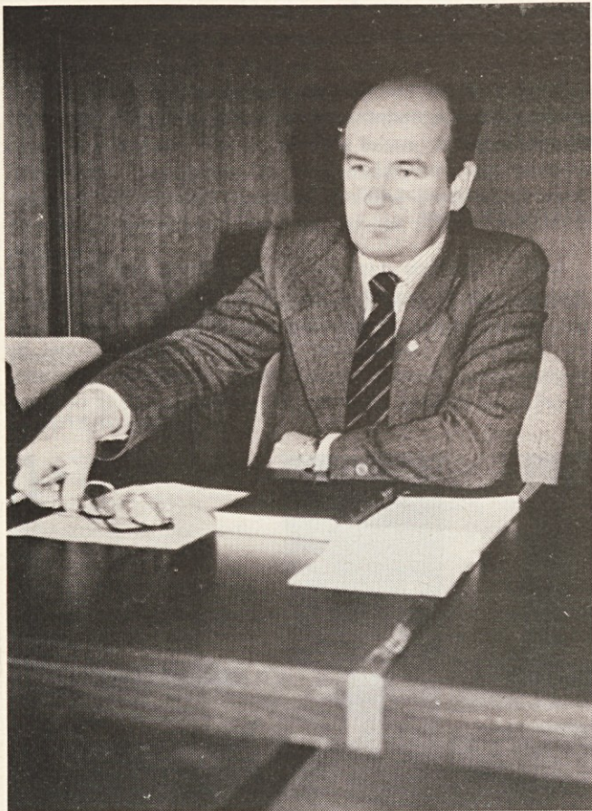
Notranjih rezerv imamo še dovolj

kritičen saj se v preteklosti ni manjkalo kritičnosti do lastnih slabosti, kar vse je imelo ugodne posledice za dobre poslovne rezultate.