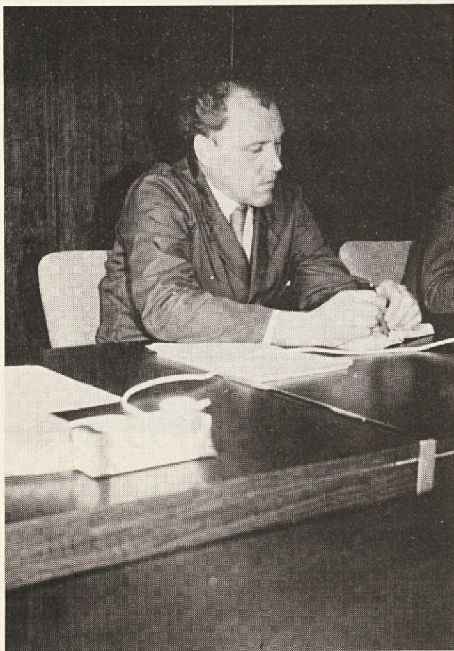
Dograjevati moramo sistem nagrajevanja

Prvi odraz stabilizacije se pokaže na našem žiro računu. Če na tem ni sredstev, potem ne moremo tekoče nabavljati elektro materiala, niti izplačevati osebnih dohodkov. Tega si