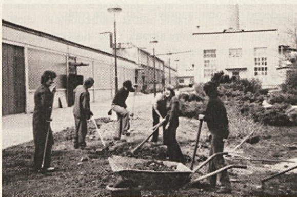
Na akciji le najbolj aktivni

Naštela sem le nekaj pozitivnih strani in pa nekaj slabosti našega tromesečnega dela v tem mandatnem obdobju, vendar upam, da se bo naše delo izboljšalo, saj je v naši OO že sedaj čutiti, da se je le „premaknilo“ na bolje. Vložiti moramo še več volje, da bomo zastavljene naloge v čimvečjem obsegu in kvalitetno opravili.