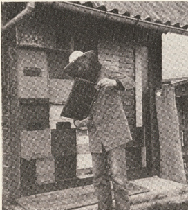
Pri čebalarskem opravilu

Prvo in najvažnejše za čebelni kraj je bogata paša, kjer morejo čebele veliko nabrati in domov prinesti. Kjer je blizu in naokoli veliko cvetja in cvetic, je najboljši kraj. Prostor, kjer so nastavljene, naj bo solnčen. Solnce jih vabi k pridnosti, jih ogreva pri hladnem vremenu, jih osuši, kadar se zmočijo, da, celo utopljene zopet oživi.