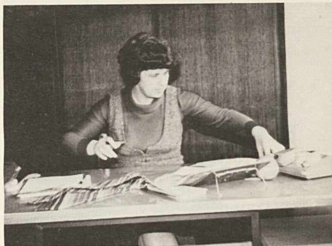
Mislím, da so arhitekti svojo nalogo dobro rešili