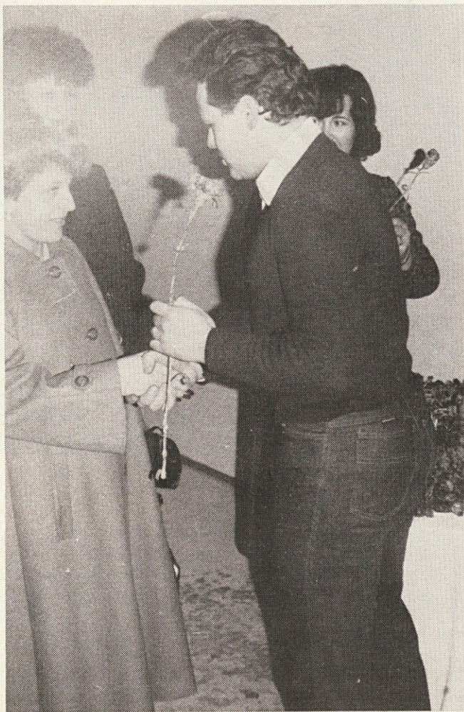
Nagelj za Dan žena

Kot simbolično darilo so mladinci vsaki delavki ob izrečni čestitki izročili rdeč nagelj. Pred kulturnim programom je direktor delovne organizacije na kratko prikazal zgodovino razvoja tega praznika ter orisal prispevek vseh zaposlenih delavk za razvoj naše delovne organizacije. Po njegovi iskreni, preprosto izrečni čestitki je skupina mladincev s svojim kulturnim animatorjem pripravila krajši kulturni program. Po skrbno izbranem in dobro podanem