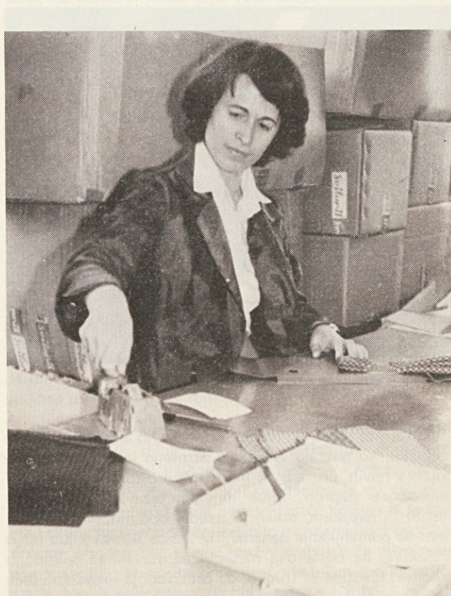
Težko pričakuje žaluzije