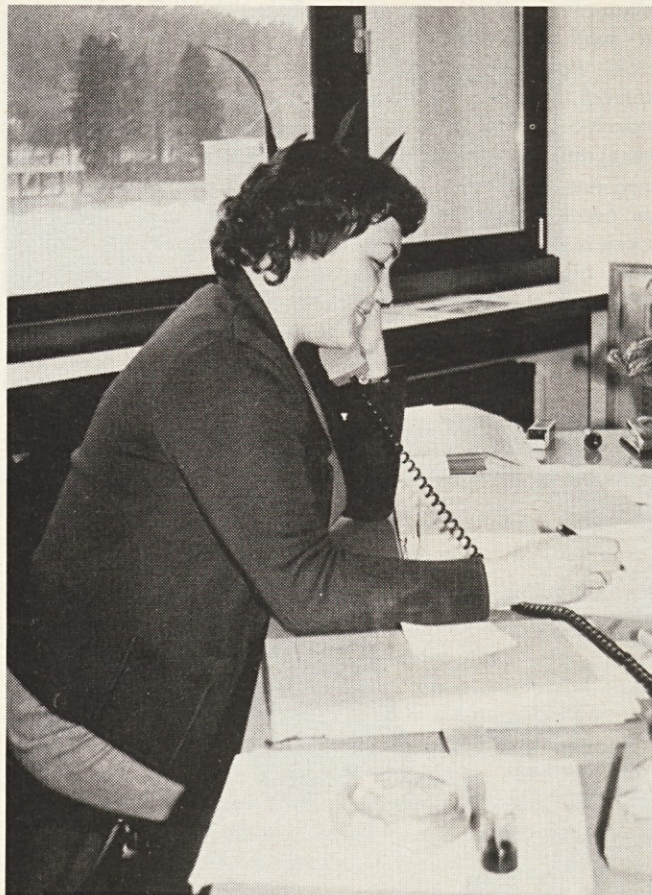
Zadovoljna v novih prostorih

Tu sem zaključila svoj pohod po sončnih in senčnih straneh nove zgradbe TOZD Svila in nove upravne zgradbe Svilanita. Bila sem zadovoljna. Iz pogovorov bi lahko