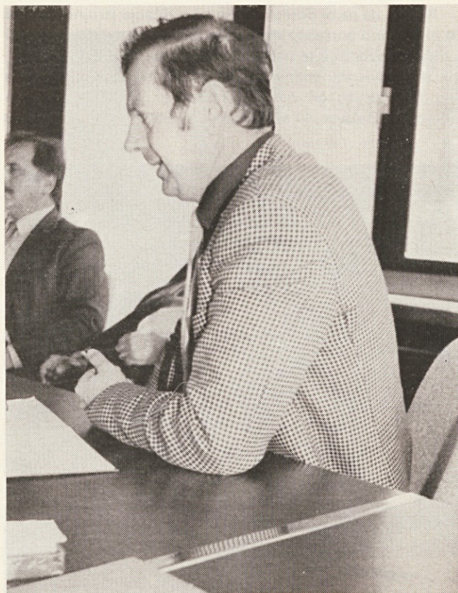
Rojeva se nova konkurenčna tovarna

Zaskrbnjujoči pa so nekateri ukrepi, ki jih je omenil že tov. Jenko. Gre namreč za to, da imamo omejena sredstva za potne stroške, dnevnice ipd. Mi smo za leto 1980 odločili, da bomo zaposlili še enega trgovskega zastopnika, zavedajoč se, da se v Bosni in Hercegovini pojavlja konkurenčna tovarna. Zatorej bodo morali biti pristopi k reševanju tega vprašanja resnično zavzeti.