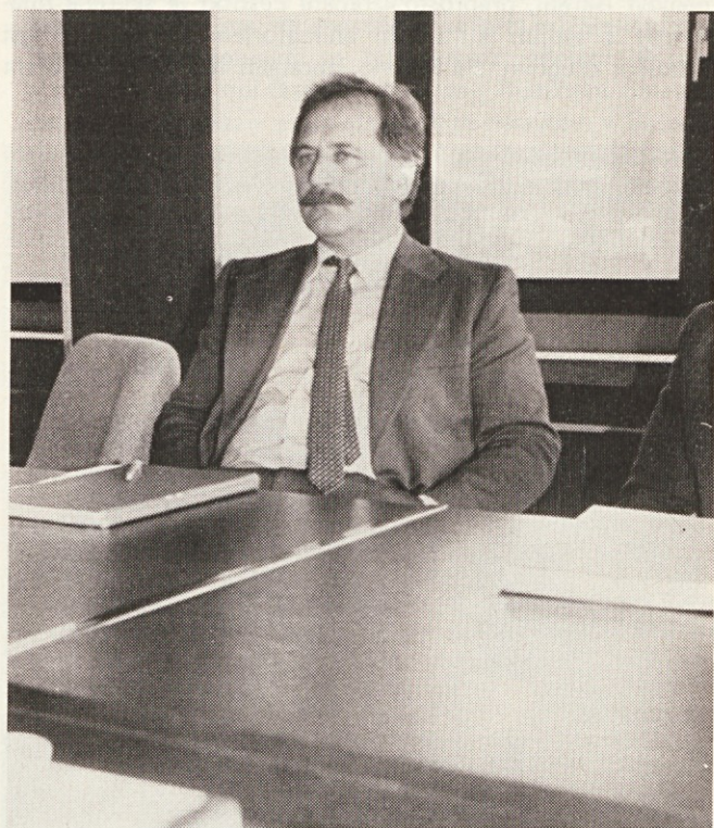
Težave bomo premostili

Če gledamo Svilanitov program izvoza moramo reči, da smo v preteklosti mnogo vložili, in verjetno se ta trud danes obrestuje. Smelo trdim, da je toliko povpraševanja, da ga ne moremo pokriti. Tisti del, s katerim pokrivalo vse potrebe uvoza, izpolnjujemo. Svilanit je v preteklosti toliko vlagal v razne veje ali drugače frotirja, da je lahko v kateremkoli področju popoln v ponudbi. Danes imamo samo zapadni trg, odpira pa se nam vzhod, konkretno Irak. Konstantne posle bi lahko sklenili že s temi državami. Izredno zreducirane količine grede recimo za Anglijo. Če govorimo o teh povpraševanjih, jih ne moremo pokriti, če pa govorimo v celoti o asortimanu kot takem — Svilanit ima tak asortiman, ki je lahko na teh zunanjih policah čisto identičen, enako kvaliteten kot ga imajo zahodni proizvajalci.