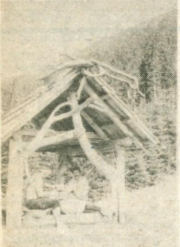
Planinca je ob poti na Roblek prvo počivališče.