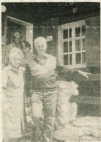
Trdanova sta že tretje leto oskrbnika v koči na Robleku, 1657 m visoko.

Tu boste dobili čaj, se okrepčali še s kakšno drugačno kapljico, če boste pa že lačni, vam bo pa gospodinja postregla s klobaso iz zaseke ali pa z ajdovimi žganci. Tudi kislo mleko obljublja v teh dneh. Naj povemo še to, da se do Poljške planine pride tudi čez sv. Petra. Vendar člani Planinskega društva Radovljica to pot odsvetujejo, ker so jo gozdarji tako zdelali, da se v gozdu zgubiš. Nekaj drevcev s markacijami so namreč posekali, novih pa ne označili. Zato pojdite na Poljško planino raje ali iz Drage ali iz Žirovnice, iz tržiške strani pa čez Preval.