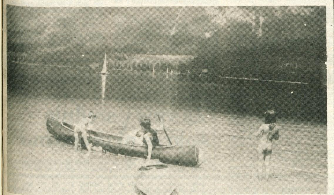
Kopanje v Bohinjskem jezeru je lahko prijetna osvežitev v vročih »pasjih dneh«.