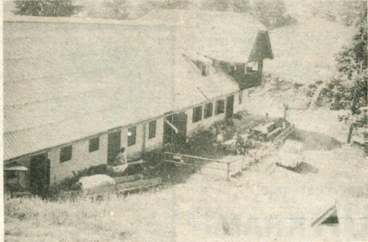
Na Poljški planini je vedno živahno. Tu je že čez 1000 m višine.

a raje pojdite peš. Prvič je škoda avtomobila, drugič je pa vse do prve kočice, do Planince, speljana izredno lepa gozdna bližnjica. Če ste se pa upehali, malce posejite na klopki pred hišo, osvežite se pri studencu. Gvažarjevi iz Begunj, ki imajo letos hišico v najem, zagotovo ne bodo imeli nič proti, če se usedete v njihovo prijetno utico. Le svinjarije ne pustite za seboj!