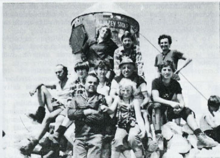
Tokrat se nas bo mnogo več zbralo na vrhu Triglava (glej prispevek na 5. strani!)

Zakon o plačilni bilanci Sloveniji za letos nalaga, da mora ustvariti za 381 milijonov dolarjev več deviz, kot pa jih bo porabila za uvoz in druge potrebe. Slovenija mora z izvozom letos iztržiti 3,8 milijarde dolarjev, kar je dobre pol milijarde dolarjev več, kot pa jih je lansko leto.