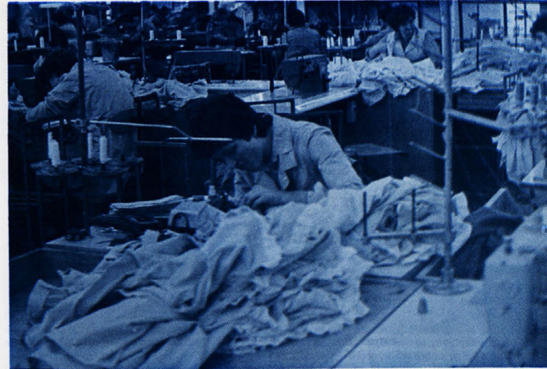
V TOZD Libna, od kjer je posnetek, bolniška še vedno raste zato bo nujno, da se bodo delavci v posameznih delovnih sredinah med seboj odkrito pogovorili o vseh neopravičenih primerih.

Torej, prijave za izlet na TRIGLAV, ki bo koncem avgusta letos, zbirajo zadolženi delavci po TOZD do 6. avgusta. Prijavite se v čim večjem številu.