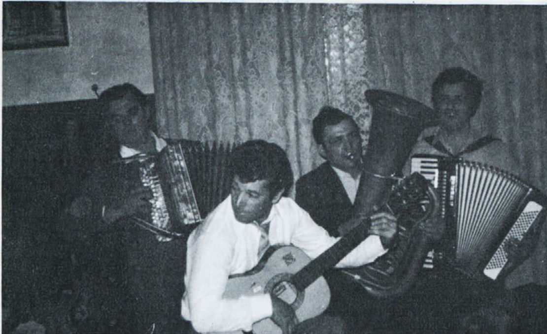
Naši šoferji imajo svoj ansambel, ki zaigra na njihovih srečanjih. Tudi ob dnevu šoferjev si bodo zaigrali in si tako s polno dobre volje zaželeli „srečno pot“.