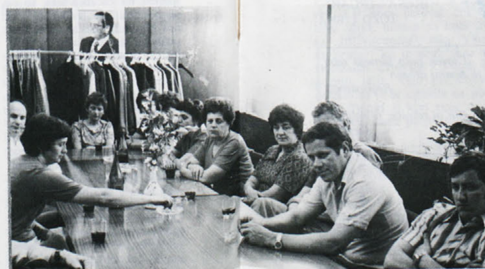
Iz obiska predsednikov IO OOS iz novomeških delovnih organizacij.

Po pogovoru, ki mu je bil glede na teme, ki so se razvile – čas prekratko odmerjen, so si gostje ogledali tudi proizvodnjo TOZD LOČNA.