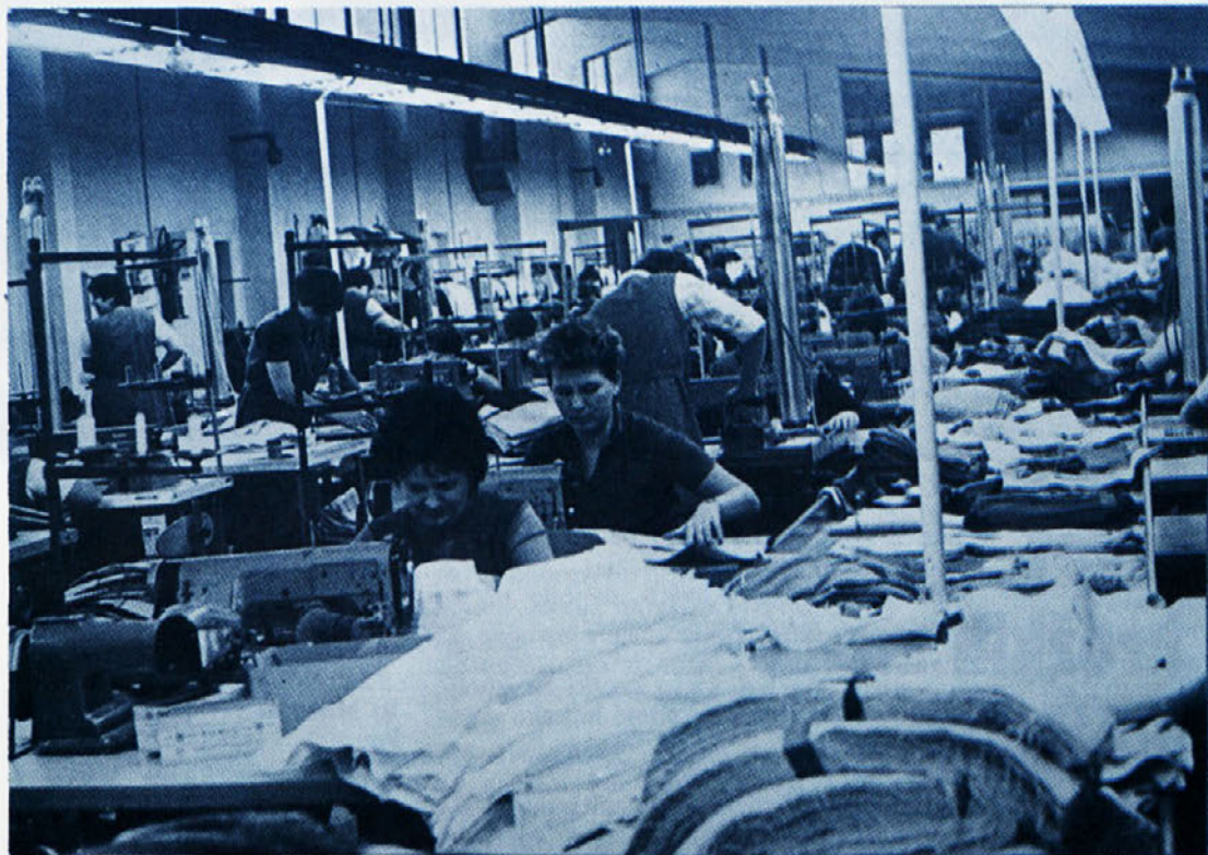
Posnetek iz idrijske Zale.

Na dan 27. junija 1950 so poslanci ljudske skupščine FLRJ sprejeli temeljni zakon, na podlagi katerega so upravljanje s takratnimi državnimi gospodarskimi podjetji in višjimi gospodarskimi združenji, prevzeli delovni kolektivi. Sprejem tega zakona bo najpomembnejše zgodovinsko dejanje ljudske skupščine po sprejemu zakona o nacionalizaciji sredstev za proizvodnjo. S prevzemom sredstev za proizvodnjo v državne roke se še ni uresničilo akcijsko geslo delavskega gibanja „tovarne delavcem“, ker to geslo ni abstraktno propagandistično geslo, temveč ima globljo vsebino. V sebi vsebuje ves program socialističnih odnosov v proizvodnji, glede družbene lastnine, glede pravic in dolžnosti delavcev, torej se lahko uresniči in se mora uresničiti v praksi, če mislimo na resnično izgradnjo socializma.“ je dejal tovariš Tito v govoru ob izdaji predloga temeljnega zakona o samoupravljanju, 27. junija