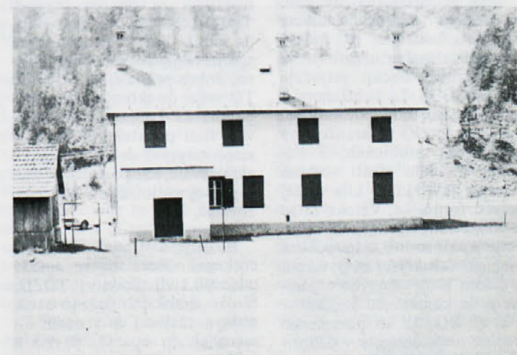
Počitniški dom v Trenti bo kmalu oživel.

V lepi dolini Trente se bodo naši otroci gotovo dobro počutili, saj desetdni svežega zraka in sproščene počitniškega življenja med vrstniki, bo po dolgem šolskem letu vsem udeležencem dobro delo. Vsem želimo veliko zadovoljstva in prijetnega počutja!