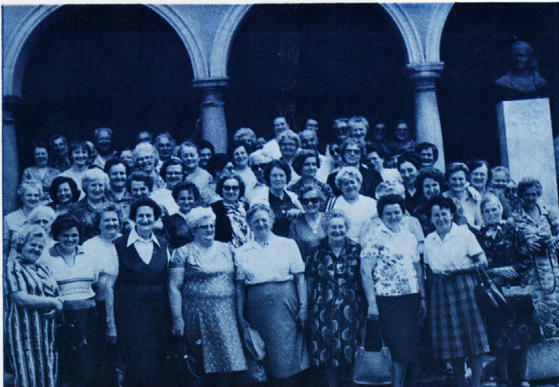
Upokojenci iz Delte, ki so se udeležili izleta v Novo mesto, med njimi pa so na posnetku tudi člani IO sekcije upokojencev iz novomeškega dela Laboda.

Sonce se skriva iza oblakov, noče nas ogreti, nam pa je tudi prav, saj nas znoj krepko obliva. Počasni se vzpenja kolona, noga se vzdiguje pod-