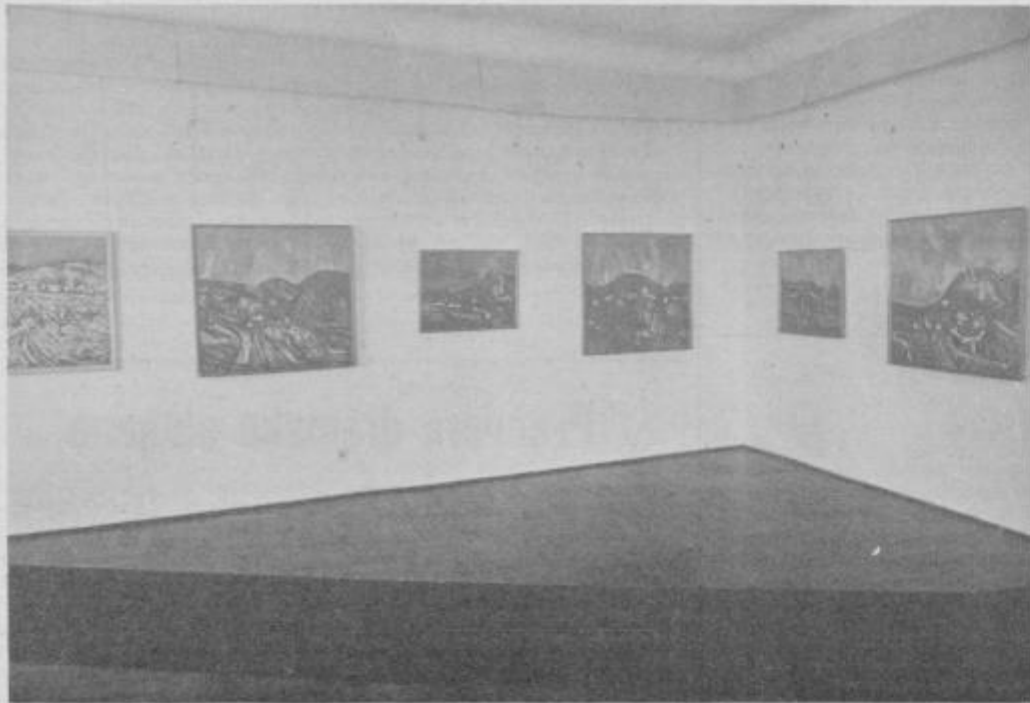
Spomin na lansko razstavo v galeriji na ptujskem gradu: ciklus haloških krajin iz prve polovice sedemdesetih let.