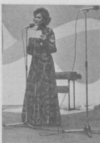
Na festivalu leta 1975.

Tako je bilo tudi takrat, ko sem bila še sama študent. Neko jutro sem videla na vratih poziv, da naj se študentje prijavijo za statiranje v filmu Dobri stari pianino. Najprej je bila seveda avdicija. Odziv je bil velik. Kar nekaj kolegic iz študentskega naselja se nas