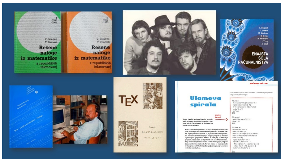
Slika 2. Prispevki k popularizaciji in razvoju stroke.

tekmovanj , nekoliko kasneje pa tudi zbirke tekmovalnih nalog iz računalništva. Je avtor številnih poljudnih člankov za revijo Presek in njen dolgoletni urednik za področje računalništva. S temami o računalništvu, teoriji grafov in uporabi računalnika pri pouku matematike je sodeloval na številnih seminarjih DMFA za učitelje matematike, v šolah je uvajal in spodbujal uporabo programskega jezika Logo za najmlajše, sodeloval pa je tudi z Zavodom za šolstvo pri projektu Računalniško opismenjevanje . Njegov Sredin seminar za računalniško matematiko je bil več desetletij zapored stičišče ustvarjalnih idej takrat še mladega področja računalništva v Sloveniji. Kot soavtor obsežnega priročnika za uporabo sistema TeX za stavljenje matematičnih besedil skupaj z B. Gollijem je prof. Batagelj prenekateremu slovenskemu matematiku ali fiziku olajšal pisanje člankov, visokošolskih učbenikov in drugih del, ki so obogatila zakladnico strokovne literature v slovenskem jeziku.