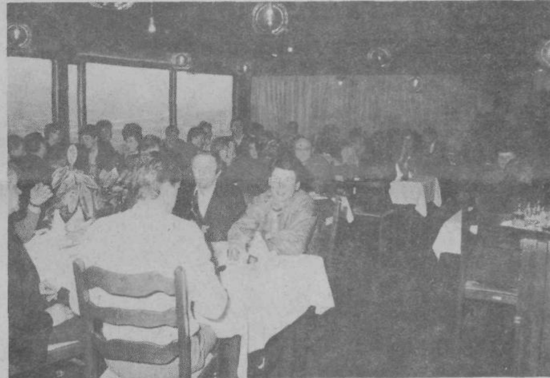
Delavci Splošnega mizarstva so ob dobrih doseženih rezultatih z zadovoljstvom praznovali