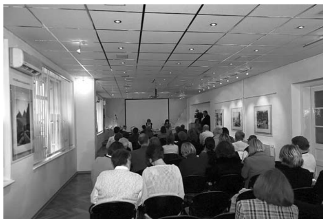
Dvorana Slovenskega doma v Zagrebu.