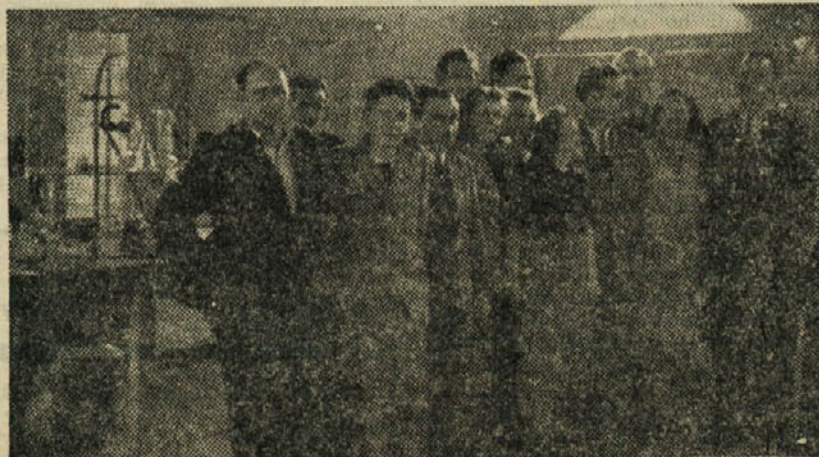
Tečajniki ob zaključku izpita tečaja laborantske stroke

Uprava trboveljskega rudnika posveča vso skrb vzgoji novih kadrov v različnih strokah. Pred kratkim se je zaključil v Trbovljah laborantski tečaj, katerega je obiskovalo 11 tečajnikov. V tečaju, ki je trajal štiri mesece, so se tečajniki seznanjali s praktičnim in teoretičnim delom. Tečajniki so tečaj redno obiskovali in je v tem pogledu ta tečaj lahko vzgled