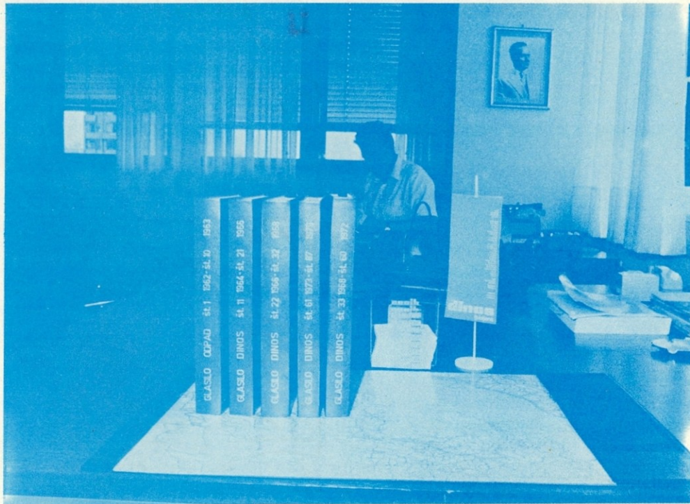
Pet knjig našega glasila

Še en korak naprej glede čitljivosti in izgleda smo napravili, ko nam je glasilo začela tiskati najprej Tiskarna Ljubljana, nato pa Tiskarna Tone Tomšič. To je bilo v letih 1977 do 1979. Obe tiskarni sta nam tiskali glasilo v klasičnem, knjižnjem tisku, ki je najlepši, toda tudi drag, ker vsebuje veliko ročnega dela. Za ti dve tiskarni pa smo imeli tudi premajhno naklado, 500 do 600 izvodov. Iskati smo morali drugačno rešitev in