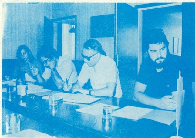
Iz seje DS TOZD Regeneracija tekstila