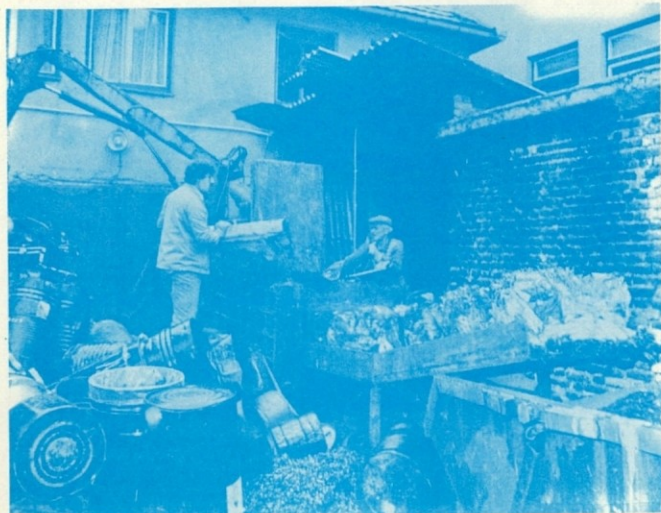
Pri stiskalnici jeklenih odpadkov v Trbovljah.