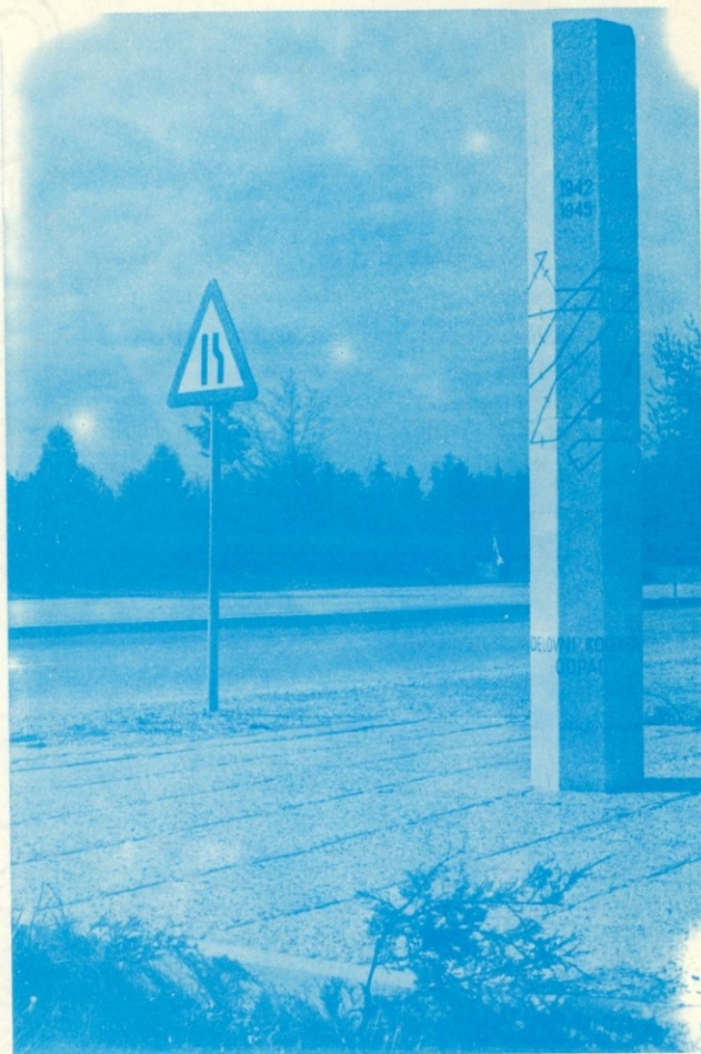
Naš spominski kamen na bodečo žico okrog Ljubljane, s katero je italijanski okupator leta 1942 ogradil Ljubljano, da bi v njej strl narodnoosvobodilno gibanje.

Naročilo pošljite na naslov: PREŠERNOVA DRUŽBA, Borsotova 27, Ljubljana.