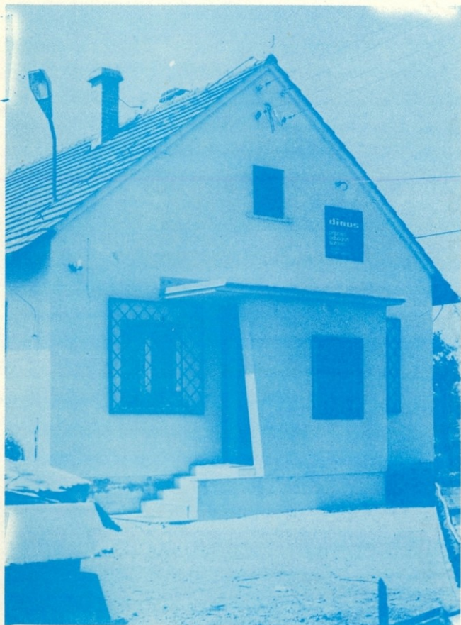
Nov vhod v pisarno murskosoboškega skladišča.

Asfalt bi vsekakor omogočil bolj spretno ravnanje z vozili, predvsem pa je pomemben zaradi lažjega urejevanja skladišča in čistoče okolja. Nenazadnje tudi