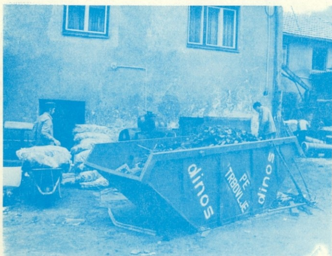
Trbovlje: Kontejnerski koš rezanih jeklenih odpadkov.

Vodstvo mladinske organizacije vsekakor nima lahkega dela, toda nekaj uspehov je že poželo. Če bo vztrajno, bo uspehov še več. To jim tudi od srca želimo.