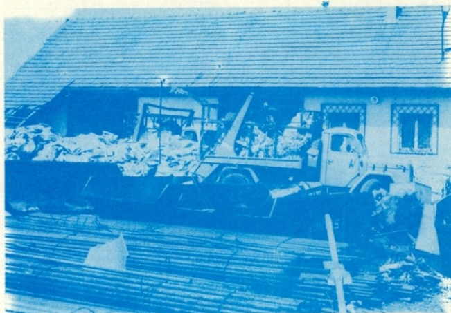
Cevi, kontejnerski koši, papir, kamijoni. Velika stiska za prostor v Murski Soboti.

V zimsko-športni aktivnosti pa so bila sindikalna trimska tekmovanja motivacija za treniranje posameznikov in pripravljanje na tradicionalnih občinskih smučarskih tekmovanjih občine Ljubljana Bežigrad že 5 let nazaj. Ozek krog navdušenih smučarjev pred petimi leti se je zdaj že močno razširil. Na prvem tekmovanju so sodelovali le 4 tekmovalci, naslednje leto že 6.