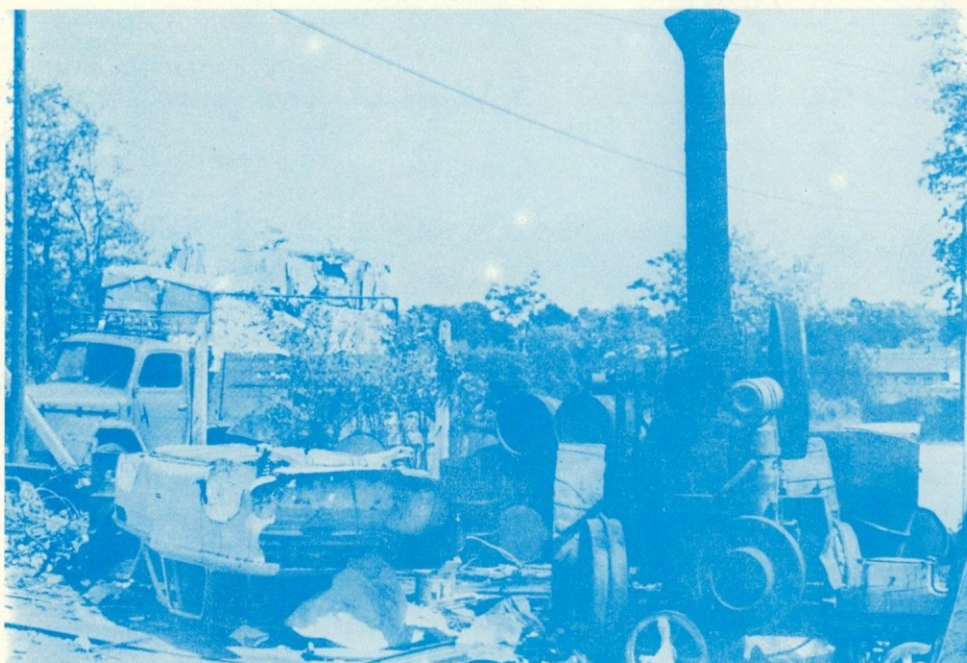
Lokomobila na murskosoboškem skladišču.

voljni, če bi med delavci vladali slabši odnosi, če bi bil vodja skladišča slab, če bi imeli majhne osebne dohodke? Mislim, da ne, to pa je tudi legitimacija našega skladišča v Murski Soboti, kjer pridno dela 16-članski kolektiv.