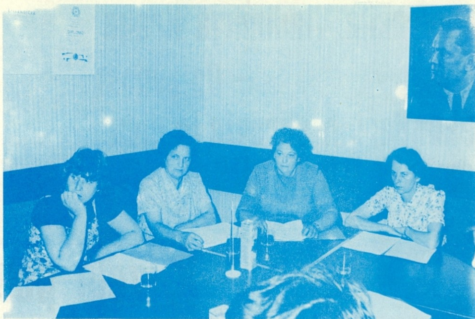
Iz seje DS TOZD Regeneracija tekstila.

sovno uresničevanje že podpisane pogodbe o dolgoročnem poslovnem sodelovanju z DO IPOZ o skupnem programu priprave odpadkov za izvoz in participacijo na devizni ceni.