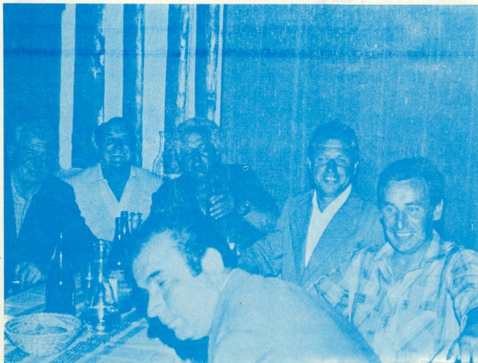
Iz poslovilnega večera v gostišču pri Anderliču.