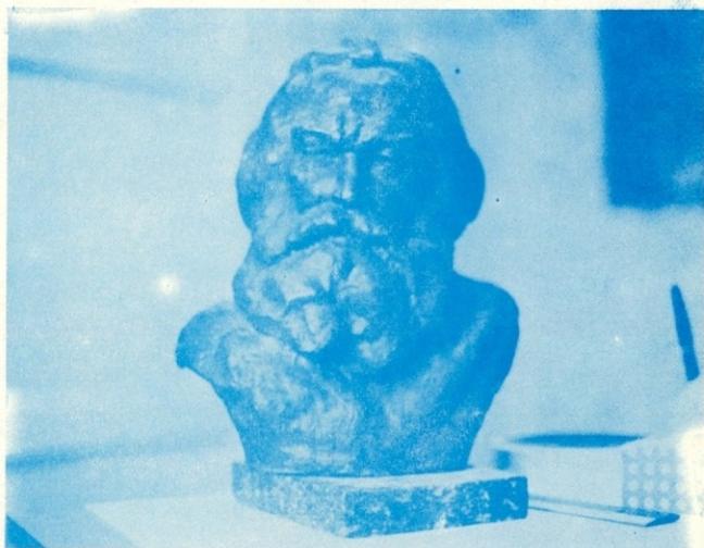
Doprni kip Karla Marxa (?) je visok kakšnih 40 cm.

To je zanimivo saj niso vsi šoferji taki, obenem pa to pomeni, da šoferji v Murski Soboti delajo z veseljem in „so za hišo“. Bi delali tako, če bi bili nezado-