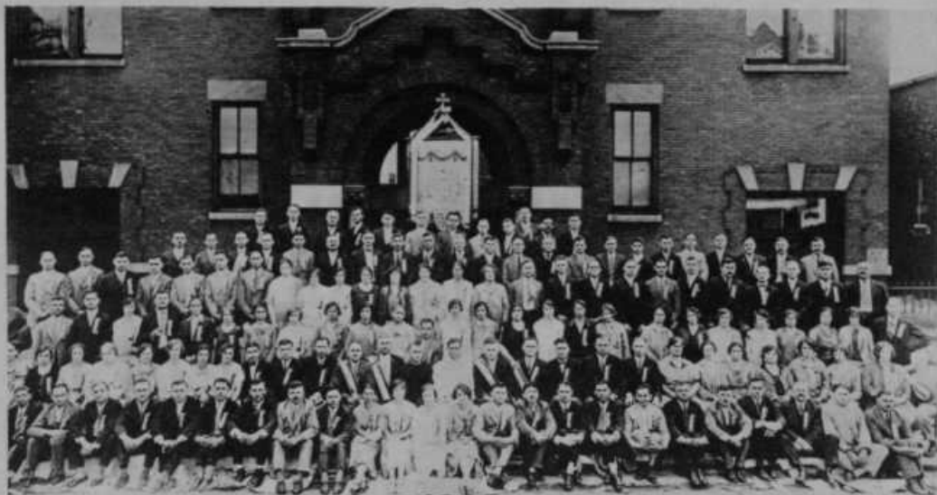
Prekmurci na evharističnem kongresu v Čikagi.