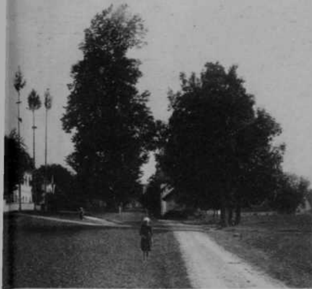
Msista v Predosljih pri Kranju.