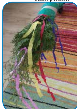
Okrašeni bor na vozu

smo ga potrebovali. Izdelali smo si šopke, okrasili naš bor in voz z rožami iz krep papirja. Razdelili smo si vloge in pripravili obleke. Seveda je bilo naše otroško borovo gostüvanje veliko bolj preprosto kot tisto pravo. Ta običaj smo pokazali predvsem skozi tradicionalne like, povorko z vlečenjem bora in petjem pustnih pesmic.