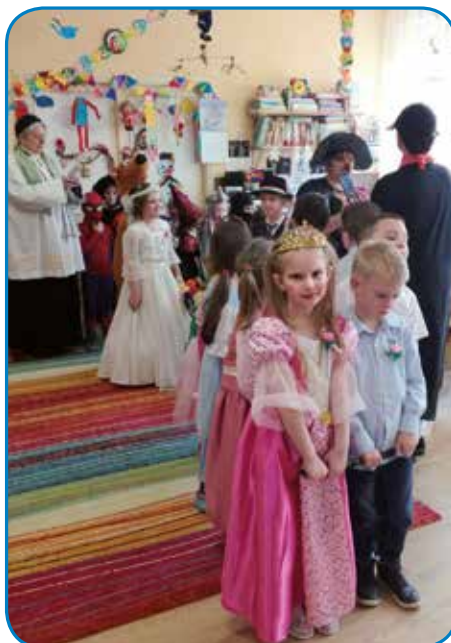
Otroci in vzgojiteljice slovenske skupine v monoštrskem vrtcu so pripravili borovo gostüvanje

papirja. Na pomoč so nam priskočili tudi starši otrok, ki so nam priskrbeli material, ki