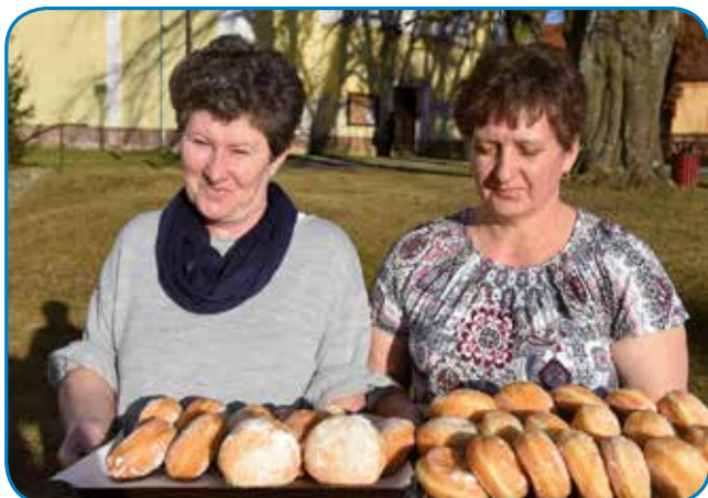
Krofi so »vandrili« v kulturni dom za obiskovalce pustne prireditve

za peko teh pustnic sladlic. Če smo prosili, so nam ženske