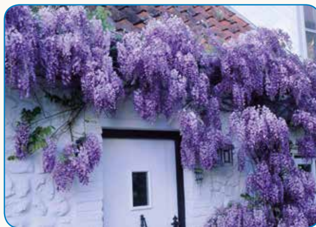
ZAKAJ OBREZUJEMO RASTLINE? stran 6