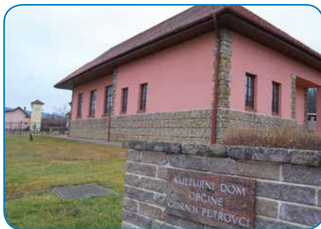
Kulturni dom v Stanjevcaj

lidi, naraudilo pa se jih je samo 450. In s temi malimi penezami, ka jih dobivamo, smo furt mogli dosta napraviti. Ka se nam je tau priši-