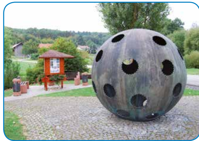
Spominsko obeležje v Ženavljaj, gé je 1934 doj prleto belgijski balon. V spomin na té dogodek vsakšo leto 18. avgusta slavijo občinski svetek.

Čiglij majo probleme s penezi, v petrovski občini vseeno delajo flajnsno naprej. Posodablajo poštij, vrejdgemlejo pa tudi gasilske domove, steri so fontoški za vsakšo vesnico. »V aktualnom mandati bi radi vse gasilske domove vrejdvzeli tak, kak trbej. V Neradnovci in Adrijanci trbej ške neka malo dokončati