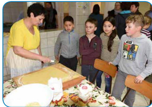
Malo so pomagali tudi otroci števanovske šole