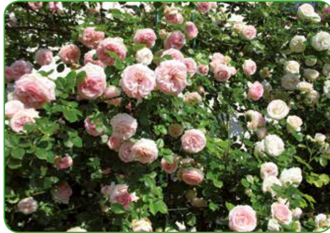
Cvetočo vrtnico plezalko pomlajujemo vsakih pet let, obenem obrežemo še mlade poganjke

ostanejo več let zdrave in bujno cvetoče. Vrtnice obrezujemo vedno na določeno število