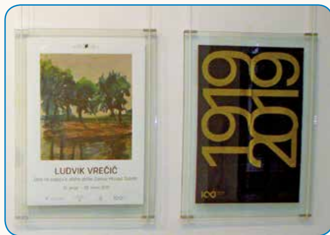
SLIKARJA LUDVIK VREČIČ IN TUGO ŠUŠNIK stran 5