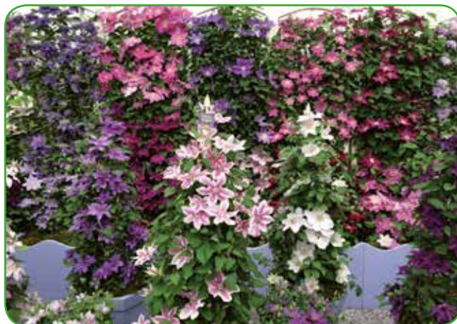
Srobot skoraj obvezno obrezujemo spomladi

očesc. Tako imamo pregled koliko novih poganjkov bo nastalo po rezi. Rez vedno opravimo tik nad popkom, tako da ne puščamo štrcljev. Enkrat cvetoče vrtnice odrežemo takoj po cvetenju, ker