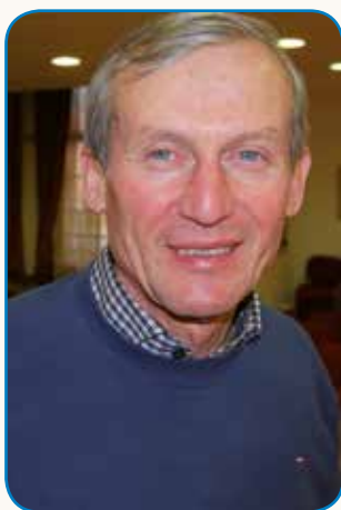
NE SEDI RAD V PISARNI stran 4