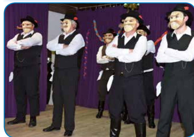
Moški člani FS Podkolanca s Cankove so nastopili v maskah, ki so si jih sami pripravili

lijeni in vsakšoga malo namaže po obrazi s sajami.« S tem se je tudi naš kulturni program končal, prireditev pa