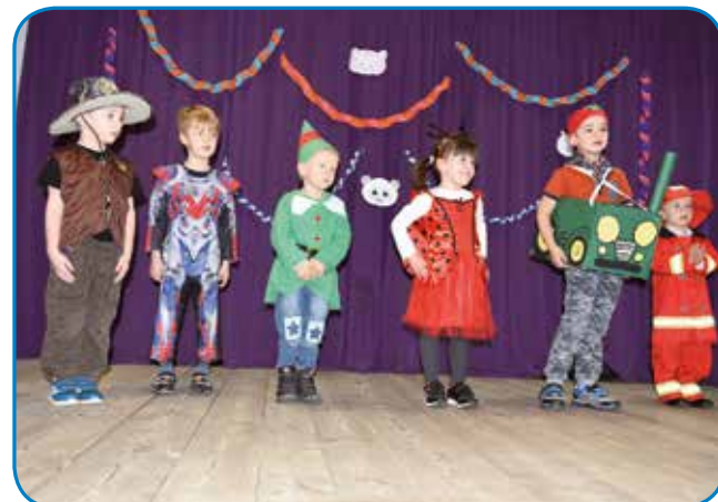
Malčki domačega vrtca so nastopili z dvojezičnim programom

Za uspešno izvedbo programa se lepo zahvaljujemo Sloven-