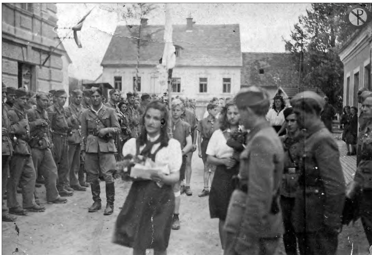
Partizani v osvobojenem Šoštanju (F 5286 (1) in F 5286 (2)).