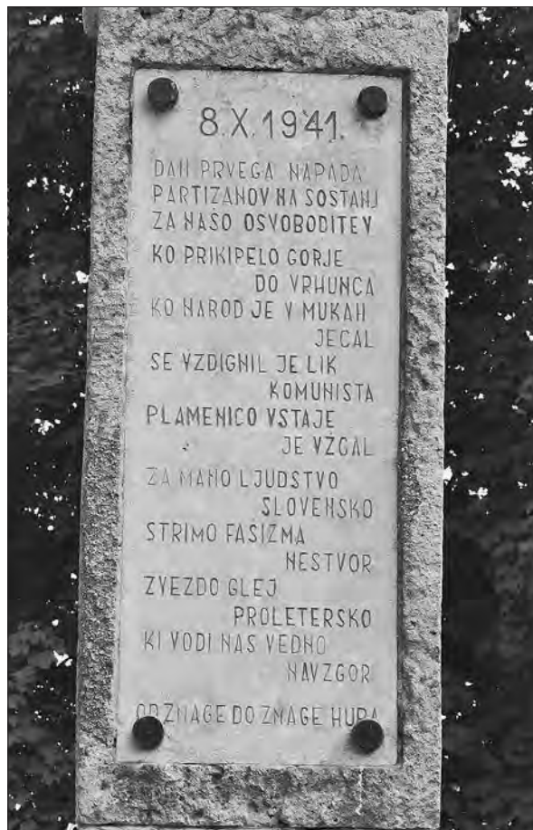
Partizanski napad na Šoštanj leta 1941 obeležuje spomenik ob današnji Kajuhovi cesti.

rekvirirati blago v trgovinah ter napasti okupatorjeve urade in sodelavce. 41