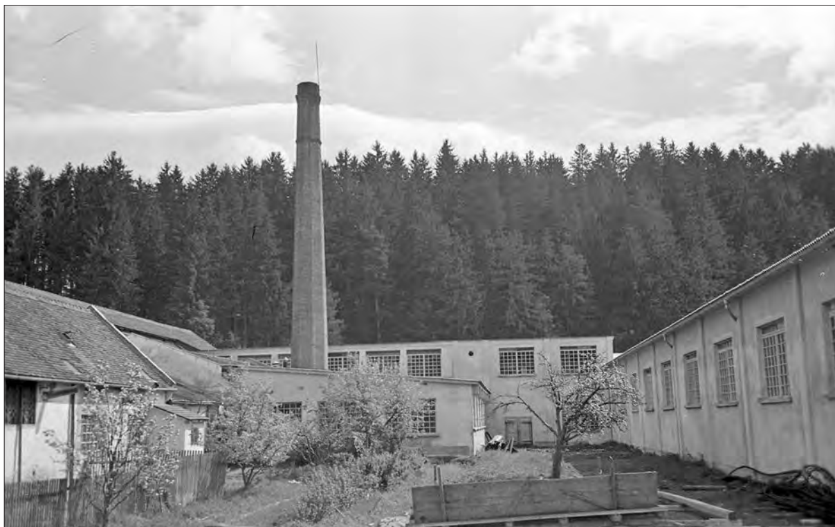
Šoštanjaska tovarna usnja leta 1951.

družine: družinsko posestvo v Ravnah, vilo Široko, posestvo Gutenbüchel-Forchteneg, tri hiše na Dujanju, delnice, gotovino itd. 83