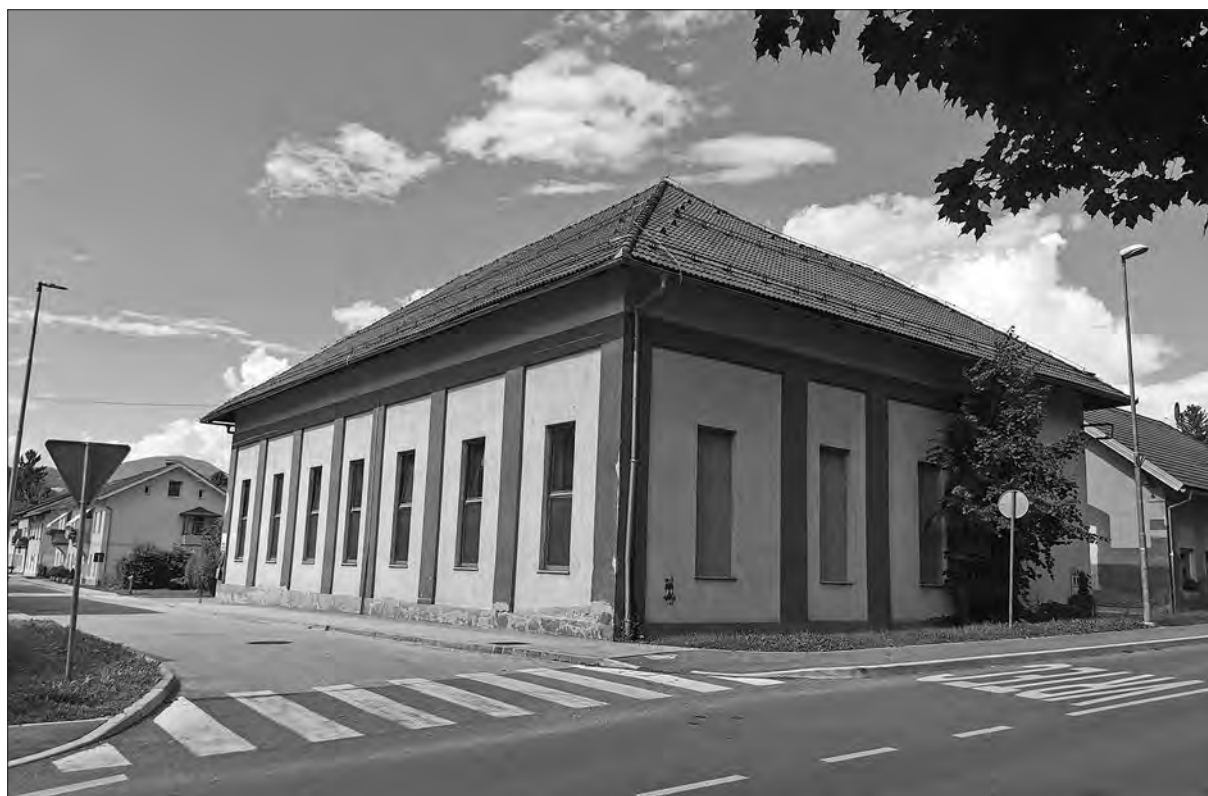
Sokolski dom v Šoštanju (arhiv avtorja).