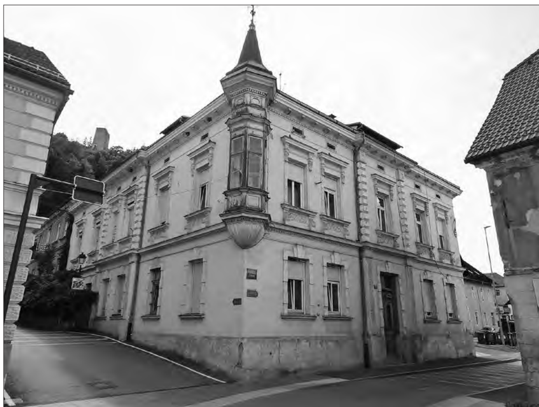
Vila Woschnaggov v Šoštanju (arhiv avtorja).