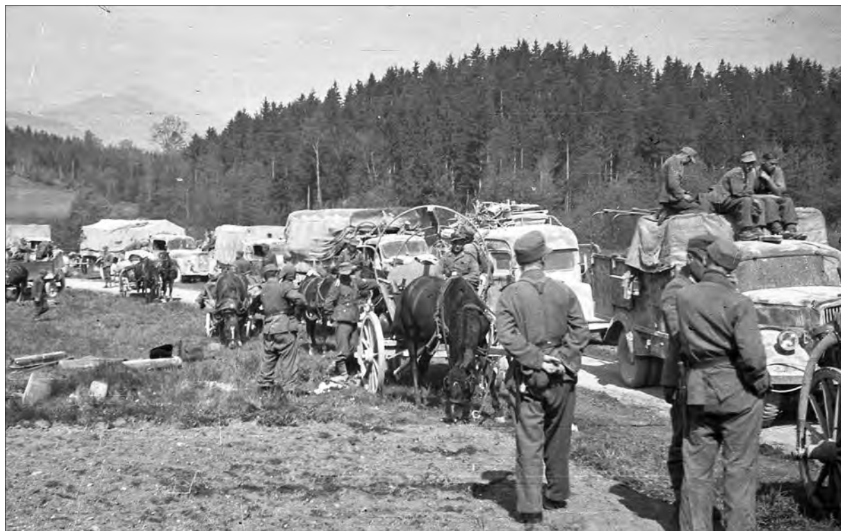
Zaustavljena motorizirana kolona nemške vojske na cesti pri Pohrastnikovi domačiji v Metlečah, 9. maj 1945.