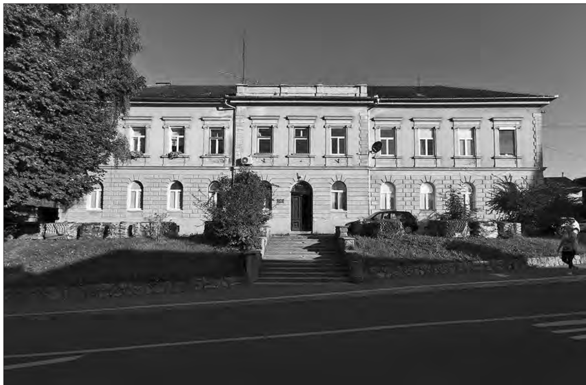
Šoštanjno sodišče