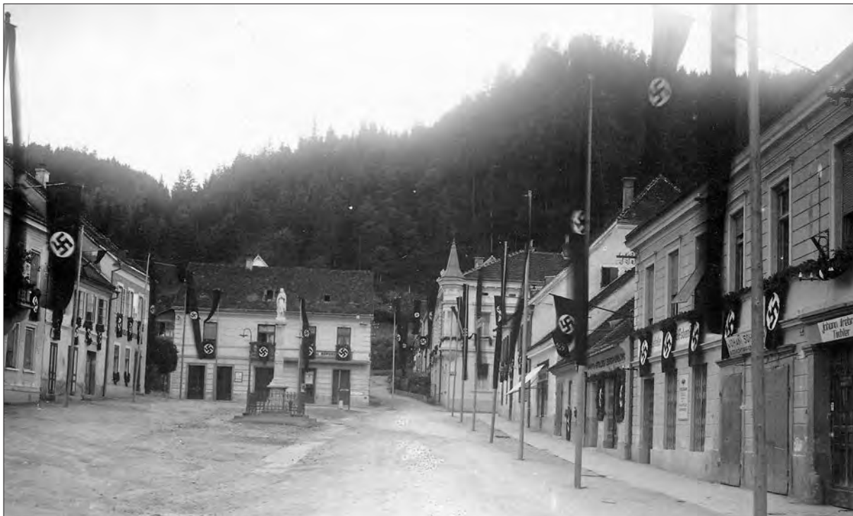
Šoštanj v času nemške okupacije.

žnje reke Pake, zgradili parne turbine in pozneje še termoelektrarno, s presežkom elektrike so oskrbovali tudi bližnje hiše, za potrebe delavcev so zgradili delavsko kolonijo itd. 4