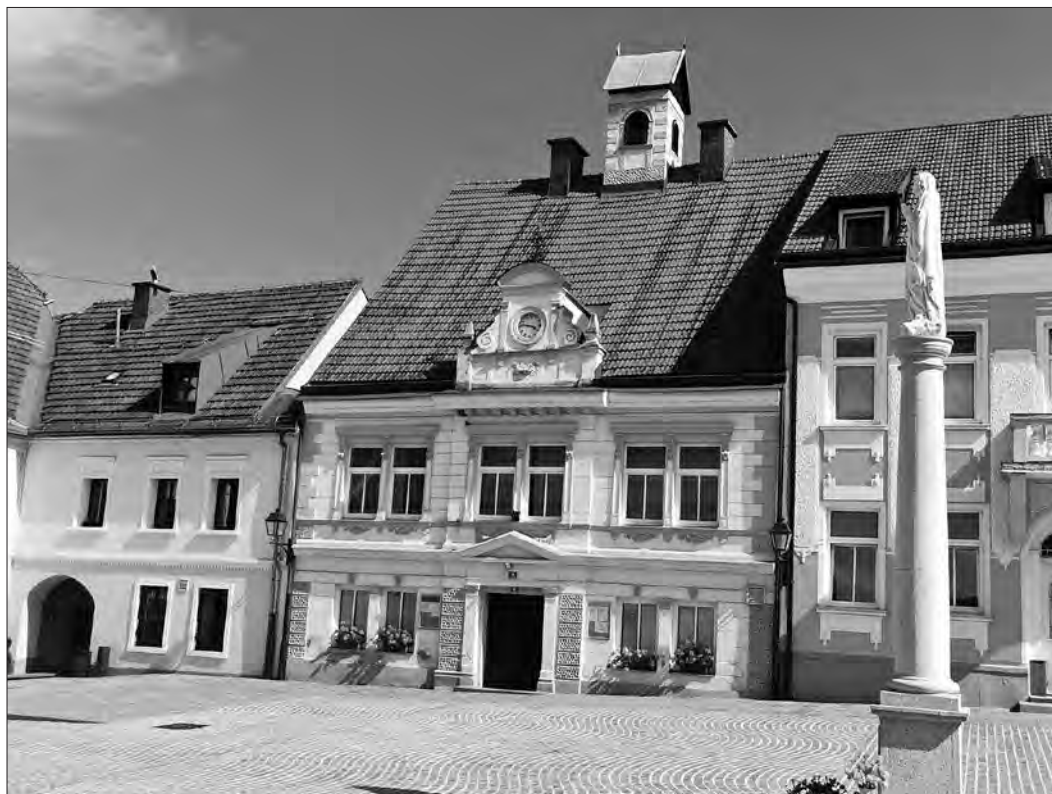
Šoštanjška mestna hiša.