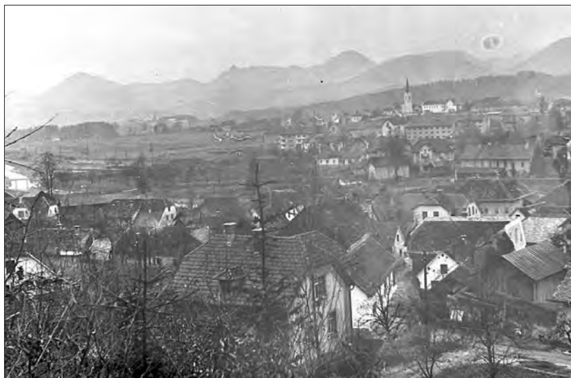
Šoštanj pred drugo svetovno vojno