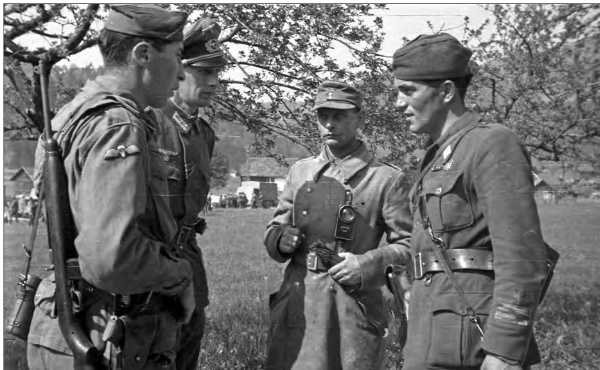
Pogajanja o brezpogojni kapitulaciji z odposlanci nemškega generala Löhra.