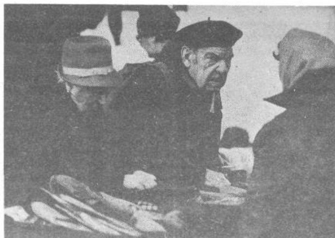
Skrb za ostarele občane beleži viden napredek

Že na podlagi te kratke ugotovitve lahko trdimo, da smo v naši občini kaj kmalu po ustanovitvi skupnosti socialnega varstva našli skupno pot dela in reševanja socialne varnosti delovnega človeka in občana z občinsko skupščino, ki jih moramo reševati skupaj (gradnja doma za ostarele na Bokalah, začetek gradnje doma za ostarele občane v Koleziji in podobno). Želeli bi le, da bi ustvarili še večje sodelovanje s stanovanjsko skupnostjo in skupnostjo za zaposlovanje (rehabilitacija in zaposlovanje invalidnih oseb, zaposlovanje zdomevc in podobno). Takšno trdno sodelovanje moramo vsekakor doseči, kar nam bo omogočal tudi novi zakon o skupnostih socialnega varstva, ki se pripravlja in ki bo jasno in dosledno izpeljal njeno funkcijo kot mesto za usklajevanje socialno varstvenih pravic v programih samoupravnih interesnih skupno-