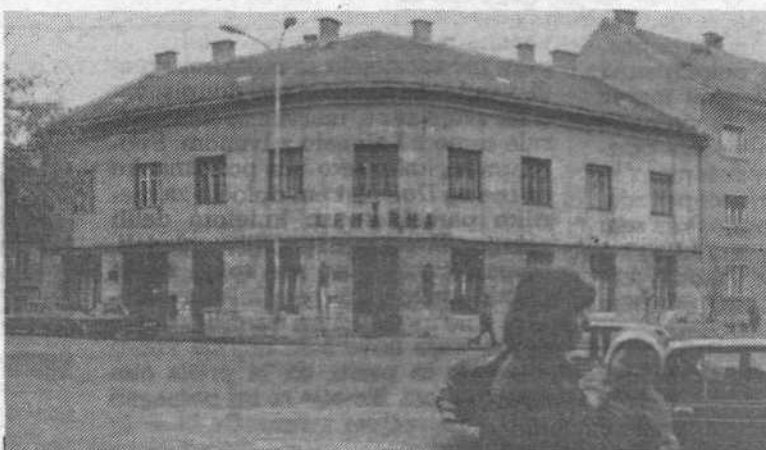
Postopje, v katerem je poleg lekarne tudi tako imenovana ambulanta Mirje, o kateri je bilo v zadnjem času veliko govora. V zadnji številki Dogovorov smo poročali, da ambulante ne bodo ukinitili in da je sklep občinske zdravstvene skupnosti o tem dokončen. Tako kot Mirje, bo ostala tudi ambulanta Prule.