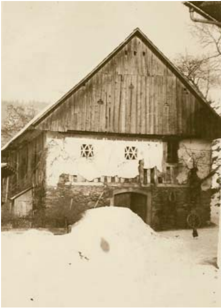
Gospodarsko poslopje pri Mlinarju v Logu nad Škofjo Loko, št. 4 pred drugo svetovno vojno.