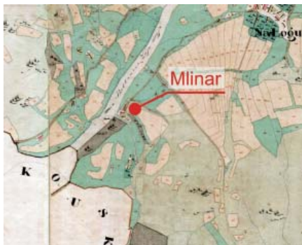
Mlinar v Logu nad Škofjo Loko, št. 4, kjer se Sovpat izliva v Poljanščico. Sedaj Log nad Škofjo Loko, št. 9 in priimek Stanonik.