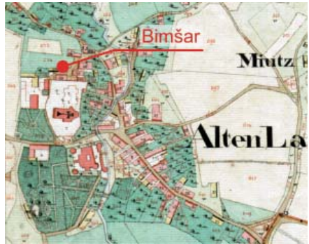
Binšarjeva kajža v Stari Loki, št. 49, tik ob mežnariji za farno cerkvijo sv. Jurija. Sedaj Stara Loka 64, kjer ima starološka župnija večnamensko Jurjevo dvorano.