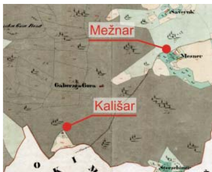
Mežnar na Gabrški Gori, št. 10 in kajža Na Kališ, št. 9, levo pod cerkvijo sv. Primoža in Felicijana. Kajža je že podrta, pri Mežnarju pa je sedaj Gabrška Gora, št. 7 in priimek Dolenc.