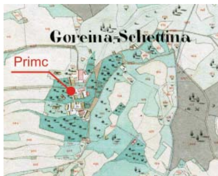
Primcova domačija sredi vasi v Gorenji Žetini, št. 9. Hiša je bila med 2. svetovno vojno požgana, sedaj Gorenja Žetina, št. 10, priimek Peternelj.