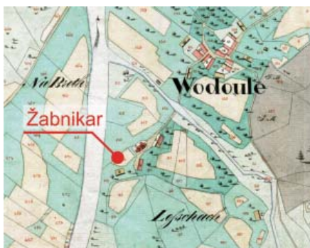
Žabnikarjeva kajža v Bodovljah, št. 7, tik ob Poljanščici, blizu cerkve sv. Petra. Koča je bila podrta in je sedaj ni več.