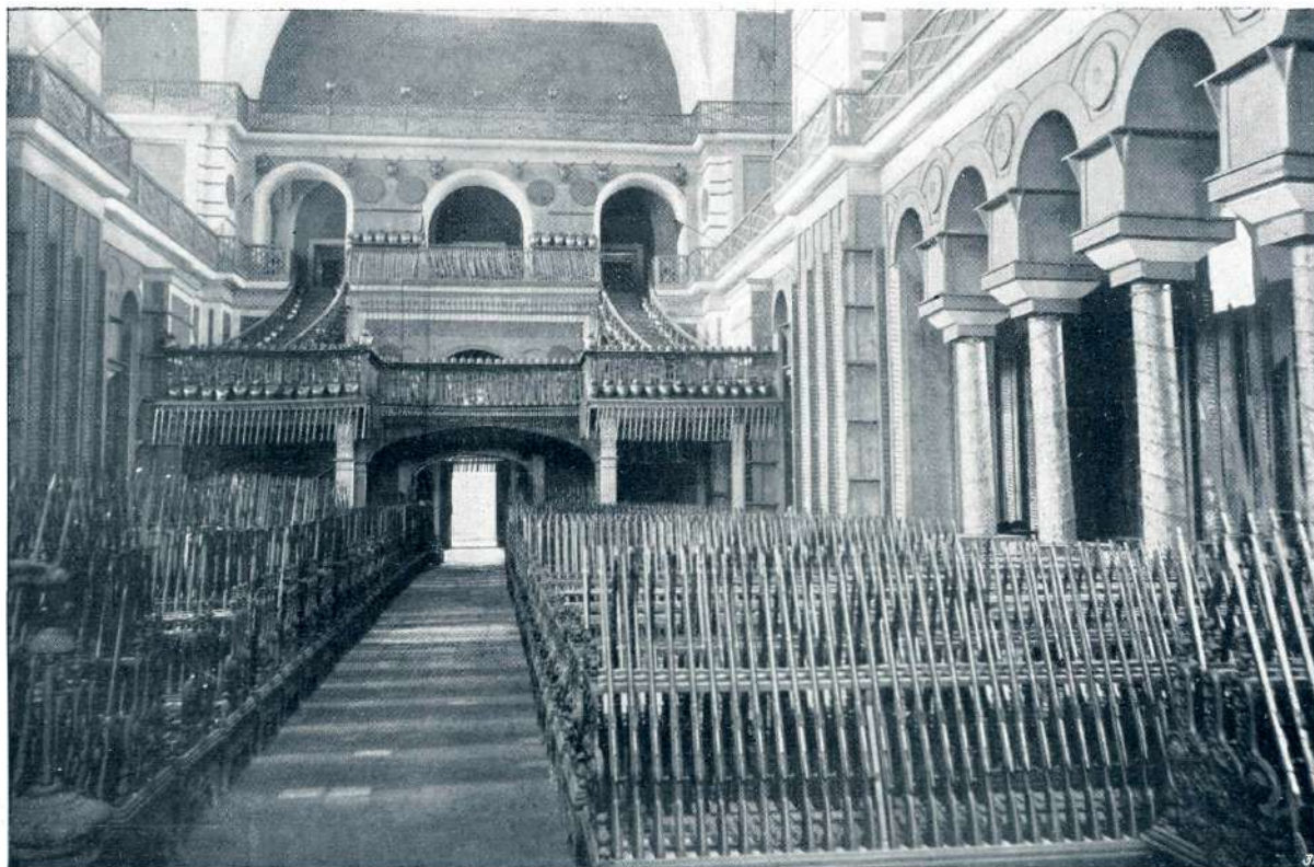
CERKEV SV. IRENE V CARIGRADU, IZPREMENJENA V SKLADIŠČE ZA OROŽJE.