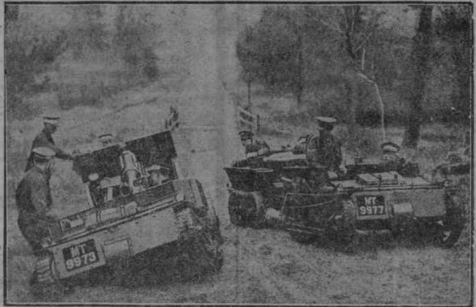
Angleška motorna artilerija na vajah.

tatvin in vlovov mu je prisodilo varaždinsko sodišče, ne da bi ga bilo imelo, 8 let težke ječe. Na isti način kakor v Varaždinu je bil obsojen v Mariboru radi poskusa uboja pri Ptujju na 6 let ječe. Vkljenjenega so odvedli iz Murskega Središča v Varaždin in od tamkaj ga bodo spravili v Maribor.