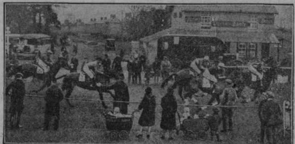
Kenjska dirka skozi mesto je običaj v angleškem mestu Chelmsford.