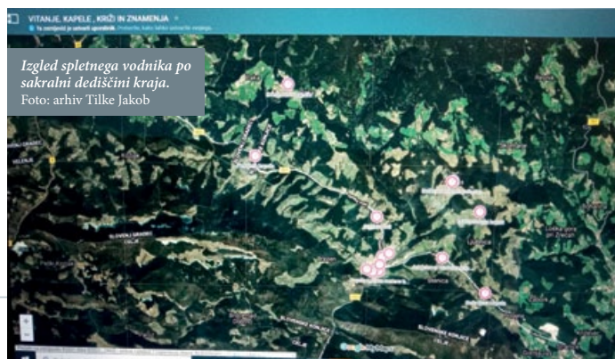
Izglede spletnega vodnika po sakralni dediščini kraja.

Obiskovalcem občine Vitanje (ene manjših slovenskih občin, ki šteje okrog 2350 prebivalcev in meri približno 6500 ha) pa želim, da bi si te naše znamenitosti ogledali, v pomoč pa naj jim bodo naši zapisi na spletni strani šole. ◀