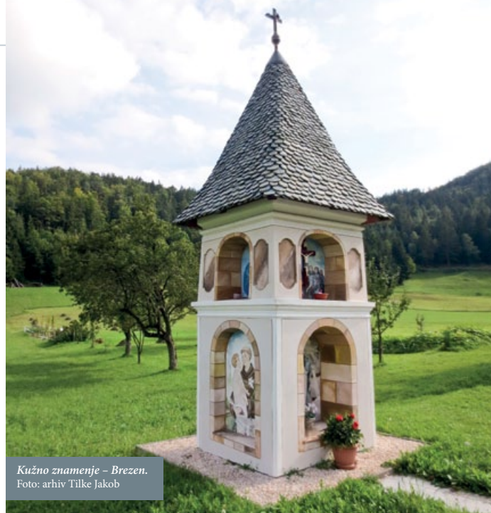
Kružno znamenje – Brezen.