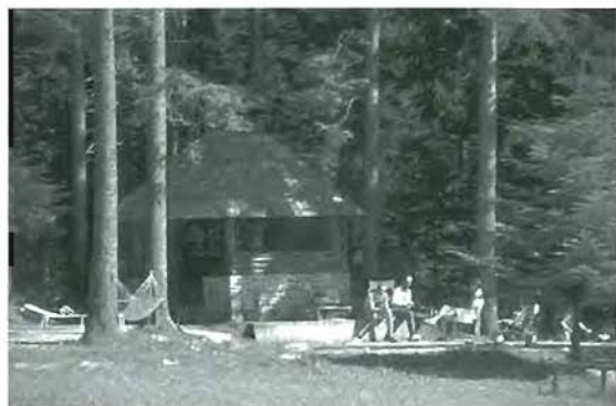
Prostor za piknik v Krnici

KOZOROG, E., 1998: Skozi Trnovski gozd.- Gozdovi v Posočju 2, Branko, d. o. o., Nova Gorica.