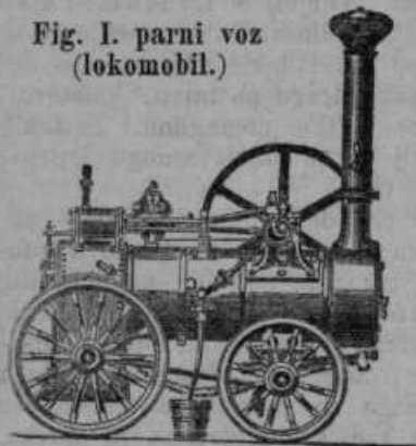
Fig. I. parni voz (lokomobil.)