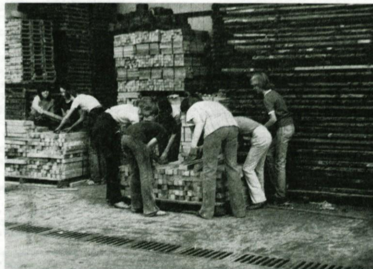
Delo na KLI

Prav v dneh prazničnega tedna, ko so se vrstile različne manifestacije v občini Logatec, so v krajevni skupnosti Tabor zabeležili poseben dogodek. V goste so prišli predstavniki celodnevne osnovne šole iz Bizeljskega, ki enako kot logaška nosi ime po Edvardu Kardelju. Prav na obletnico poimenovanja logaške šole 9. 9. 1980 so podpisali listino o pobratenu.