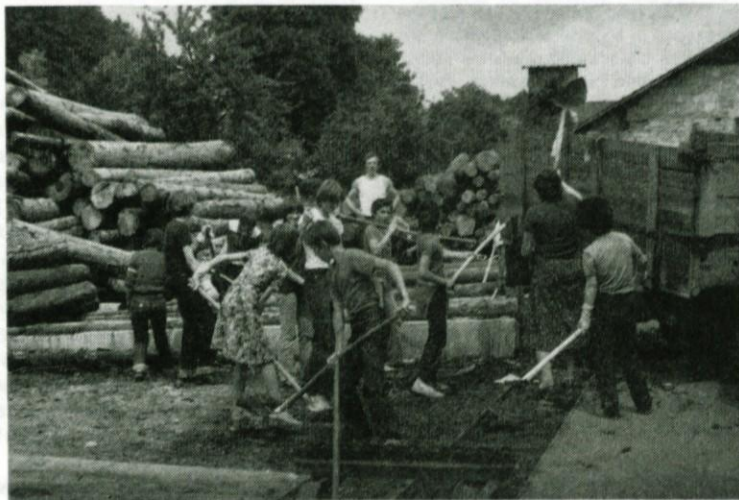
Delo v KZ