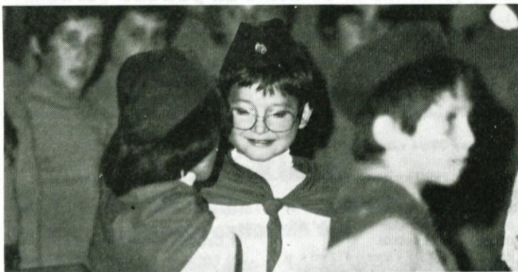
Pobratenje je bilo prisrčno

Prav v dneh prazničnega tedna, ko so se vrstile različne manifestacije v občini Logatec, so v krajevni skupnosti Tabor zabeležili poseben dogodek. V goste so prišli predstavniki celodnevne osnovne šole iz Bizeljskega, ki enako kot logaška nosi ime po Edvardu Kardelju. Prav na obletnico poimenovanja logaške šole 9. 9. 1980 so podpisali listino o pobratenu.