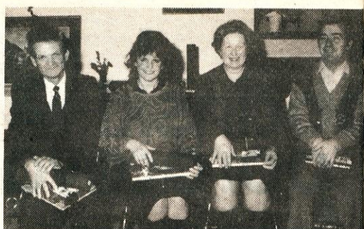
Delavci z najdaljšim delovnim stažem v domžalski geodetski upravi

Geodetska uprava Domžale je v strokovno in kulturno zakladno jubilej geodetske službe doprinesla pomemben delež: kot napredna občinska geodetska uprava, v vedno velikim posluhom vodstva občine, je orala ledino in utrla pot mnogim evencim geodetske službe. Veliko pomembnih testov za nadaljnji razvoj geodetske službe je bilo uspešno izvedenih prav na območju občine Domžale.