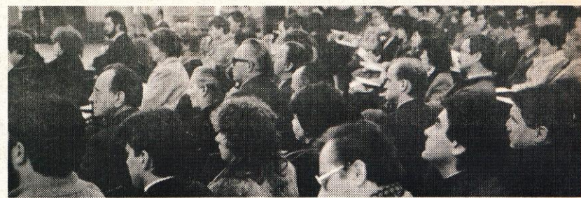
Ob sklepu leta so se na svečani seji sestali delegati vseh treh zborov domžalske delegatske skupščine.

Še naprej vzpodbujati razvoj drobnega gospodarstva... Razvoj drobnega gospodarstva, tako v družbenem kot v privatnem sektorju, smo uvrstili med prioritete panoge. V družbenem sektorju bo poudarek dan na kooperacijsko proizvodnjo, v privatnem sektorju pa se bo nadaljevala selektivna politika, ki bo stimulirala vlaganje v razširitev in posodobitev proizvodnih dejavnosti oz. omogočala nadaljnji razvoj nizko akumulativnih in deficitarnih obrti. Podpirali bomo