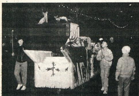
Prvo priznanje v letošnjem letu ZLATI SLAMNIK namenimo turističnemu društvu Domžale in vsem prizadevnim amaterskim delavcem v njem za organizacijo in izvedbo novoletnih sprevodov, sejma in prireditev v hali Domžale.