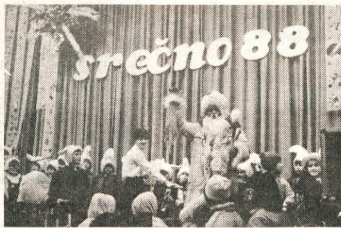
Srečno 1988 je zatele mladim in starejšim Domžalčanom v hali Komunalnega centra letošnji dedek Mraz. Sicer je letos govoril nekoliko bolj pikro, ampak veselja in prednovoletnega vzdušja tudi ni ugasnil, saj so k vzdušju pripomogle številne stojnice pred halo z omamno dišečimi tekočimi dobrotami...

lovalec delov obtuve, preoblikovalec in spajalec kovin, oblikovalec kovin, strojni mehanik, monter upr. energ. naprav, gradbenec II, papirničar, kemijski procesničar-moški, avtomobilski dimnikar, prodajalec, natakar, obutveni tehnik, papirniški tehnik, ing. strojništva, ing. papir. tehnologija, ekonomist, predm. učitelj za mat. naravosl. pred., glasbeni učitelj, dipl. ing. strojništva, dipl. ing. kemijske tehnologije, dipl. ing. papir. tehnologije, dipl. ekonomist. SEZNAM SUFICITARNIH POKLICEV V OBČINI DOMŽALE ZA LETO 1987/88 Elektronik, aranžerski tehnik, industrijski oblikovalec, fotograf, zobotehnik, gradbeni tehnik, socialni delavec, prof. slovenskega jezika, prof. angleškega jezika, prof. primerjalne književnosti, prof. filozofije, prof. zgodovine, dipl. politolog, dipl. ing. arhitekture, dipl. psiholog, dipl. pedagog, dipl. sociolog, dipl. veterinar Deficitarnih in suficitarnih poklicev v občini je več, kot jih je tu navedenih, vendar je suficit ali deficit teh poklicev tako majhen, da je zanemarljiv ali pa sploh ni dejavnosti v občini, ki bi zahtevala določeno potrebo, npr. plovni tehnik. M. B.