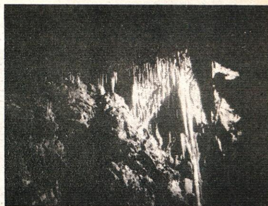
Nenavadna najdba ob gradnji: