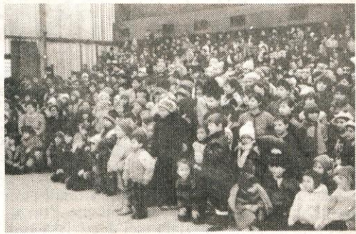
Mlado in staro je dvakrat napolnilo domžalsko halo; veselo in sproščeno je bilo vzdušje prednovoletnih dni.

Ali je res samo v interesu dveh, treh posameznikov kot se zdi, da tako prireditve v Domžalah imamo, ali je treba prenašati iz leta v leto neko