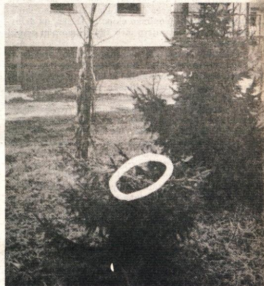
...če se ne bi čez cesto zgodilo drugemu občanu prav isto. Neznani zlikovci so si polepšali novoletno vzdušje s smrekicama. Srečno novo leto, neznani storilec, saj si ga lepo začel: S TATVINO!