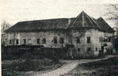
Grajo GORJAČA ROKOVNJAČA namenjamo upravljalcem in stanovalcem gradu Jablje v Trzinu oz. Loki pri Mengšu za sramotno ravnanje pri ohranjanju tega spomeniško zaščitene objekta.