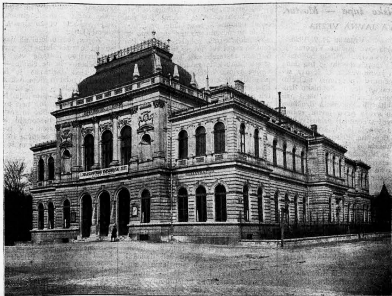
Narodni dom u Ljubljani.

Sa proslave pedesetogodišnjice oslobođenja Bara i Ulcinja, a iz star