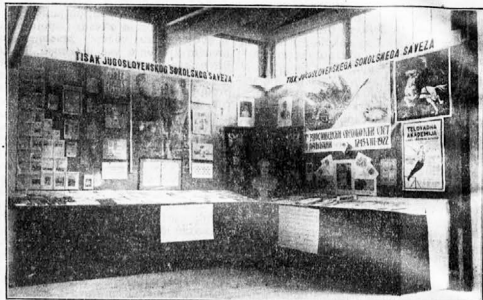
Tisak Jugoslovenskog Sokolskog Saveza na izložbi.

Sav ostali materijal, koji nije dobio više mesta na izložbi, spremljen je, pa će 1930. god. prilikom velike novinarske i grafičke izložbe u Ljubljani biti upotrebljen. Onda ćemo dobiti sami čitav paviljon.