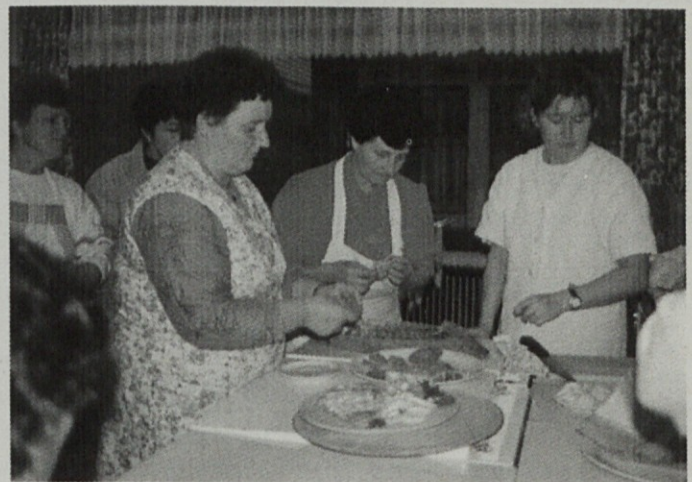
Estetsko oblikovani narezki so vzbujali tek že s samim videzom.