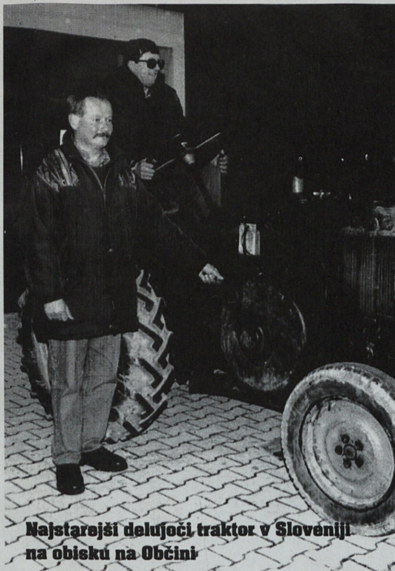
Najstarejši delujoči traktor v Sloveniji na obisku na Obcini

OBČINSKA OBLAST POD DROBNOGLEDOM OPOZICIJE