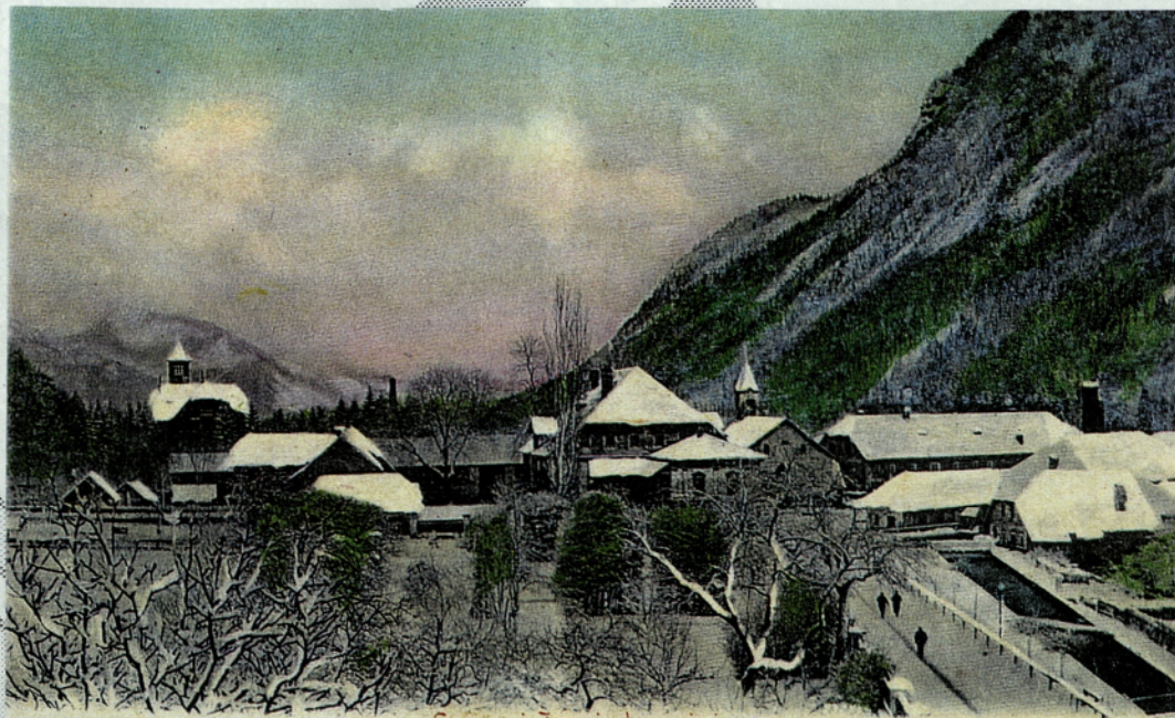
Sava pri Jesenicah pozimi

Muzej Jesenice je ponatisnil barvno razglednico STARE SAVE leta 1902. Člani MDJ jo lahko po znižani ceni 50 tolarjev kupijo v muzeju (cena je sicer 70 tolarjev!)