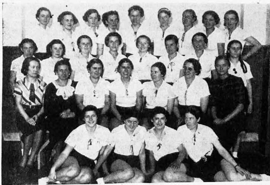
Tečaj Saveza SKJ za vodnice ž. naraštaja, održan u Beogradu od 18—26 marta o. g.