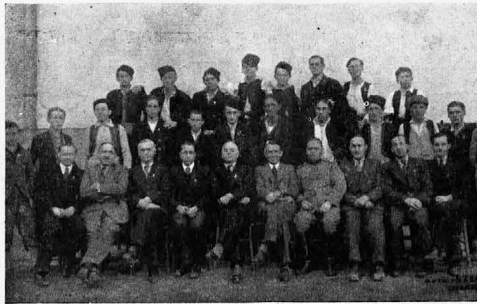
Predavači i učesnici opšteg tečaja za vodnike sokolskih četa Sokolske župe Sarajevo, održanog od 6—20 marta o. g.