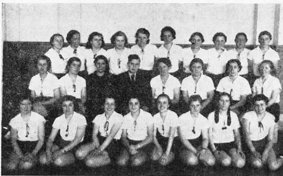
Tečaj Saveza SKJ za vodnice dece, održan u Beogradu od 7—16 marta o. g.

ipak ne iskorišćuje u ovoj meri koliko bi trebalo i koliko zaslužuje. Iz tih razloga mi i pristupamo organizaciji velosipedskih otseka i nadamo se da ćemo u tome radu imati velikog uspeha. U ostalom, vreme i naš rad pokazaće da imamo pravo.