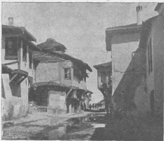
Ulica v Plovdivu

Polagoma je žerjavica očrnela. Tema se je pritihotapila nad spečimi in sanjajočimi.