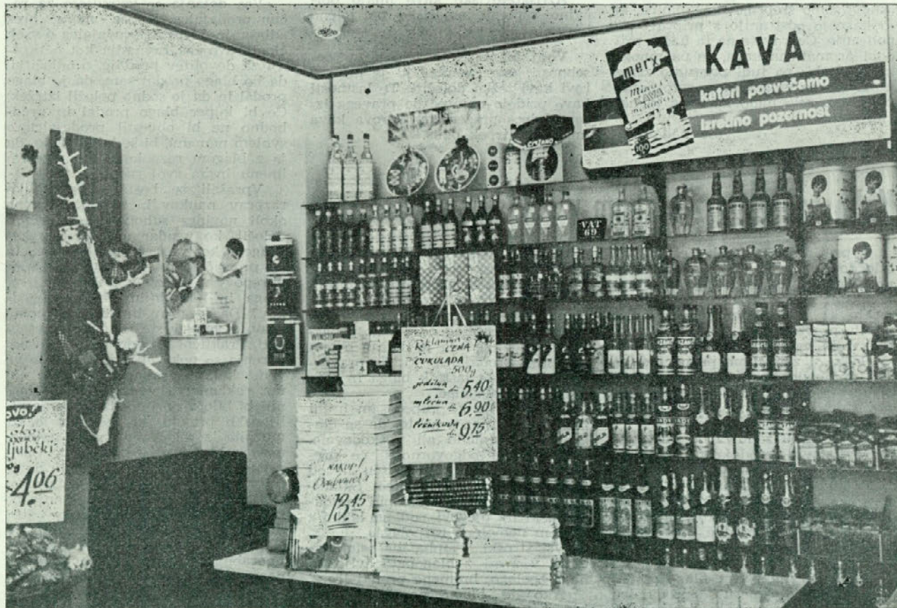
V »Bonbonieri« dobimo dišečo »MERX« kavo izpod mlina

drugo proti drugemu po ploščati strani. Vsako zrno je zase ovito s po dvema lupinama, od katerih je zunanja žilava in debelejša, ni pa čvrsto prirasla ob seme in jo je lahko odstraniti. Notranja je tanka in srebrnkasta ter tesno prirasla ob zrno in jo je težko od njega ločiti. Pri nekaterih kavah sta obe semeni zrasli v eno samo in ima tako zrno okroglasto valjasto obliko. To je takozvana kava »Biser« ali »Perl«, ki jo pogrešno imenujemo tudi »Moka«. Te kave ni mogoče šteti kot posebno vrsto kave, kakor nekateri to pomotoma trdijo.