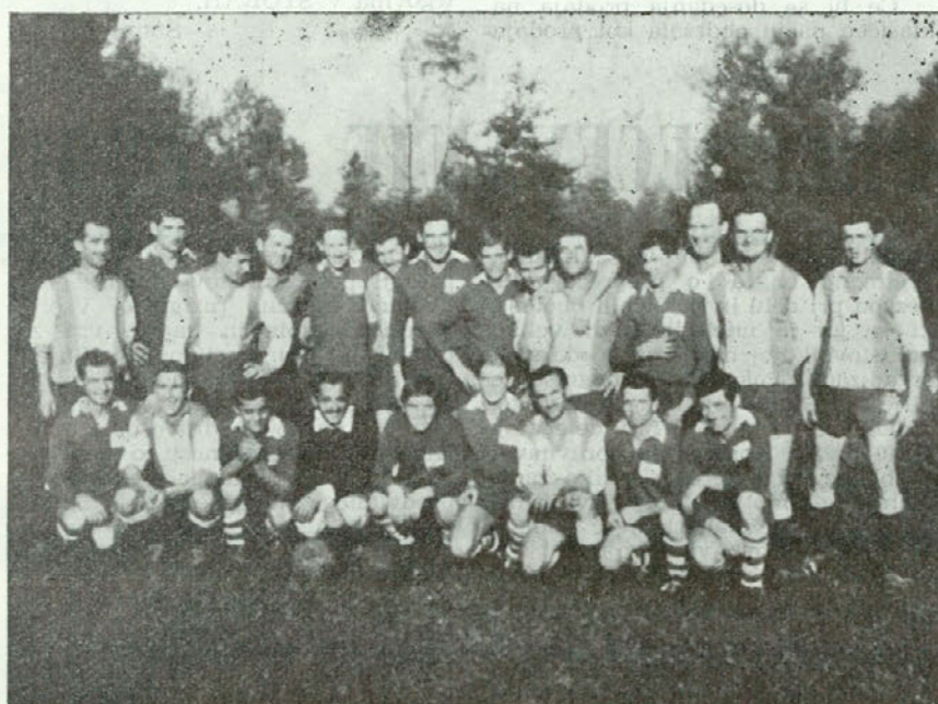
»Vir« Domžale : »Merx« Celje, 3 : 4