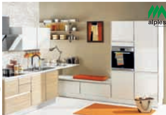
Akcija velja do konca marca.

Kranjska cesta 3a, Kamnik T: 01 831 04 81 | 051 399 577 www.pohistvo-dabor.si