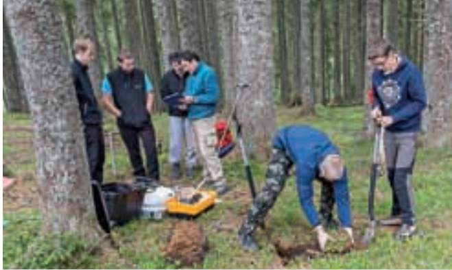
Poletna šola - Recharge.green

Organizacijo letošnjega jubilejnega 10. srečanja YPAC-a je prevzela Gimnazija in srednja šola Rudolfa Maistra Kamnik v sodelovanju z Občino Kamnik, Ministrstvom za okolje in prostor, ki koordinira izvajanje Alpske konvencije v Sloveniji, in Stalnim sekretariatom Alpske konvencije Innsbruck, organizacijo CIPRA in projektom recharge.green. Vsem iskrena hvala v imenu šole in vseh mladih Evrope.