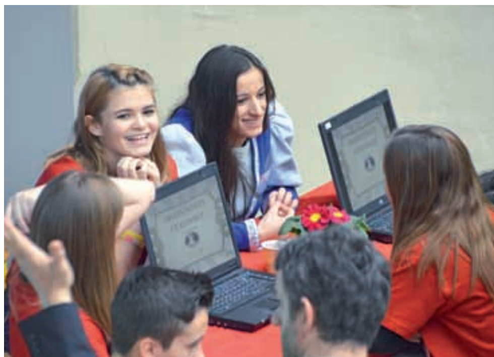
Na voljo je več izbirnih modulov: podjetništvo – turizem in bančništvo; novost, ki jo pripravljamo za jesen 2015, pa je modul menedžment v športu

Nudimo več izbirnih modulov: podjetništvo – turizem in bančništvo, novost, ki jo pripravljamo za jesen 2015, pa je modul menedžment v športu. S širjenjem športa in z razvojem športne dejavnosti se vse bolj pojavlja potreba po njegovi urejenosti in strokovnem vodenju. Šport ni več samo zabava in užitek, je tudi velik posel, ki zahteva kadre, ki združujejo športna in tudi poslovna znanja. Menedžer mora biti dober vodja z organizacijskimi in komunikacijskimi sposobnostmi, za svoje delo mora imeti znanja s področja ekonomije in poslovanja, prava in menedžmenta. Ker ugotovljamo, da je področje menedžmenta v športu v Sloveniji kadrovsko podhranjeno, ga vključujemo v program ekonomski tehnik v okviru t. i. odprtega kurikula. Strokovno vodenje športa je zagotovo področje, ki daje možnosti za zaposlovanje.