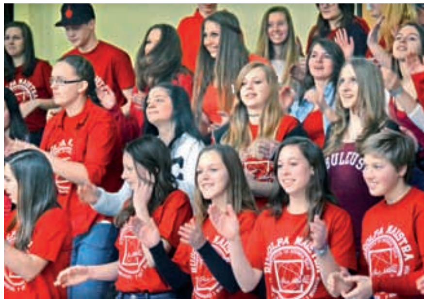
Letos bo že tretja generacija svoje izkušnje pridobivala z delom v angleškem Leedsu ter avstrijskem Celovcu

Program predšolska vzgoja je dinamično potovanje skozi pesem, igro, barvo in besedo. Združuje veselje do učenja, ustvarjanja in vzgajanja. V šoli pridobljeno teoretično znanje dijakinje, pa tudi vedno več dijakov, praktično povezujejo z delom z najmlajšimi. Poleg obveznega usposabljanja v vrtcih pogosto gostujemo pri hvaležni otroški publikli z uprizorjanjem avtorskih igrin in s prirejanjem tematskih delavnic. Posebnost dijakov naše šole je, da malčke na svojih nastopih v vrtcih učijo tudi znakovnega sporazumevanja. Pri tem je največja zvezda navihan pomočnik – Mihec.