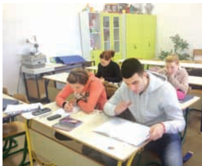
Pouk se izvaja v majhnih skupinah, dostopni učitelji prilagajajo pouk in termine izpitov potrebam posameznikov in skupin, na voljo je literatura v klasični in elektronski obliki

Program vsako leto obiskuje okoli 200 udeležencev.