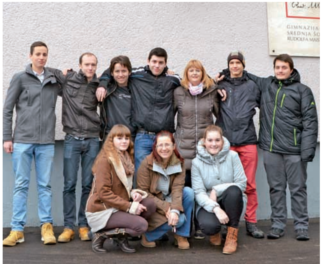
Letošnja YPAC ekipa GSŠRM na srečanju, ki bo potekalo med 16. in 20. marcem. Tema so ekosistemske storitve v času podnebnih sprememb.

Vsakoletno vprašanje YPAC-a je, kako in na kakšen način sprejete postulate predstaviti vplivnim politikom in navsezadnje – doseči resnične in opazne spremembe. Da bi bili pri tem uspešnejši, so v času sestajanja organizirana predavanja strokovnjakov za omenjena področja kot tudi pogovori s pravimi predstavniki lokalnih in državnih politik, ki dijake usmerjajo in jim pomagajo pri razumevanju globljih političnih premikov. Pogosto se namreč pripeti, da so predlagani ukrepi mladih preveč idealistični in jih je nemogoče uresničiti ali pa v resnici sploh niso dovolj inovativni – prav zato je vsak pogovor s strokovnjakom in/ali politikom dobrodošel in še kako dragocen. Seveda ne gre pozabiti, da je vsak poskus mladih obenem tudi pomembna odskočna deska ambicioznejšim učencem v smeri uresničevanja lastnih zamisli.