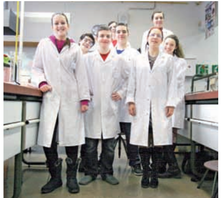
Bodoči dijaki lahko izbirajo med tremi različnimi usmeritvami: naravoslovno, jezikoslovno in družboslovno smerjo

Dijaki v svojem štiriletnem življenju pri nas izrazijo svoja močnejša področja, mi pa jim pri tem pomagamo, da jih še globlje razvijajo. Tri različne usmeritve – naravoslovna, jezikoslovna in družboslovna – pripomorejo, da dijaki pridobijo poglobljena znanja z določenih interesnih področij. Z medpredmetnimi povezavami, sodelovanjem v projektih in izmenjavah, raziskavah ter s taborom za nadarjene dijake pa nasitimo tudi tiste še bolj lačne znanja. Mimogrede, na naši šoli se tudi dobro je; saj poznate tisti pregovor, ki pravi, da prazen želodec ne študira rad.