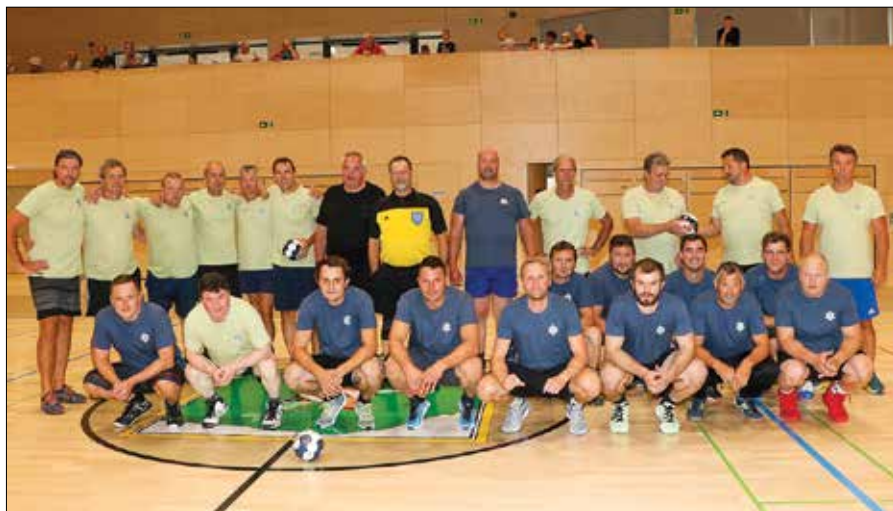
Fotografija za spomin: Stari proti Mladim leta 2022.