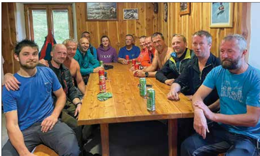
Nosači med počitkom po opravljeni preizkušnji