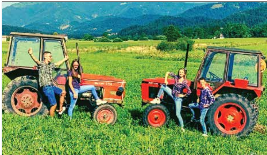
Kočnarjevi otroci so posneli zabaven video, ki je v samo nekaj dneh na Facebooku dosegel preko 12.000 ogledov.