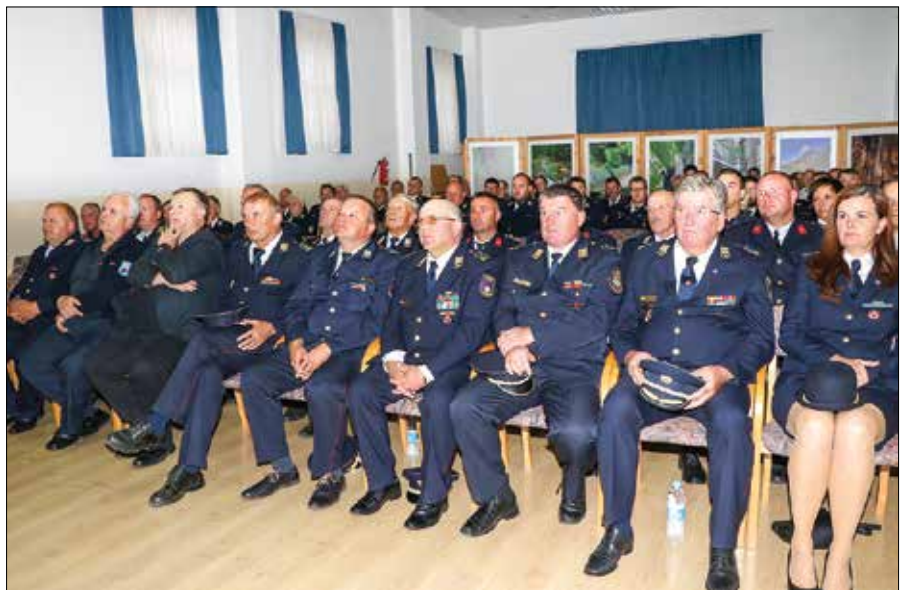
Slovesnosti so se poleg članov društva udeležili številni ugledni gostje.