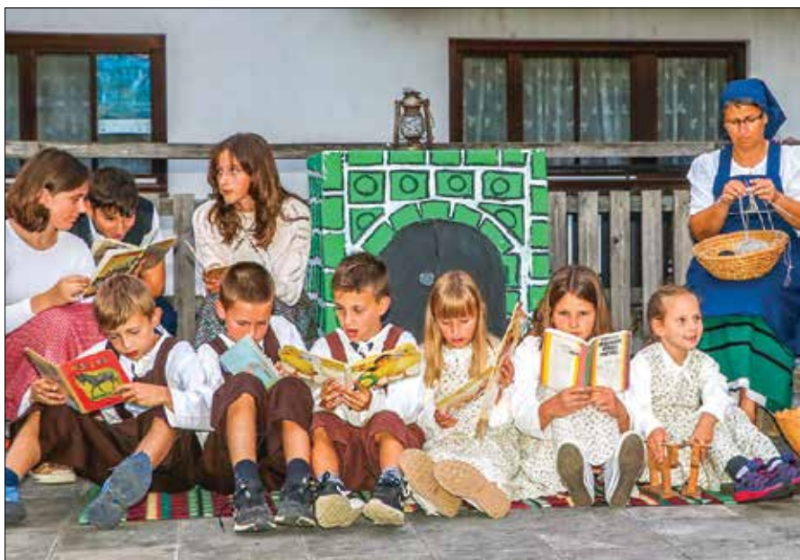
Otroci so se stiskali ob peči in si krajšali večer z branjem in poslušanjem pripovedk.

Podobo zimskega večera v preteklosti so obogatili ljudski pevci s petjem na »treko ali štrto«. Zapele so tudi žene, otroci pa so dodali družabno igro Gnilo jajce in ples Mat so rekli žakle šivat. Obiskovalci so lahko prisluhnili tudi harmonikarjema in citrarki.