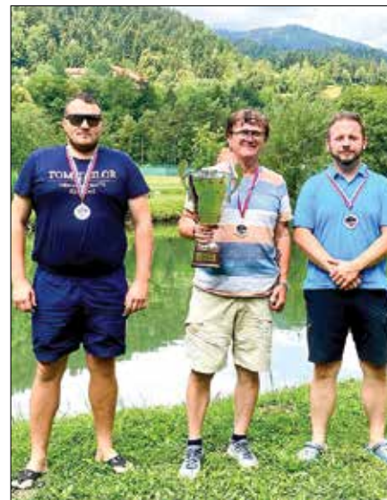
Najboljši trije v metanju umetne muhe v daljavo