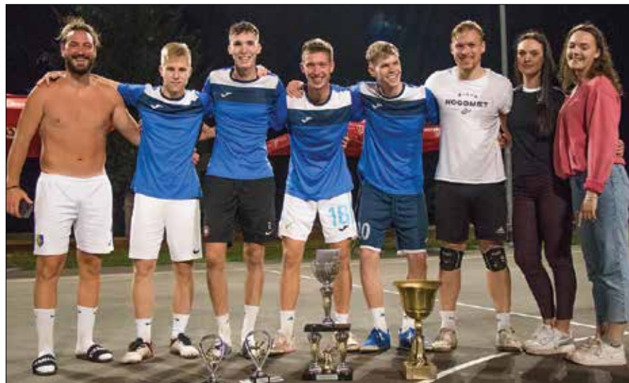
Zmagovalna ekipa Ovi Bar 46 iz Grosuplje