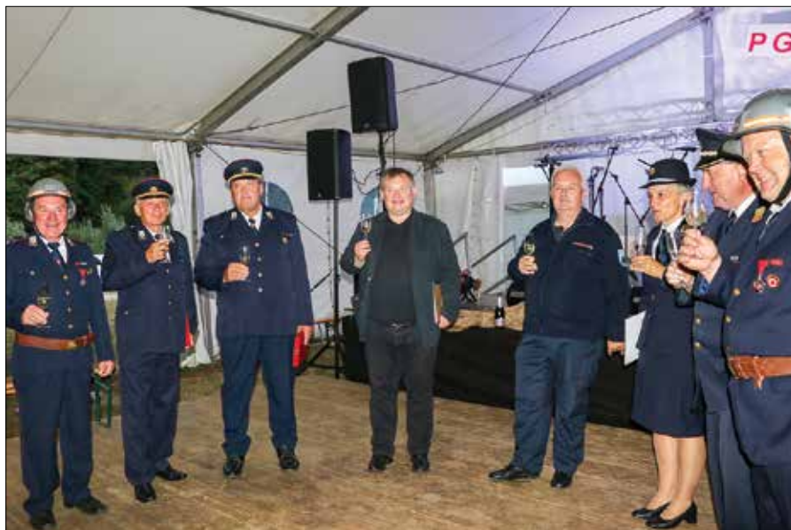
Zdravica ob tudi uradno zaključenem projektu posodobitve voznega parka PGD Luče.

RIBIŠKO TEKMOVANJE NA LJUBNEM OB SAVINJI