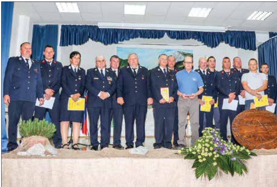
Šestnajst posameznikov je ob obletnici prejelo priznanja društva in Gasilske zveze Zgornje Savinjske doline.