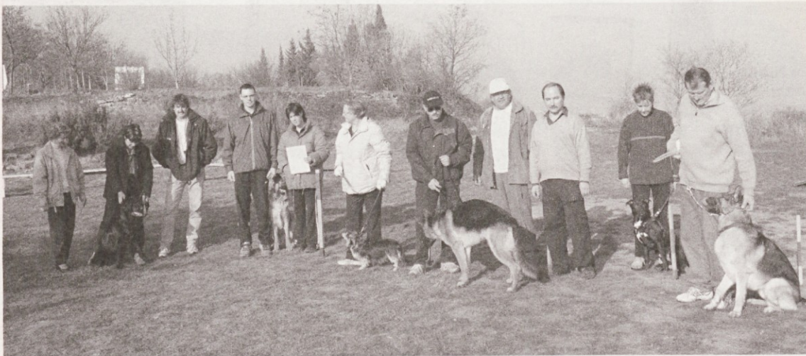
Na fotografiji Primorskega utripa: Člani društva s svojimi štirinožnimi prijatelji.

Člani kinološkega društva Portorož so decembra na Parkurju v Lucanu preizkusili osnove znanja svojih štirinožnih ljubljencev. Opravili so tečaj iz osnov poslušnosti in prejeli tudi potrdila. Vaje je opravilo 15 psov in prav zanimivo jih je bilo opazovati kako se z lahkoto podijo čez postavljene ovire. Zaključek 1. tečaja je bil uspešen, kar je tudi dobra osnova za uspešne priprave na letošnje evropsko prvenstvo v tekmovalni praksi, ki bo 17. julija v Portorožu, predvidoma na istem mestu kot lani (ob teniških igriščih Marine Portorož).