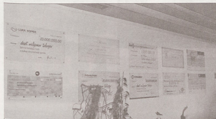
Na steni hodnika v Splošni bolnišnici Izola visi že 11 donatorskih čekov