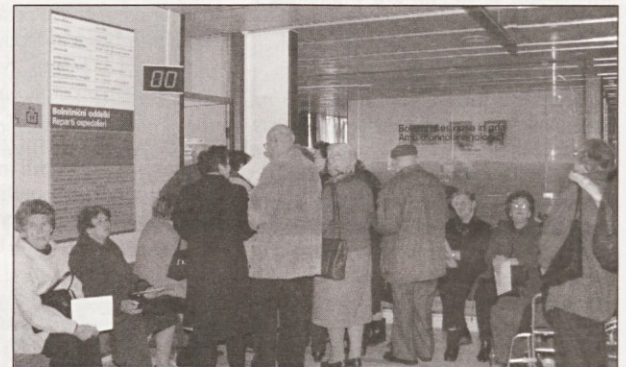
Vrste pred antikoagulantno ambulanto v Splošni bolnišnici Izola