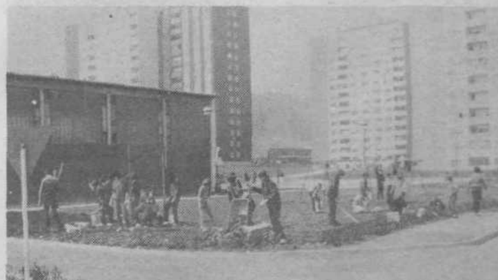
Kopali smo zemljo in jo grabili, jo odvažali, pobirali kamenje, polnili samokolnice...