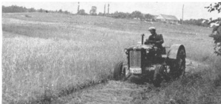
Tudi v lenarški občini je žetev v polnem teku. Nekoliko sicer moti slabo vreme. Letos je zlasti dobro obrodila italijanka.

Kmetijska zadruga je dolžna dosledno izvajati akcijski program za katerega je potrebno, da si pravočasno oskrbi vsa potrebna sredstva zlasti tedaj, ko stoji mo pred jesensko setvijo.