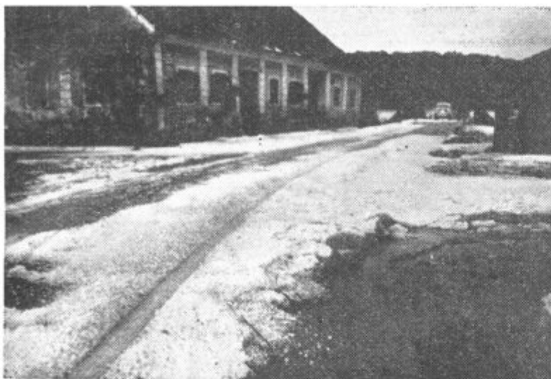
Na sliki vidimo, koliko toče je zapadlo. Pokrajina je zimska, ponekod je plast toče dosegla 30 cm.

VOLČINA, GOČOVA IN CERKVENJAK NAJHUJE PRIZADETA PO TOČI — ŠKODA JE VEČMILIJONSKA — NA NEKATERIH PODROČJIH JE TOČA DOBESEDNO VSE UNIČILA — KOMISIJE ZE UGOTAVLJAJO ŠKODO — PRI OBČINSKEM ODBORU SZDL USTANOVljen STAB ZA POMOČ PRIZADETIM PREBIVALCEM.