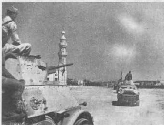
Naši oklopni odredi z oddelki letječega topništva prihajajo v zelenico SIWA.

Negovanček gotovo že ve, da mu moram prva dva sata od leve napolniti jaz, da bo lepo uravnovešil svoje zimsko gospodarstvo. Ker je bil drugače pridn, se bo tudi to pravočasno zgodilo.