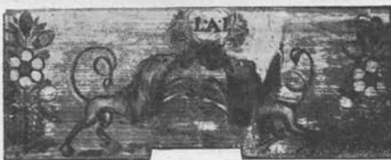
Končnice št. 37—43