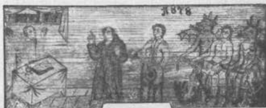
Končnice št. 44—50