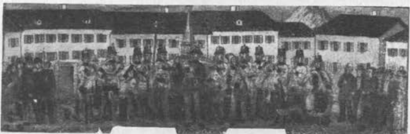
Končnice št. 51—53