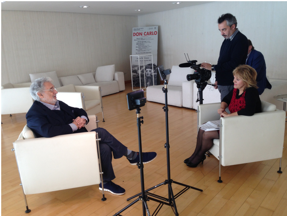
Intervju s Placidom Domingom v Valenciji

Prepričana sem, da so raziskovalni novinarji ne le v Rusiji, ampak tudi marsikje drugje, trn v peti raznim tajkunom, ki se jih želijo čimprej znebiti. Poskušajo s podkupovanji, če to ne gre, pa se poslužijo drugih, bolj krutih metod. Najhujši udarec za vsakogar je gotovo medijsko razkritje, dokler nekaj nezakonitega počnejo za svojimi vrati, se počutijo varne. Ko pa začnejo novinarji razkrivati njihova nezakonita dejanja, pa se počutijo ogrožene in jih poskušajo utišati.