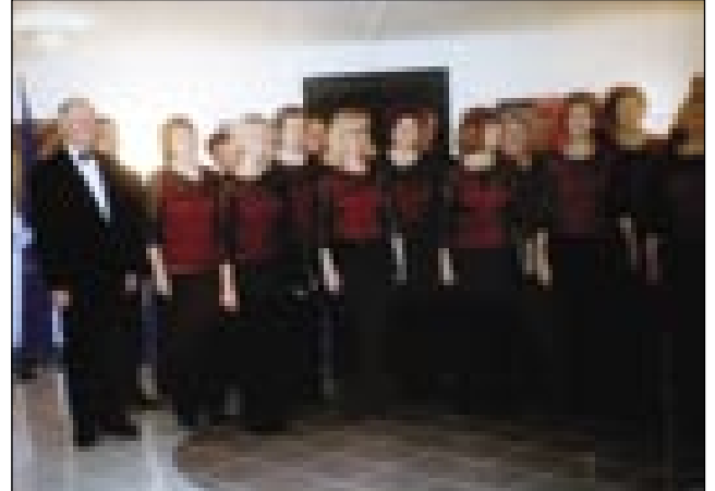
Zapel je pevski zbor Lisca

France Prešeren je v prvi polovici 19. stoletja odkril nove možnosti razvoja književnosti, tako ga upravičeno uvrščamo med najpomembnejše slovenske literate. Na dan njegove smrti praznujemo slovenski kulturni praznik.