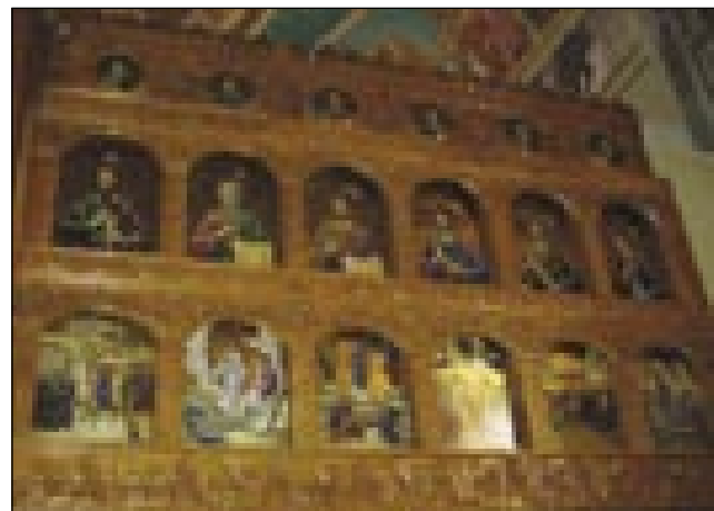
Pravoslavni ikonostaz v vesnici Mëhkerék

depa škipke pa segnjeno mlejko so tõ redili. Segrejte škipke so talali sausadnjim mlajšom, ka aj bi tak njina krava več mlejka mejla. Gda je svetek ali gostüvanje bilau, so birkeči golaž (pörkölt), pečeno kokauš, vrtanek, vino pa paukaraj ponüdili. Za torbino so srmacke špek, krü pa vino na sto djali. Prvi den na božič so smeli küjati, depa nalečti so se mogli že en den prva. Za nauvo leto so samo svinjsko mesau pekli, ka prej svinja naprej kopa, kokauš pa nazaj. V vodau, v šteroj se je držina mujvala, so en penez djali pa s toga testau spekli. Što je penez najšo, je cejlo leto srečen biu. Za post so samo ribe,