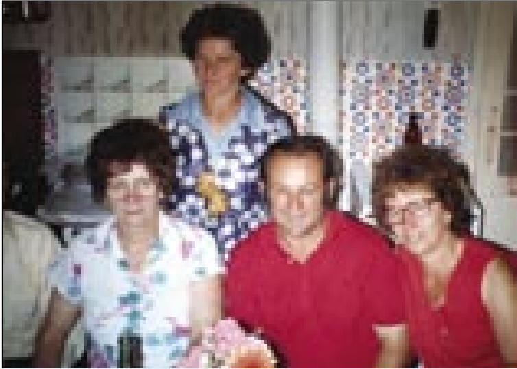
Tretja sestra (prva z leve) doma na gledanji.

(anyós), ka je kumaj leto dni stara, samo sin je z njim, on je tri leta star. So bogati, majo verstvo, konja, grünt, vse, ka trbej. Če notraprivoliš pa se oženiš z njim, nika ti nede falilo.' Ona je tau nej stejla čüti. Njeno srce je samo za njenoga