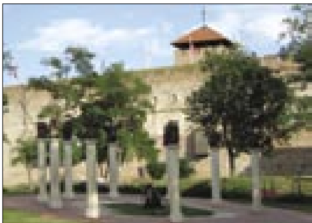
Grad s cüglã v Gyuli, centri Romunov

vekši tau lüstva romanarski biu, pa so leko svoj gezik nücali. Ortodoksna pa grkokatoliška võra je tõ dosta pomagala, ka so gorostali. Eške gnes majo 20 svoji far. Njine cerkve so ovaške od tisti na Romanskom, od zvüna se ne pozna, ka so ortodoksne. Od vsej manjšin na gnešnjom Vogrskom