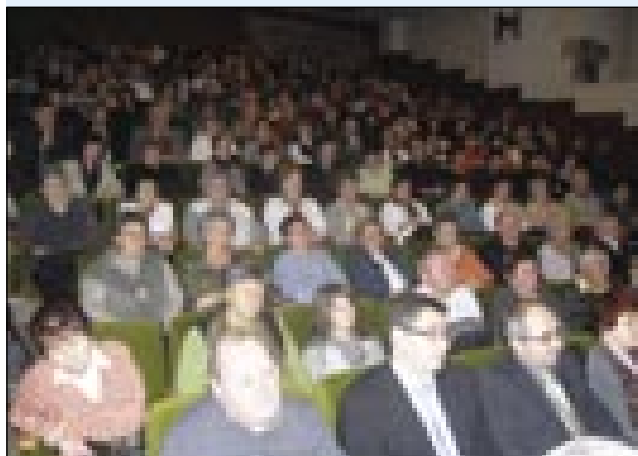
Gledališka dvorana je bila nabito puna