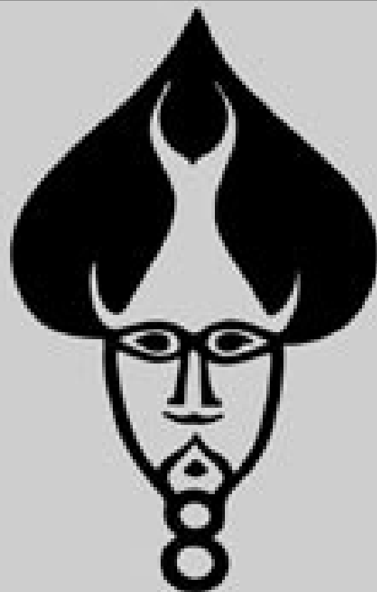
prof. Evgen TITAN: Strašilo (orig. izr.-papir) 2009