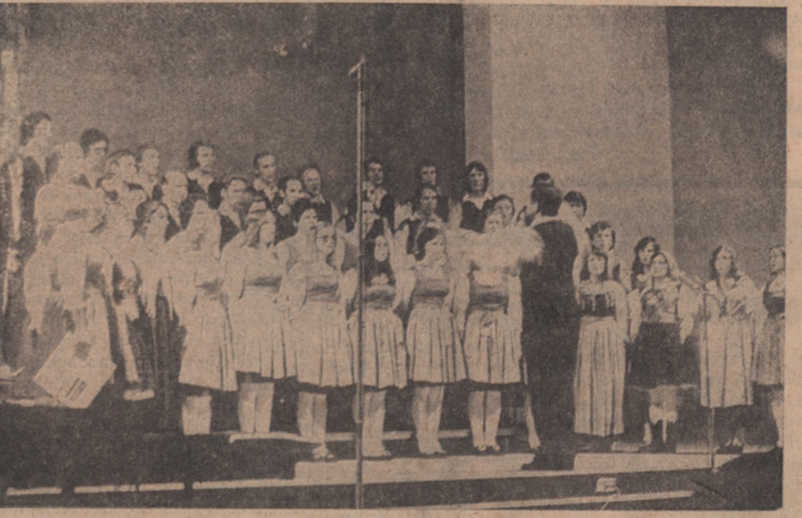
Mešani zbor "Gallus" s Koroške med nastopom.

Za informacije (v različnih jezikih) kličite v Torontu: 965-8470, izven Toronta pa kličite brezplačno, če kličete "0" in proušite operatorja, da vas poveže s številka Zenith 8-2000.