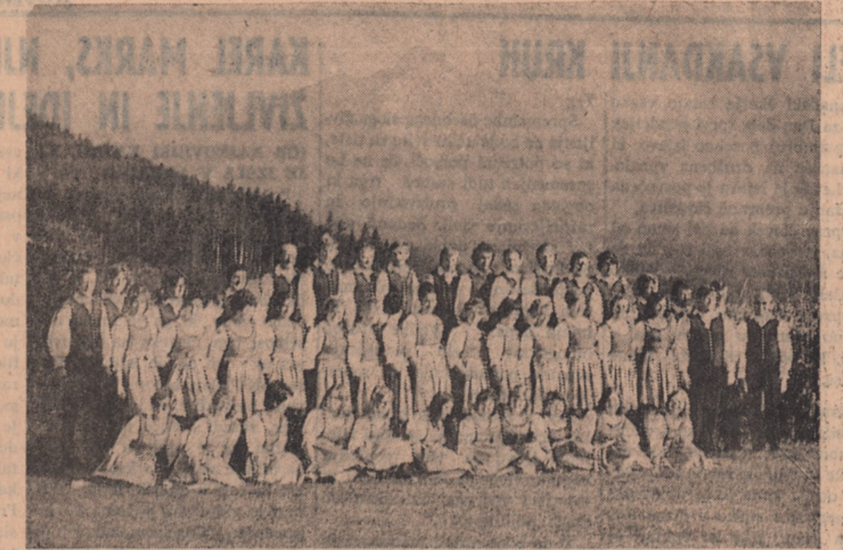
"Jakob Petelin Gallus" — pevsko društvo iz Celovca.