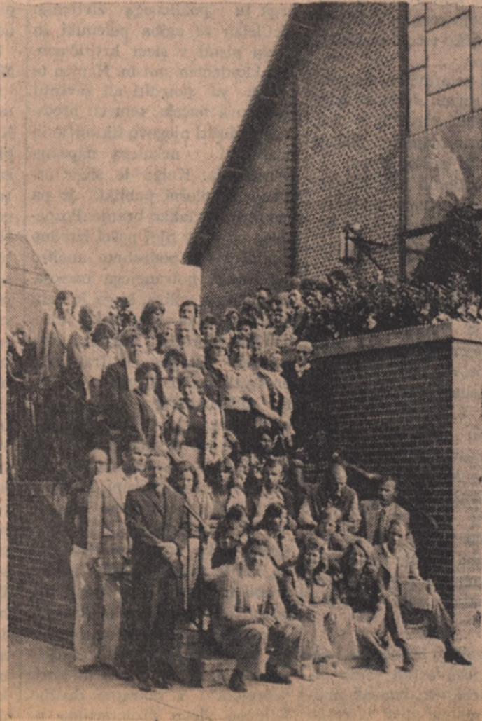
Po ogledu cerkve Marije Pomagaj