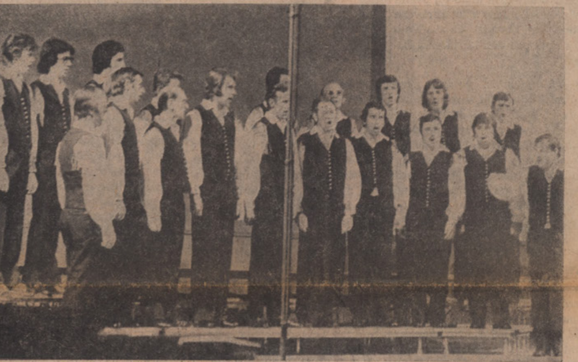
Moški zbor "Gallus" je pokazal polno risciqlino.