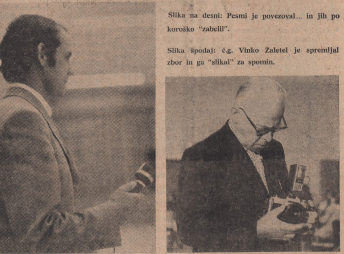
Slika na desni: Pesmi je povezoval... in jih po koroško "zabellil".