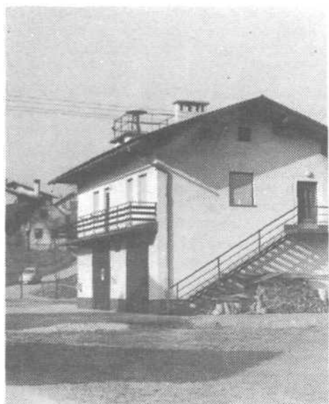
Novi gasilni dom v Goričici

Sicer pa krajanji Goričice hodijo po vsak-