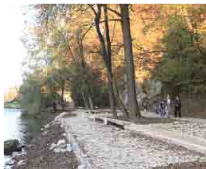
Odrptje novega dela poti ob vznožju Šumberka