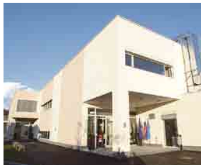
Otvoritev razširjenega Vrtca Krtek in podružnične šole v Ihanu