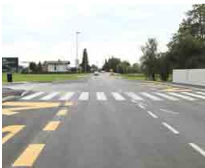
Nova podoba Prešernove ceste