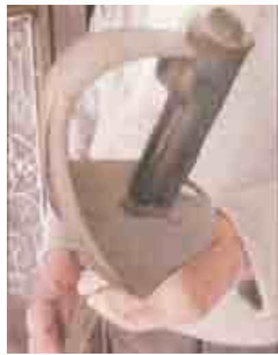
Konjeniška sablja francoskega častnika, ki so jo našli na podstrešju kmetije v Trzinu. Uporabljal jo je konjenik jeseni 1813, v bitki pri Loki pri Mengšu.