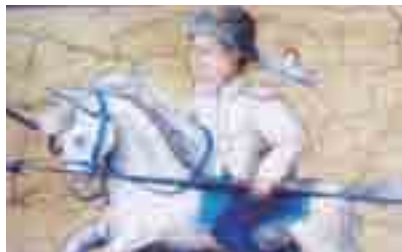
Avstrijci kot angelčki... (glej angelčka pri glavi avstrijskega vojščaka).