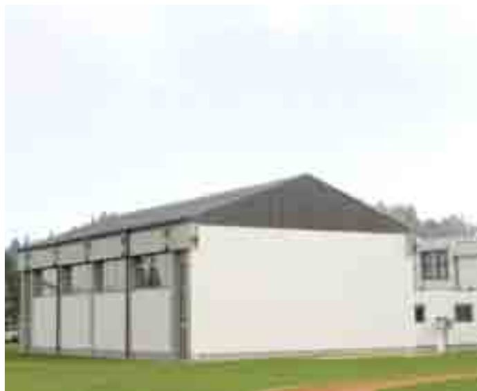
Energetska sanacija OŠ Domžale

OBČINA DOMŽALE, URAD ŽUPANA