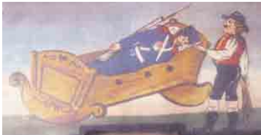
Ko ga je nahranil, je moral slovenski kmet francoskega vojaka naposled še ujčkat v zibki.

je drevje padlo nanje in pod seboj pokopalo osvojevalne francoske okupatorje. Menda je v Krašnji ob nekdanji šoli kar veliko Francozov našlo svoj zadnji dom.