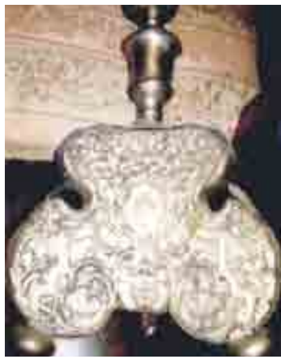
Ob zmagi na Mengeškem polju so v zahvalo za pomoč Avstrijci kupili tale svečnik cerkvi na homškem hribu.

Francozom v deželah, ki so jih začasno osvojili, potem tudi niso cvetele rožice, kakor tudi v Evropi ne. Napoleonova zvezda je dokončno ugasnila s tridnevno bitko pri Leipzigu – 16., 18. in 19. oktobra 1813, saj je tedaj generalu Marmontu prišepnil: »Moja šahovnica se mi je podrla!«