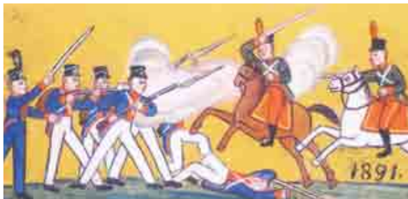
Bitka pri Mengšu je ostala zabeležena tudi na panjski končnici.