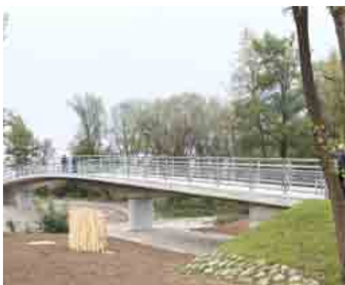
Novozgrajeni most Gaj na Škrjančevem