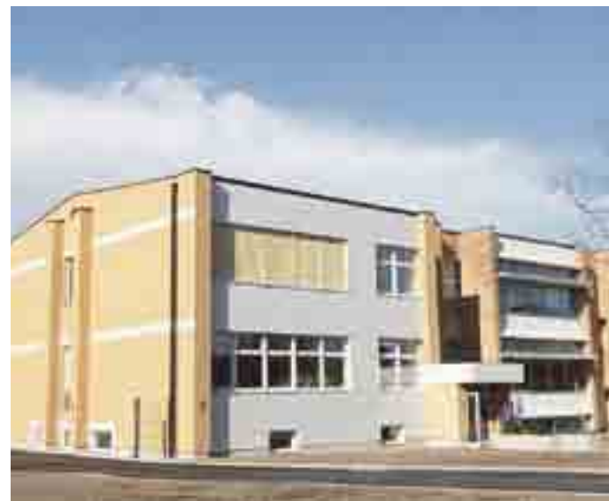
Nov prizidek pri Osnovni šoli Rodica