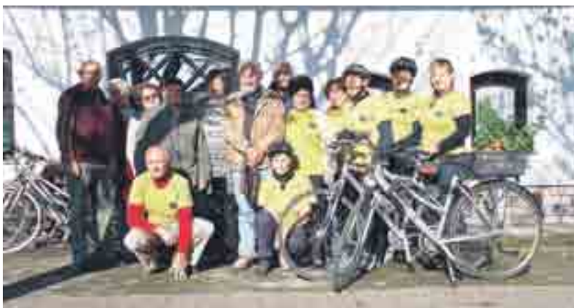
Lipini kolesarji ob zaključku sezone

Člani, ki se združujemo v društvu Lipa Domžale, Univerza za tretje življenjsko obdobje, ne skrbimo samo za ohranjanje svojih umskih sposobnosti pri pridobivanju novih znanj in poglobljanju že pridobljenih, temveč skrbimo tudi za rekreacijo.