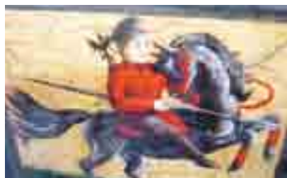
Francozi kot hudiči... (glej hudiča pri glavi francoskega vojščaka)