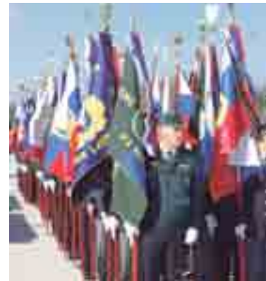
Postroj veteranskih praporščakov v Cerkljah.