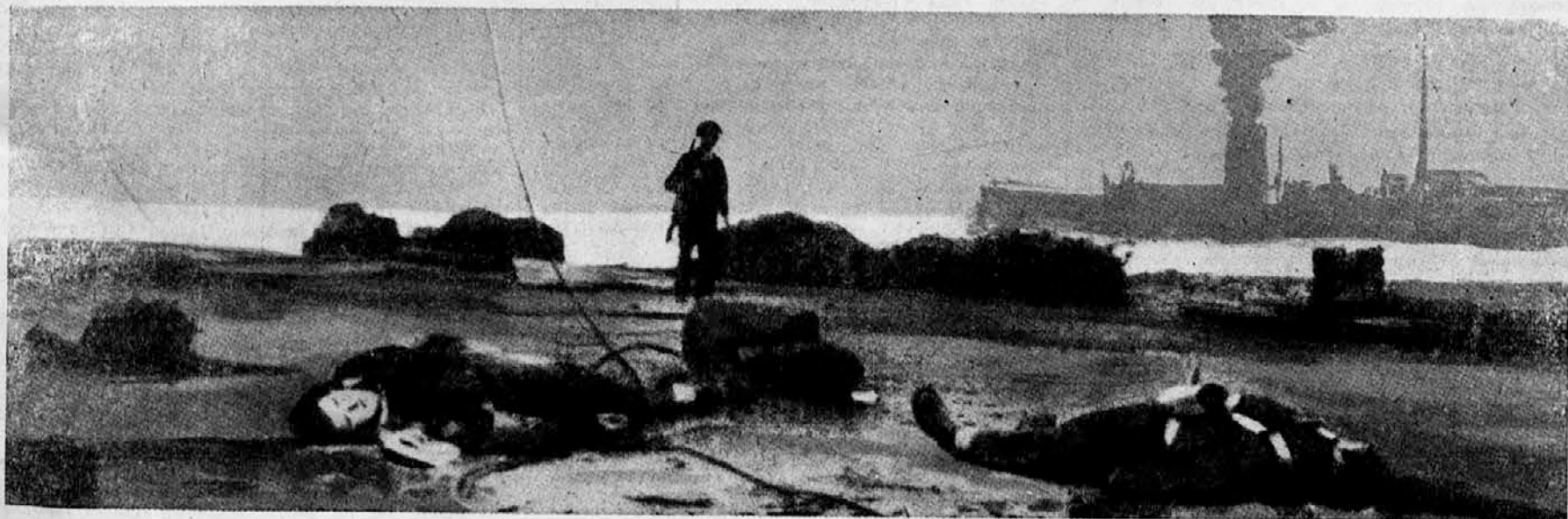
Angleški mrtvi v St. Nazairu

Slične angleške zmage bodo nadaljevale dokler angleški narod, ki je vedno izkoriščaval siromake celega sveta in ki je s pomočjo židov in komunistov gospodaril vsem narodom, ne bo enkrat za vselej premagan in obvladan.