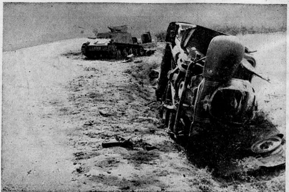
Angleški oklopni vozovi po bitki