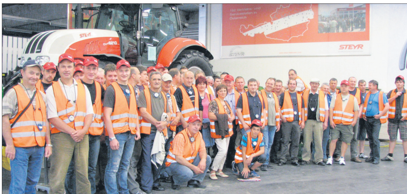
Skupni posnetek v tovarni Steyr