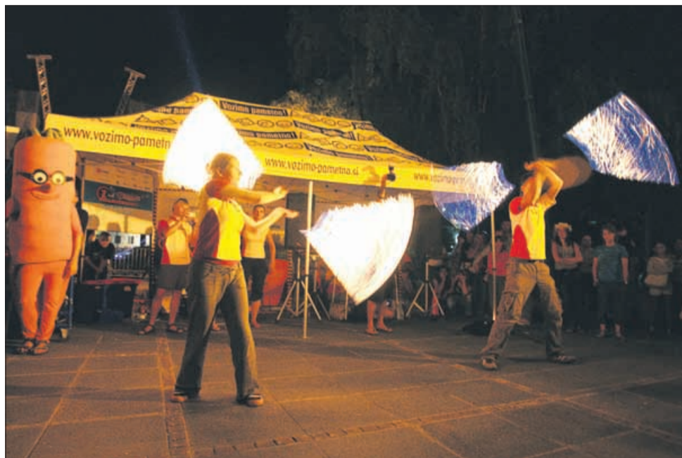
V Laškem so obiskovalce opozarjali tudi, da je treba »z glavo na zabavo«.