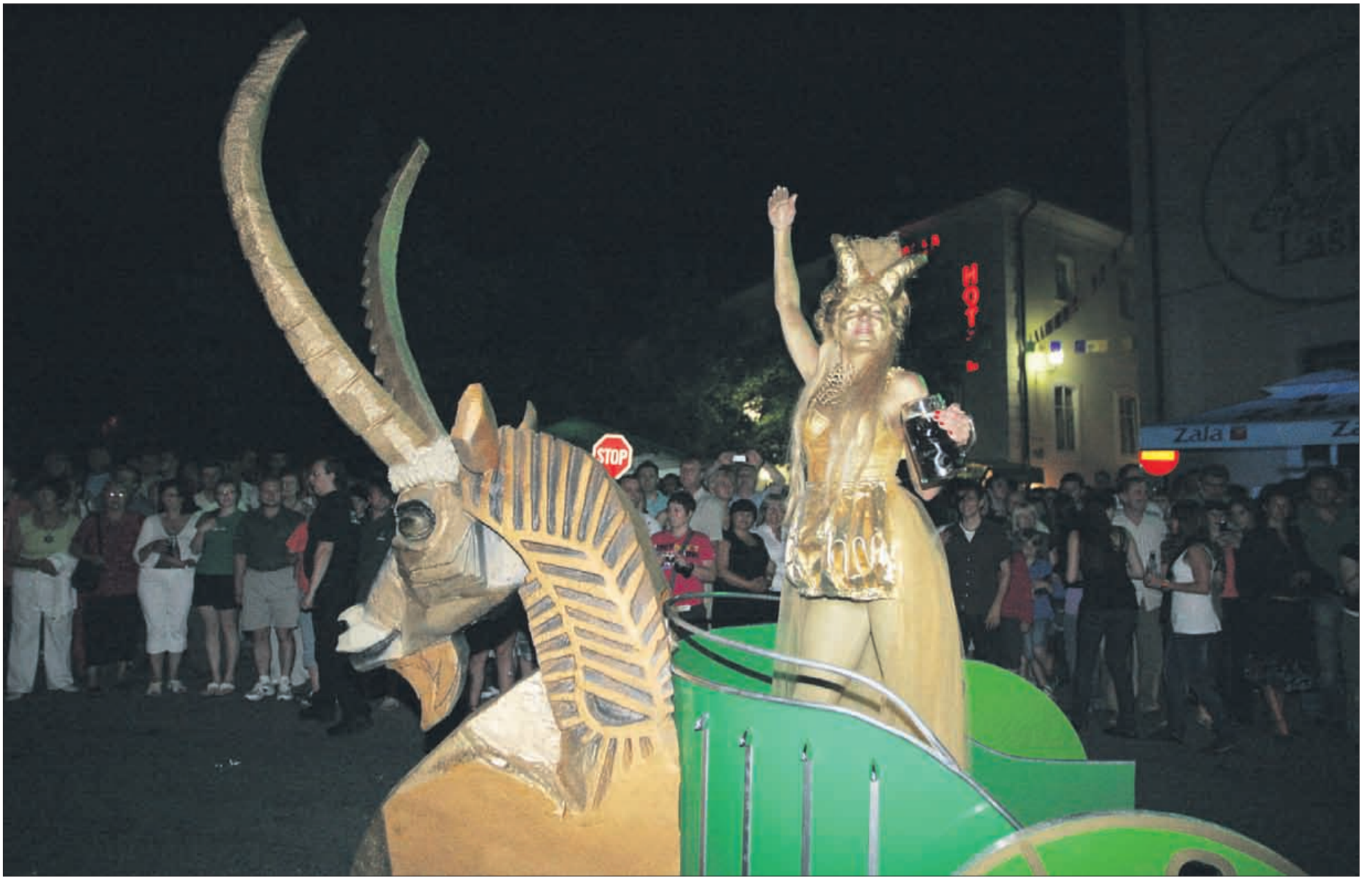
Petkova nočna atrakcija je bila letošnja novost Piva in cvetja, šov para Zlati rog na čelu z zlato kraljico.