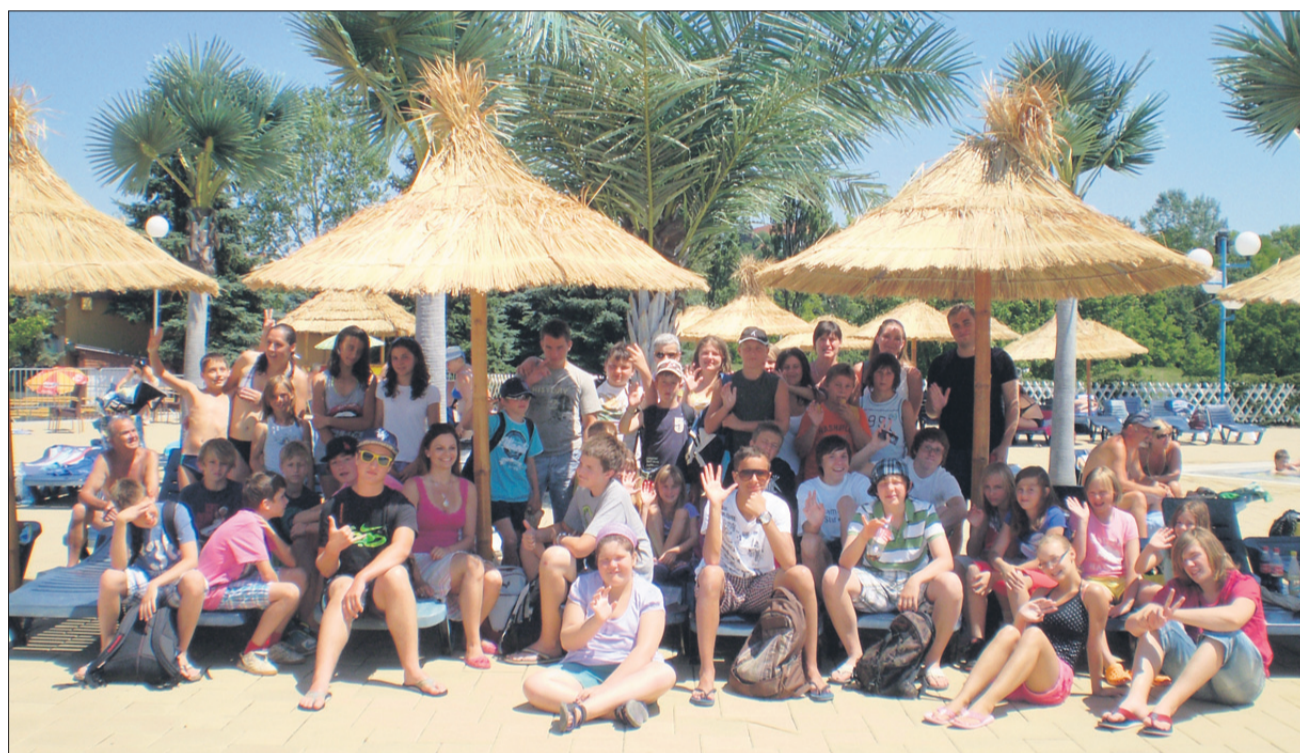
Veseli počitniški četrtak v ptujskih Termah