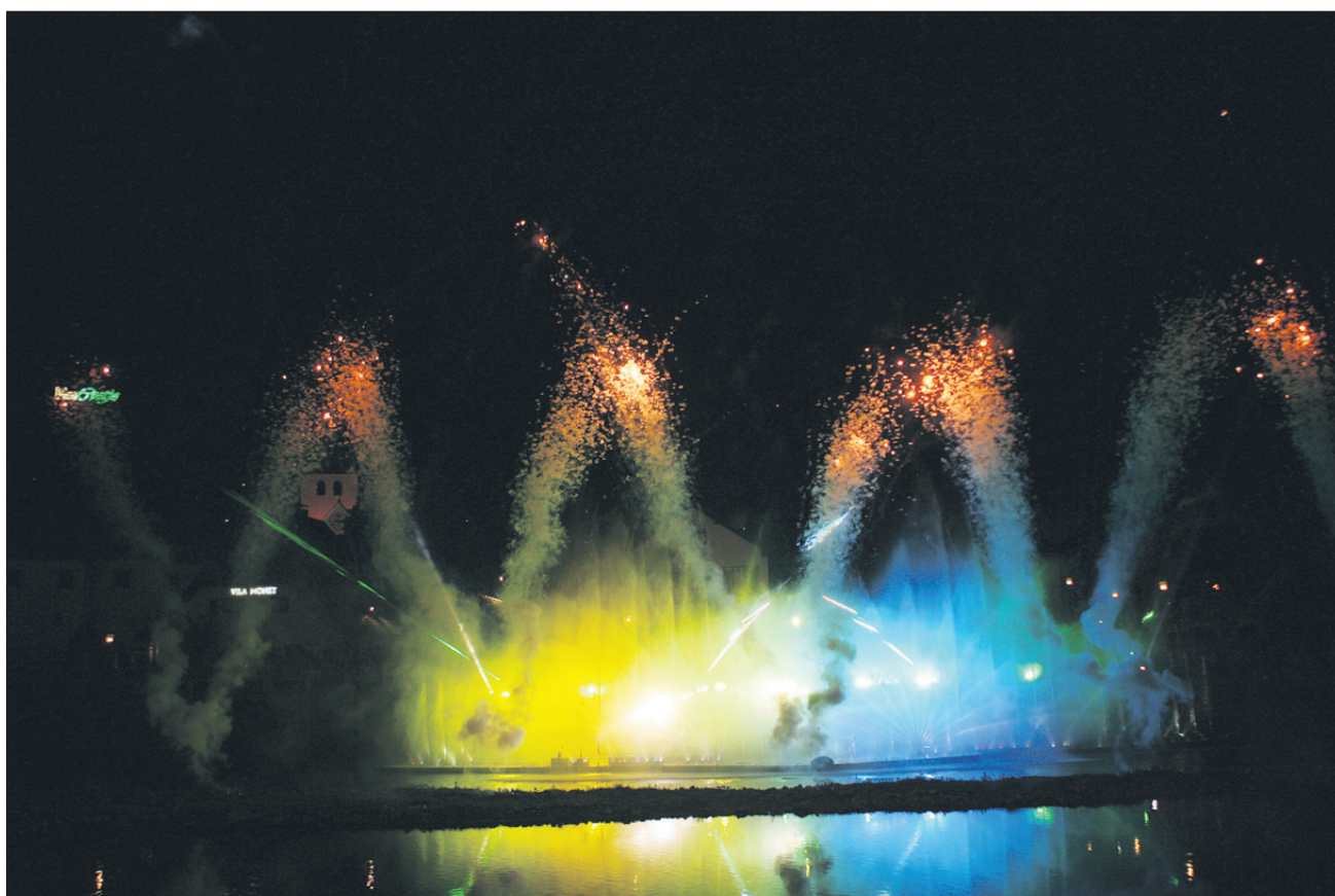
... nato pa še veličastna vodna simfonija.