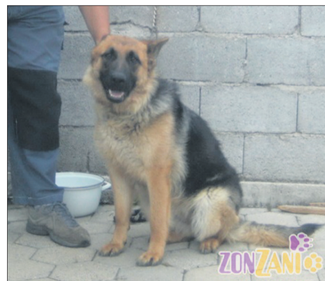
Nekdo v okolici Celja me zagotovo pogreša. Kdo pa ne bi pogrešal 8-mesečne lepote? (8142)