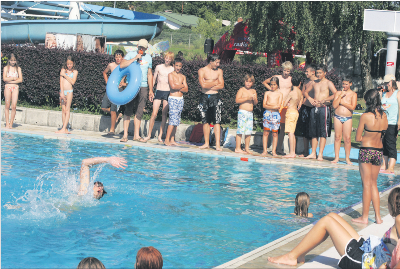
Zadnji zamahi do nagrade.