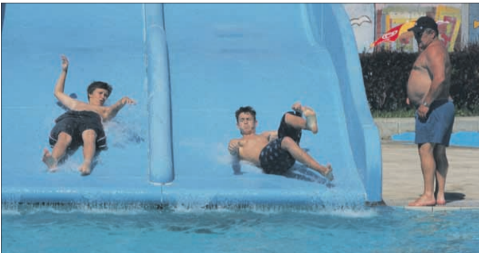
Neee, hočem bit' prvi!