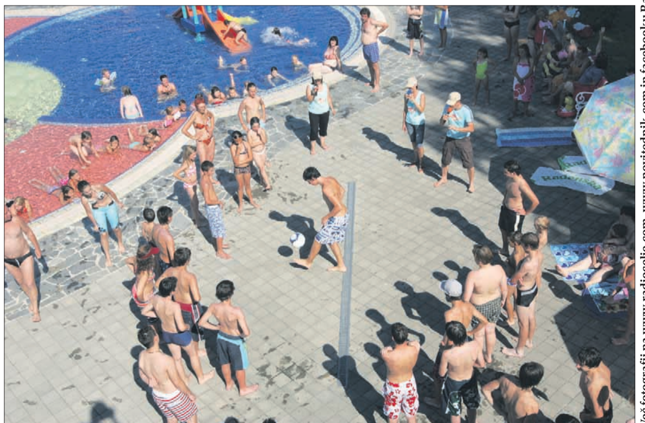
1, 2, 3, ... prešteli smo do 69 in postavili nov rekord.