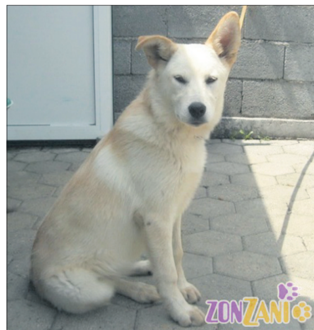
O kakšnem snegu le govoriš? Jaz trenutno razmišljam o morju in kopanju in o kakšnem »pirčku« ... (8140)

Uradne ure: od ponedeljka do petka od 8. do 16. ure; ogledi psov: od ponedeljka do petka od 12. do 16. ure. Sprehajanja od ponedeljka do petka od 12. do 16. ure, ob sobotah od 10. do 12. ure (obvezna predhodna najava vsaj en dan prej po telefonu zavetišča). Telefon: 03/749-06-00; internetni naslov www.zonzani.si