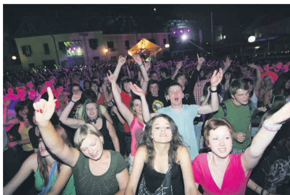
Takole so obiskovalci noreli ob koncertu Rock Partyzanov.