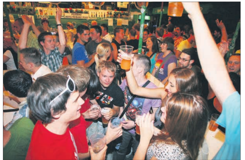
Sobotna noč je v Laško privabila brez števila obiskovalcev, ki so do zadnjega napolnili vse klopi. Pivo je teklo v potokih.