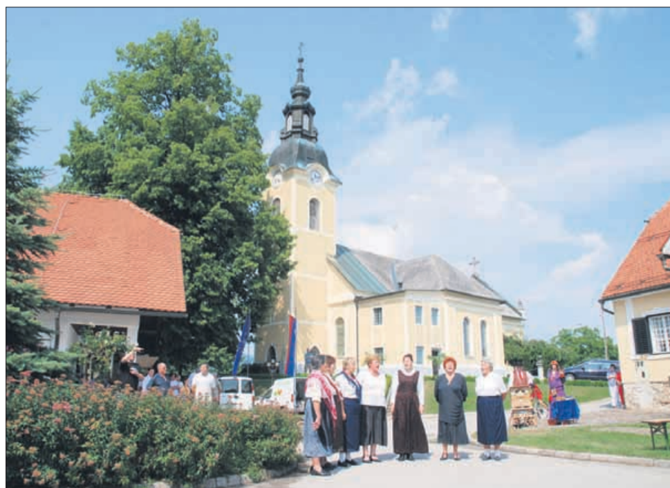
Ljudske pevke s Ponikve so zapele v uvod Romanja po Sloveniji.

nica in na odru z dvema pesmima. Tokratna prireditev je bila res nekaj posebnega, izvirnega in doživetega. Žal tako kot lani organizatorji tudi tokrat niso imeli najbolj sreče z vremenom, a so kljub temu vse skupaj uspešno spravili pod streho. DN