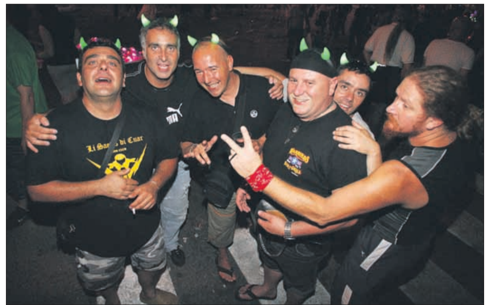
Od kod so se pa tile hudički vzeli?