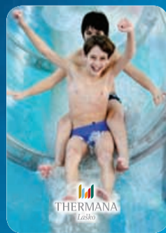
Vstopnice za kopanje v Termalnem Centru Wellness Park Laško