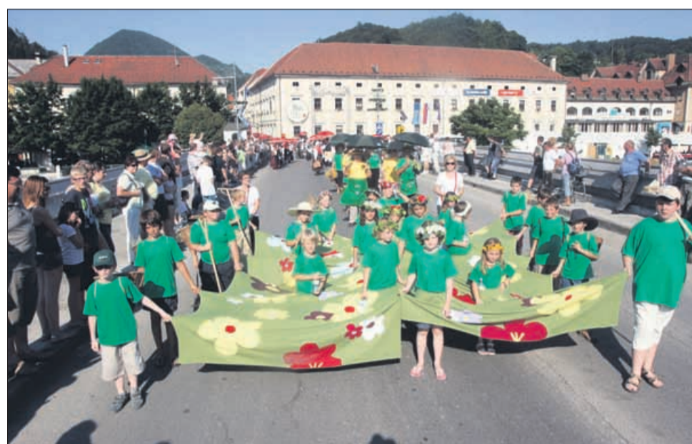
Nedelja, zadnji dan Piva in cvetja, je imela pompozni zaključek. V paradi so sodelovali tudi najmlajši.