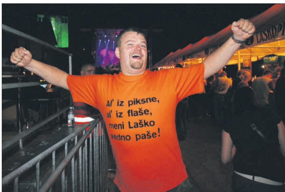
Brez komentarja ...