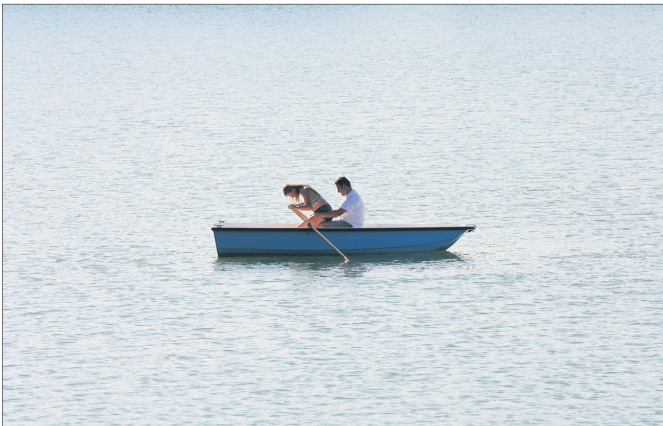
Enojec s krmarjem