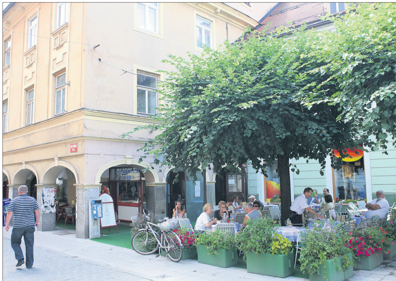
Nova najemnica Zvezde želi najprej urediti vrt ter osvežiti fasado. Poleg sladice želi ponuditi tudi lahko hrano.