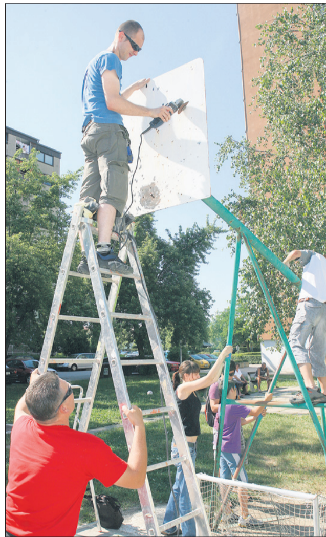
Na pomoč je priskočilo veliko mladih in prostovoljcev