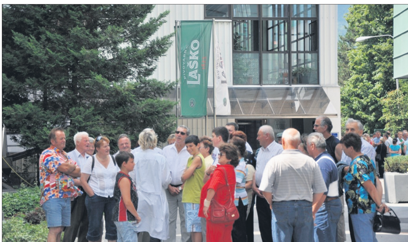
Ob dnevu odprtih vrat prejšnjo sredo je pivovarno obiskalo okrog 1.200 ljudi.

Boste podprli predlog, po katerem naj bi odločali o