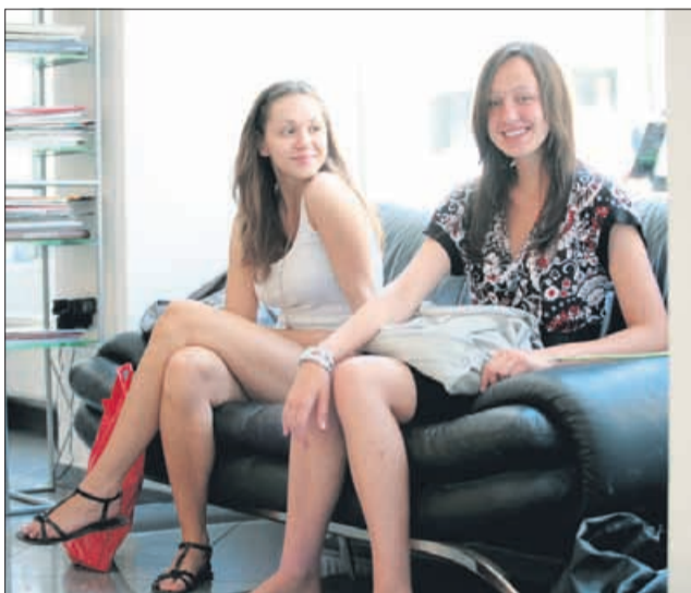
Čakanje je del posla vsake manekenke.