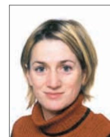
Piše: PAVLA KLINIER

Črni ribez se lahko pohvali z velikimi količinami eteričnega olja, vitaminoma A,