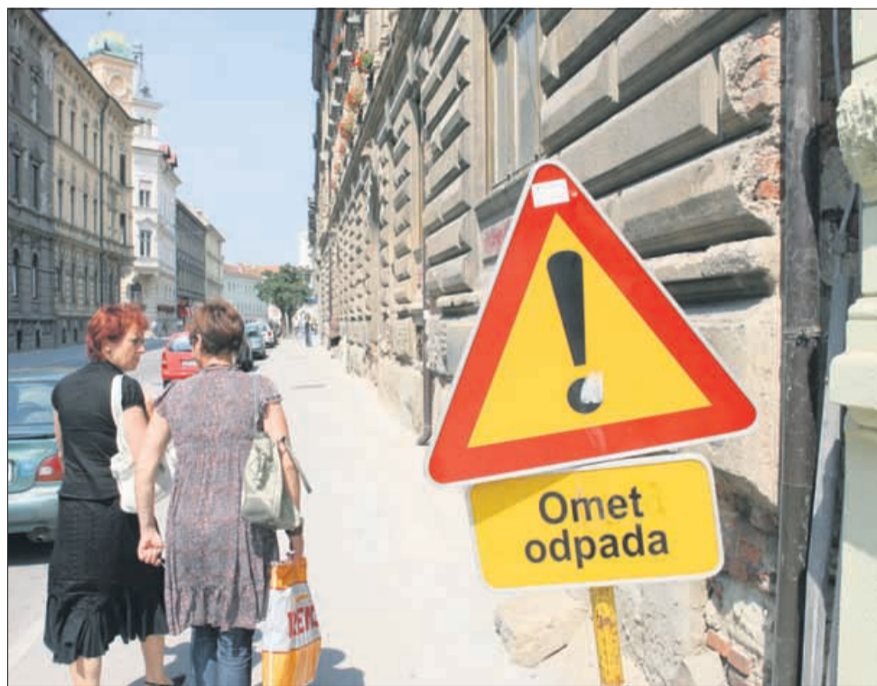
Fasade zgradb v Cankarjevi ulici so postale ne le neprijetne na pogled, ampak tudi nevarne. Za njihovo obnovo pa lastniki nimajo denarja.

Skupina Pivovarne Laško je lansko poslovno leto končala s 162 milijoni evrov čiste izgube. Ima 127 milijonov evrov dolgoročnih in 327 milijonov evrov kratkoročnih dolgov.