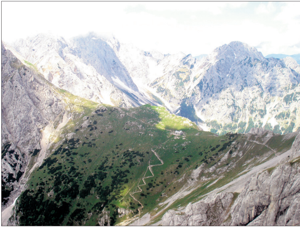
Pogled na Kamniško sedlo