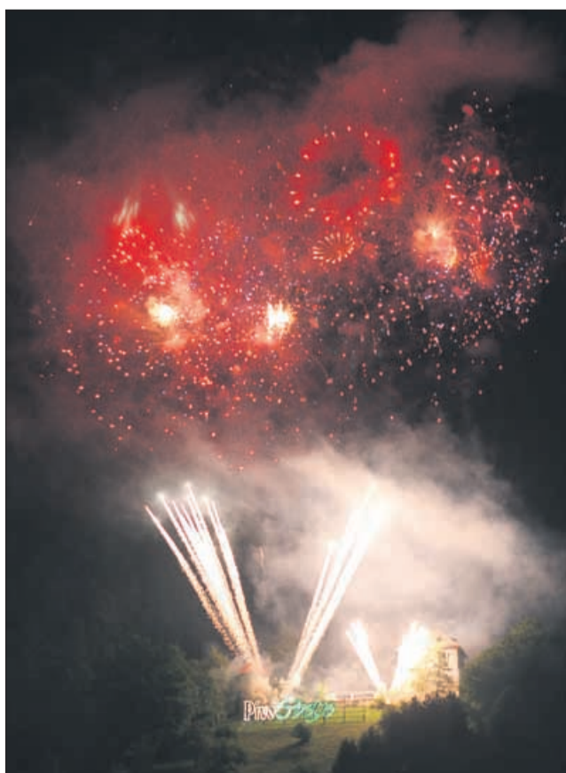
Ognjemet tokrat ponovno z dveh hribov ...