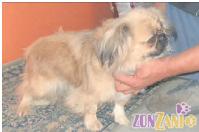
Pekinezerka sem, čisto ta prava, stara kakšni 2 leti, najdena pa sem bila v Podčetrtku. Malo sem prestrašena, a zelo prijazna. No, lastniki moji, čakam vas. (8139)

Kako štirinožca vidi otrok? Kot plišastega medvedka, ki je mehke in tople in se premika sam. Z njim se je mogoče loviti, ga vleči za dele telesa, ga uporabljati kot oporo pri hoji ... Torej, kuža je v otrokovih očeh idealna igračka. In kako pes vidi otroka? Sprva ga ne vidi veliko, saj večino časa leži v postelji, a sliši in vonja se ga vedno. Ko se premika, se glasno oglašuje, krili z rokami in je nadvse nepredvidljiv. Vtika se v vse, kar pes počne, zanima ga njegova hrana, voda, njegova osebna higiena. Nепrestano se ga dotika, tudi tako, da boli. Tukaj