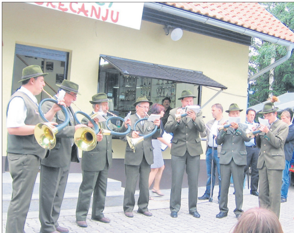
Savinjski rogisti na drugem srečanju lastnikov in upravljavcev zemljišč pred lovsko kočjo nad Dobrno