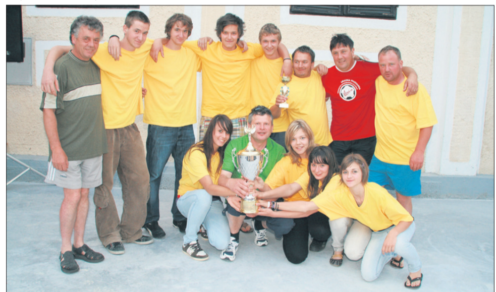
Predstavniki dveh Galicij