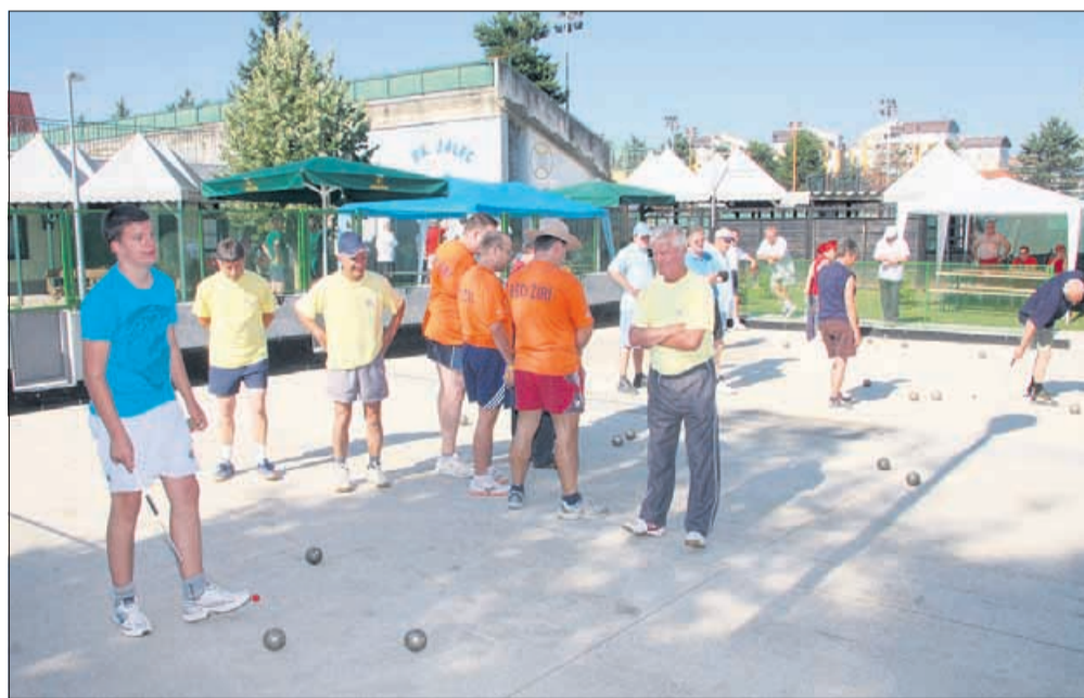
Polzelski balinarji so tekmovali v rumenih majicah.