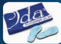
Kopalni Oda paket

Sodelujte v SMS NAGRADNI IGRI s 120 osvežujočimi tedenskimi nagradami: