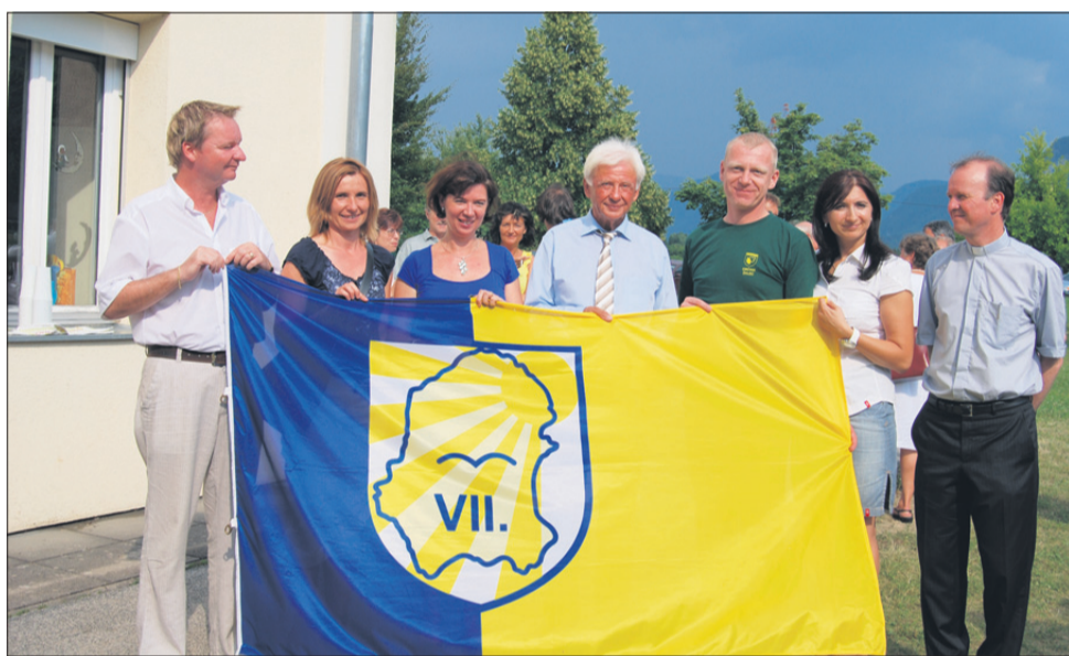
Med desetimi sodelujočimi konjiškimi KS so letos na športno-družabnem srečanju zmagali tekmovalci KS Žiče. Na 2. mesto so se uvrstili tekmovalci iz KS Sojek-Kamna Gora in na tretje ekipa KS Polene.