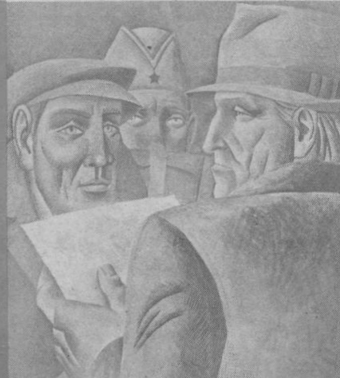
Ive Šubic: Partizanska prisega (detajl freske v Poljanah nad Skofjo Loko)