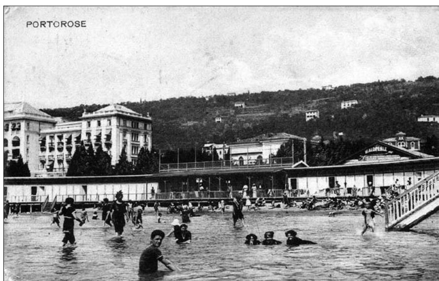
Portorož, 1923 (wikipedia)

infrastrukturo in ponudbo na trgu. Kraji, ki so se znali promovirati in ponujati kot sedeži prijetnega bivanja, vzpostaviti ustrezno infrastrukturo, bili sposobni nuditi prijetno in udobno bivanje ter privabiti goste določenega družbenega sloja, so si lahko obetali uspešno turistično »kariero«. 4