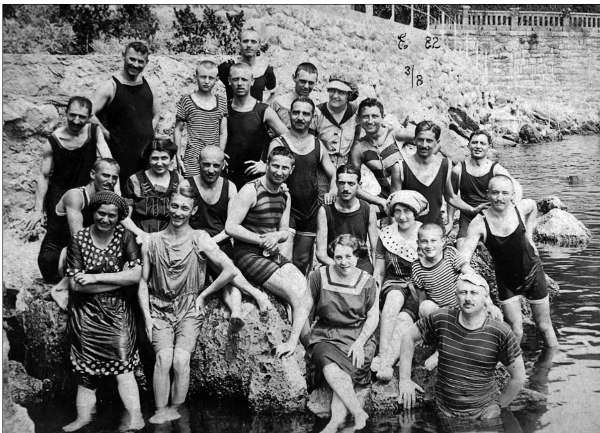
Kopalci v Opatiji, 1910

niški izletniški liniji avstrijskega Lloyda na relaciji Trst–Reka parnik pristajal tudi v Piranu, Novigradu, Poreču, Rovinju in Pulju. 7 Opatija, ki je bila že pred razvojem zdraviliškega turizma znana izletniška točka prebivalcev bližnjih mest, je bila leta 1867 povezana z Reko z izletniško potniško parniško linijo, ki je vozila vsak dan, z večkratnimi dopoldanskimi in popoldanskimi prihodi in odhodi. 8 Z Reke se je, z ekspresno izletniško ladijsko povezavo, lahko obiskalo tudi Pulj ali Mali Lošinj. 9 Parniki do Opatije niso vozili le na lokalnih relacijah, saj so bile z Opatijo oziroma Reko vzpostavljene tudi parniške povezave z bolj oddaljenimi mesti, kot sta Benetke in Ancona, kar je kazalo na obiskovanje oziroma na nek dotok turistov s tega območja. Leta 1876 je bila uvedena tudi dnevna parniška