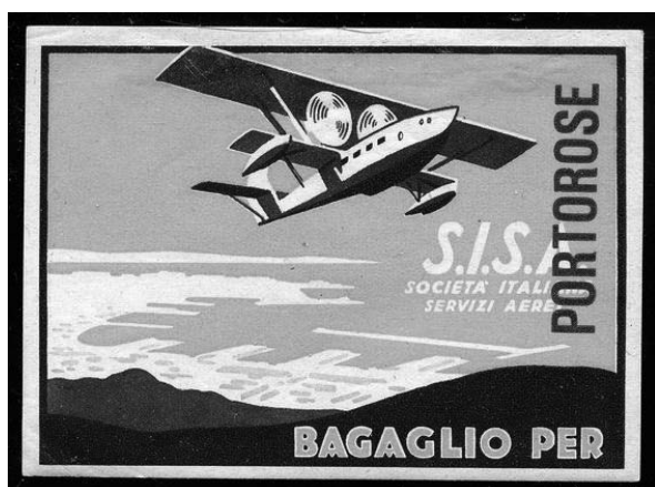
V dvajsetih letih 20. stoletja je bila vzpostavljena turistična letalska linija s Portorožem

Poleg prometnih povezav je bilo potrebno precej pozornosti nameniti tudi zabavnemu delu letovanja, na katerega je v svojem delu opozoril tudi Ancona. Na tem področju je prihajalo do večjih pobud, ki niso bile vselej realizirane. Med projekti velja omeniti načrt za žičnico Opatija–Učka (Vojak, 1396 m) v dolžini šestih kilometrov z vožnjo, ki bi trajala med 20 in 25 minutami. V načrtu je bila postavitev več zaprtih kabin, ki bi sprejemale do 16 oseb. Žičnica bi gostom nudila nepozabni pogled na Kvarnerski zaliv in bi tako predstavljala obogatitev turistične ponudbe Opatije in Kvarnerskega primorja. Pobudo za ta projekt je dala italijanska družba električnih žičničarjev ( Compagnia Italiana Funivie Elettriche ) v sodelovanju s podjetjem Ing. L. Znegg & C.o iz Merana. Kljub napovedi realizacije projekta v letu in pol, le ta ni bil nikoli izveden. 25 Poleg novih pobud so za zabavo gostov še naprej organizirali ples, koncerte, športne prireditve itd. 26