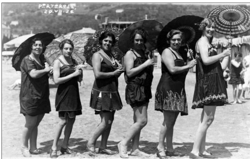
Na portoroški plaži, 1926 (wikipedia)